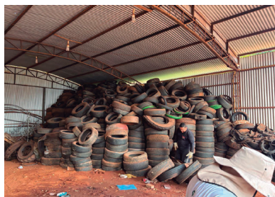
Imagem 15 - Barracão de armazenamento de pneus