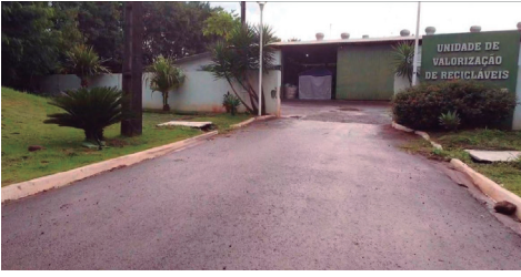
Imagem 10 - Frente da Unidade Valorização de Resíduos - UVR