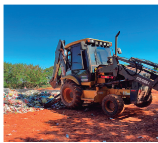
Imagem 18 - Cobertura dos resíduos no Aterro Sanitário sendo iniciada