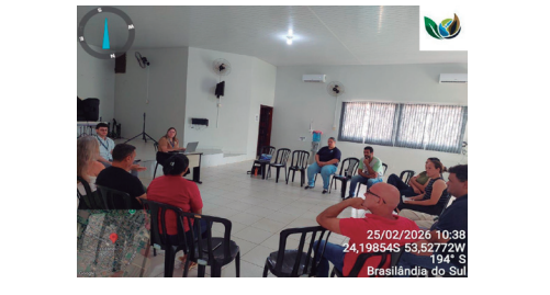
Imagem 2 - Primeira reunião do Grupo Gestor

Logo abaixo, serão inseridas as imagens correspondentes às reuniões mencionadas na tabela acima, com o objetivo de registrar formalmente a realização dos encontros do Grupo Gestor no âmbito do PMEARSU. As fotografias possuem caráter comprobatório e ilustrativo, demonstrando a efetiva participação dos membros, reforçando a transparência, a organização e a institucionalização do processo de elaboração do Programa no Município de Brasilândia do Sul.