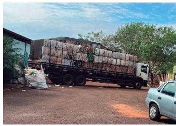
Imagem 11 - Carga de material vendido pela Unidade Valorização de Resíduos - UVR