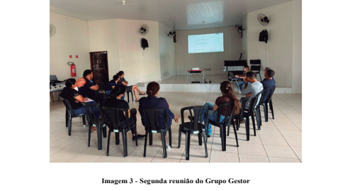
Imagem 3 - Segunda reunião do Grupo Gestor

O desenvolvimento do Programa Municipal de Educação Ambiental para Gestão de Resíduos Sólidos Urbanos no Município de Brasilândia do Sul parte da análise da realidade local, considerando tanto a forma como ocorre a gestão dos resíduos quanto as ações de Educação Ambiental já desenvolvidas no município. O diagnóstico foi