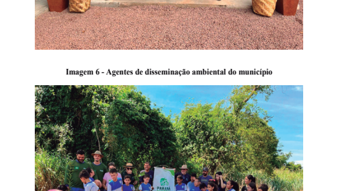
Imagem 7 - Educação Ambiental com o parceria do IAT