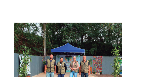
Imagem 6 - Agentes de disseminação ambiental do município