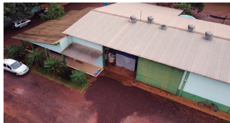
Imagem 12 - Vista superior da Unidade Valorização de Resíduos - UVR