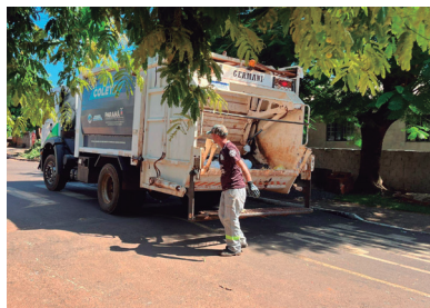
Imagem 14 - Coleta sendo realizada no município de Brasília do Sul