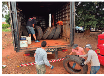
Imagem 16 - Pneus sendo encaminhados para a logística reversa