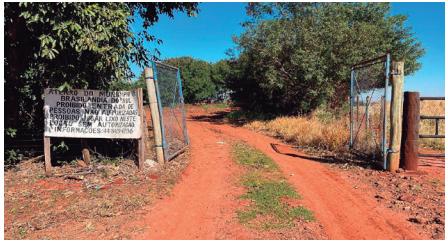
Imagem 17 - Entrada do Aterro Sanitário