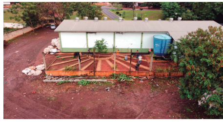
Imagem 13 - Horta sendo construída nos fundos da Unidade Valorização de Resíduos - UVR