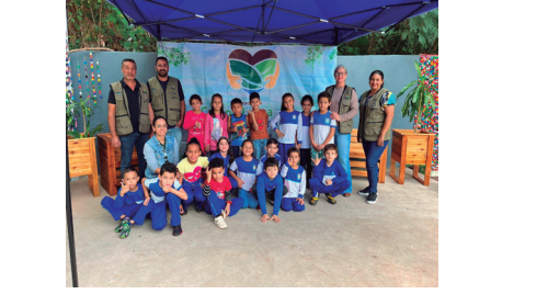
Imagem 4 - Educação Ambiental junto com a rede ensino na UVR

promovam maior participação da população na gestão adequada dos resíduos sólidos urbanos.