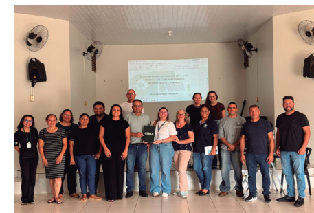
Imagem 19 - Apresentação do PMEARSU

Essa etapa reforça a transparência do processo, promove o alinhamento institucional e fortalece o compromisso de execução do PMEARSU no Município de Brasília do Sul, garantindo que todos os atores envolvidos compreendam suas atribuições e a importância do desenvolvimento contínuo das ações de Educação Ambiental relacionadas à gestão de resíduos sólidos urbanos.