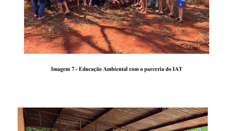
Imagem 8 - Oficina com os catadores da UVR sobre os 5S e Gestão de Conflitos