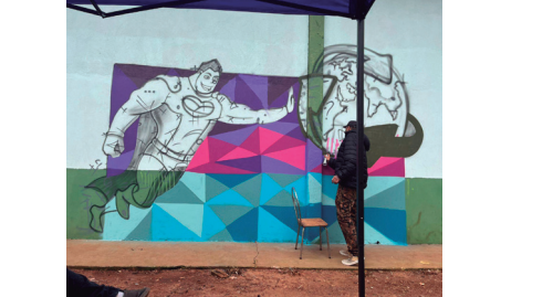
Imagem 5 - Oficina de grafite na UVR do mascote da reciclagem