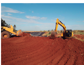
Imagem 10 - Cobertura de resíduos no aterro sanitário