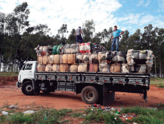
Imagem 7 - Material após triagem e enfardamento sendo encaminhado para venda