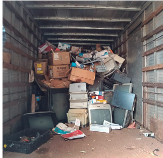
Imagem 5 - Campanha de recolhimento de resíduos eletrônicos - (23/10 2025)