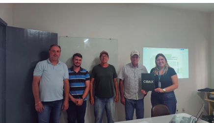
Imagem 11 - Apresentação do PMEARSU

Essa etapa reforça a transparência do processo, promove o alinhamento institucional e fortalece o compromisso de execução do PMEARSU no Município de Ivaté, garantindo que todos os atores envolvidos compreendam suas atribuições e a importância do desenvolvimento contínuo das ações de Educação Ambiental relacionadas à gestão de resíduos sólidos urbanos.