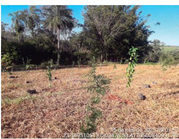
Imagem 8 - Plantio de mudas - (Maio de 2025)