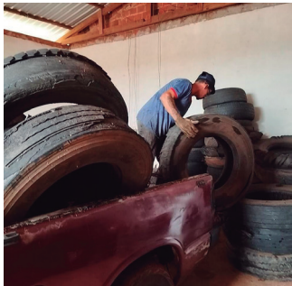
Imagem 6 - Campanha de recolhimento de pneus inservíveis