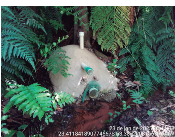
Imagem 9 - Recuperação de nascente (onda) - (Dezembro de 2024/Janeiro de 2025)