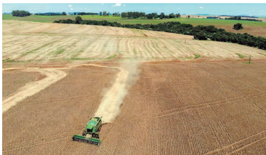
A primeira safra 2022/23 rendeu 193 mil toneladas de feijão cultivados em 115 mil hectares

O plantio da segunda safra de milho segue atrasado no Paraná. O percentual chegou a 77% da área estimada. Em condições climáticas normais, o volume deveria ter superado 90%. Em relação à primeira safra, a colheita atingiu 54%, também em ritmo