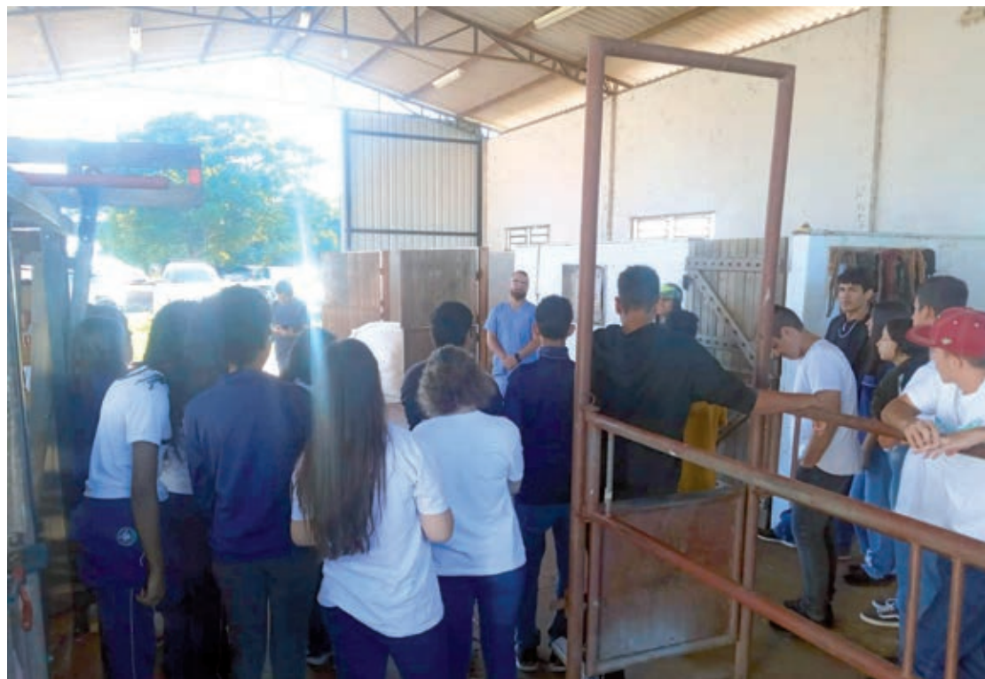
O projeto Fazenda do Conhecimento oferece uma série de atividades, as quais permite conhecer o campus

O projeto Fazenda do Conhecimento oferece