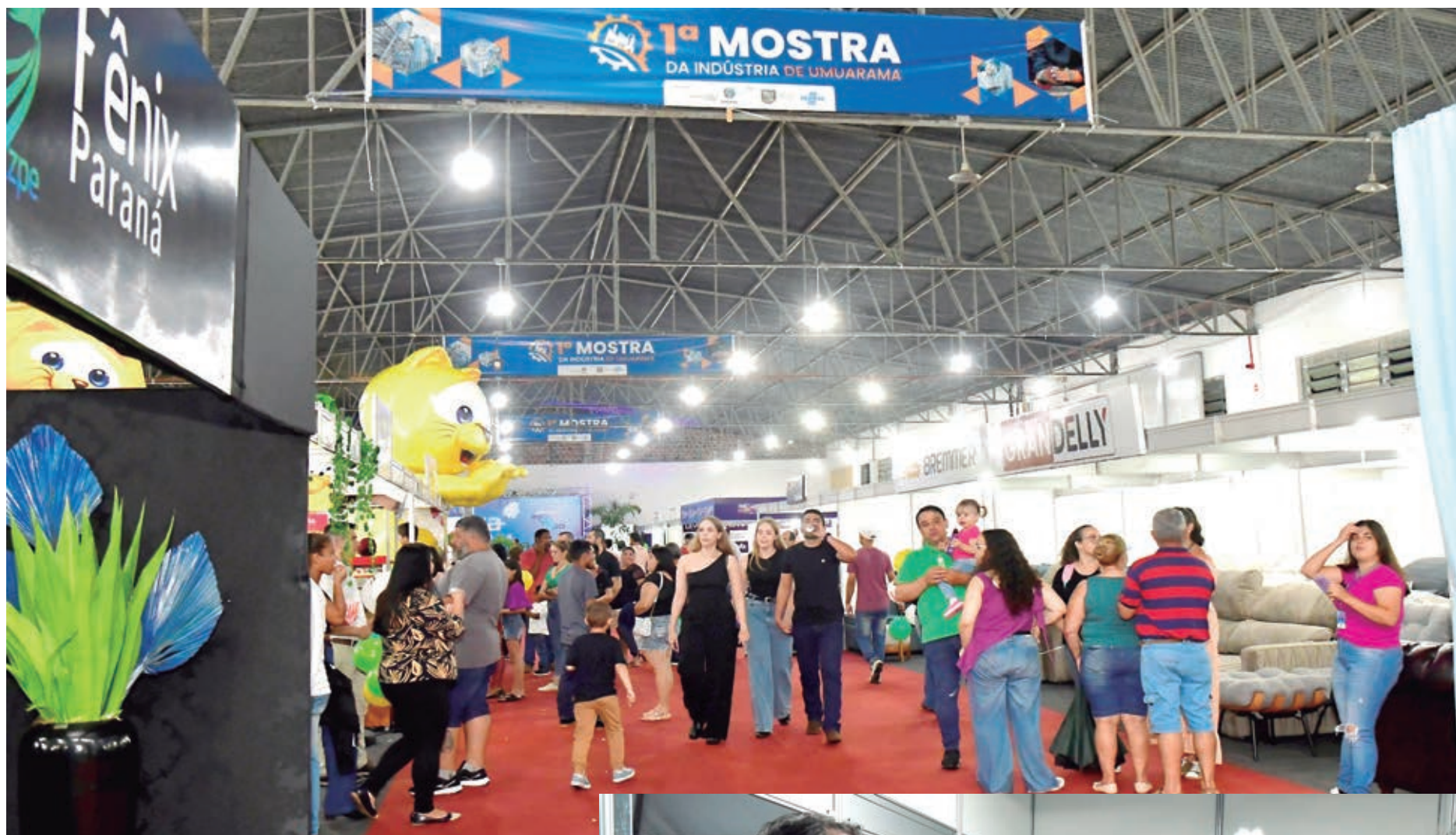
O público marcou presença na Mostra da Indústria de Umuarama

“Os estandes mostraram um pouco da evolução que Umuarama vive no setor industrial. Re-