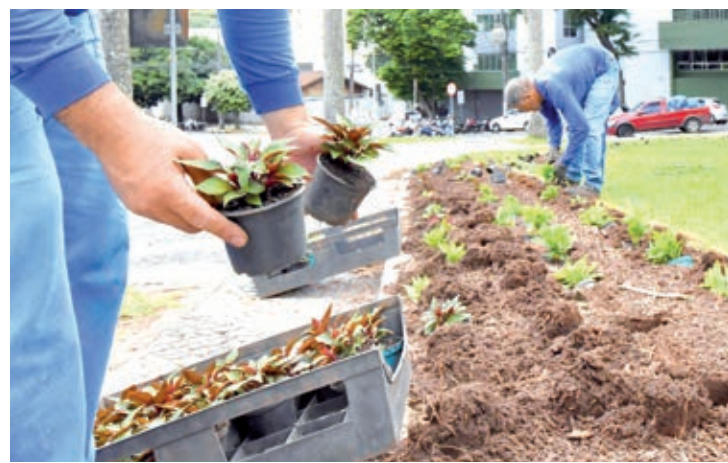
A espécie SunPatiens foi mantida devido ao seu colorido variado - são pelo menos nove tons diferentes

"Compramos as mudas pequenas. Elas são cultivadas na estufa da Prefeitura até atingirem o tamanho ideal para o transplante, no período mais adequado. Umuarama estará bem florida para as comemorações dos 68 anos de fundação no mês de junho. Com o devido cuidado teremos flores vistosas até o final de setem-