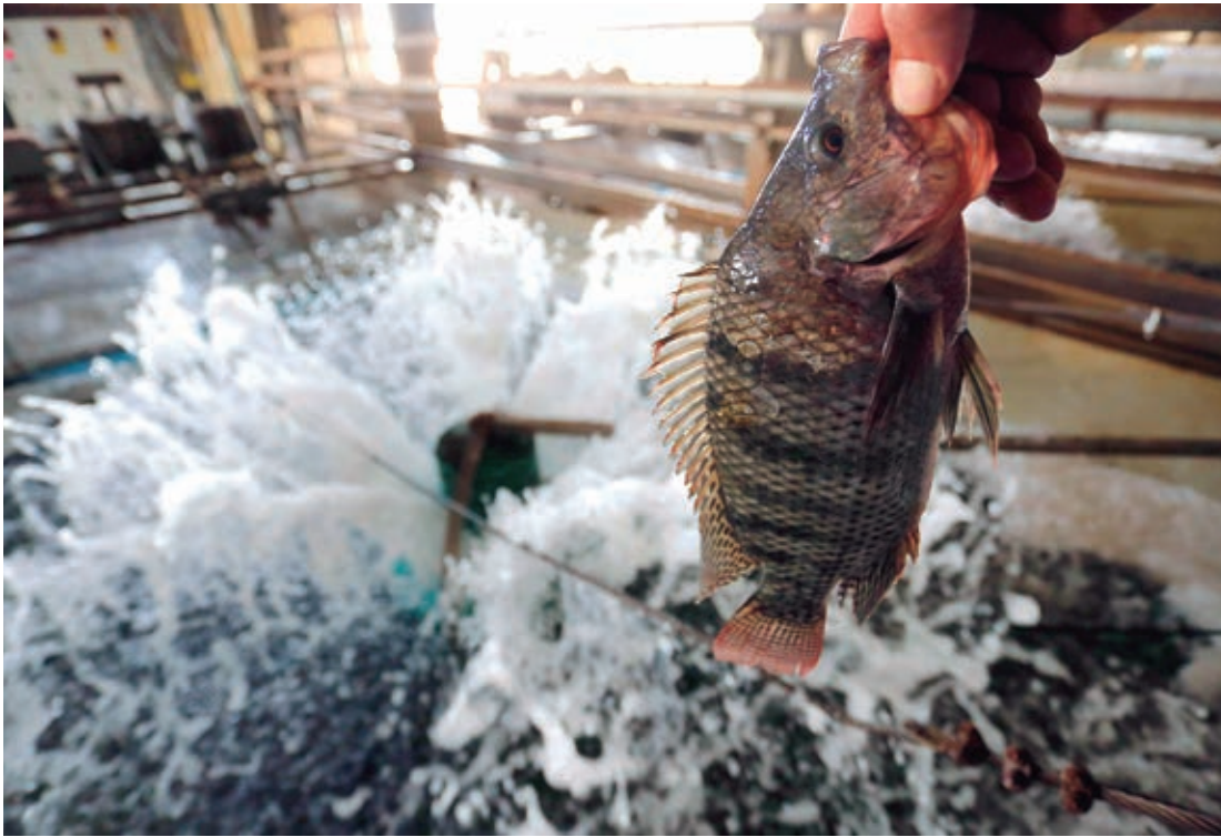
O Noroeste é visto como uma nova fronteira para a piscicultura, já que a região Oeste – o nascedouro da atividade – já encontra-se saturada

A piscicultura é uma boa oportunidade de renda, que demanda pouco esforço – embora constante – e produz um gênero alimentício muito valorizado, com mercado garantido. “Além disso, temos condições favoráveis em termos de clima, com temperatura bem adequada e um ciclo de produção estimado em oito meses, que pode ser menor quando a maior parte do crescimento dos peixes se dá no verão, gerando uma renda rápida e significativa para as pequenas proprie-