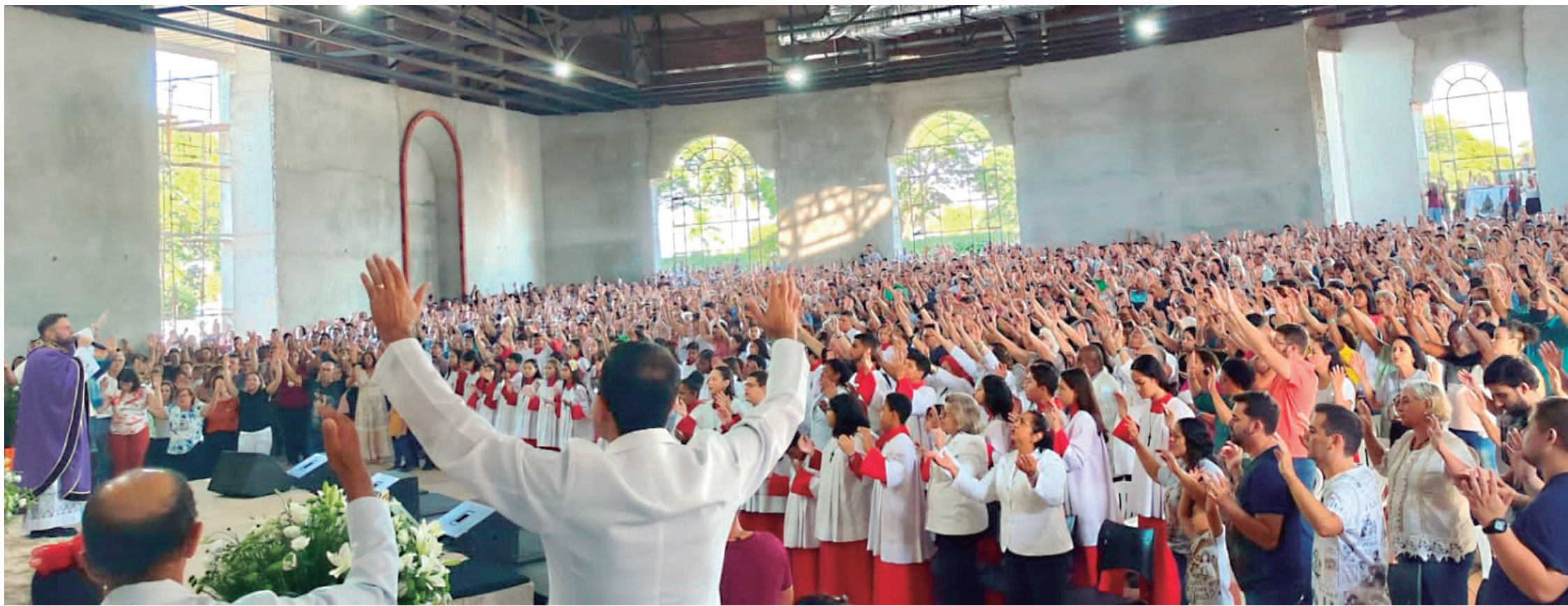
Na missa que marcou o início do Santuário de São José, milhares de fiéis estiveram na celebração em Alto Piquiri