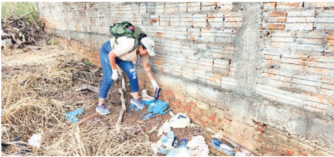
O último levantamento de índice rápido para infestação pelo Aedes aegypti (Liraa), no início de março, revelou a presença de larvas em 3,4% dos imóveis visitados

Outros do relatório mostram que 422 pontos considerados estratégicos para o combate ao mosquito também receberam a visita dos agentes, que além de eliminarem prováveis criadouros realizam aplicação de inseticida em mais de