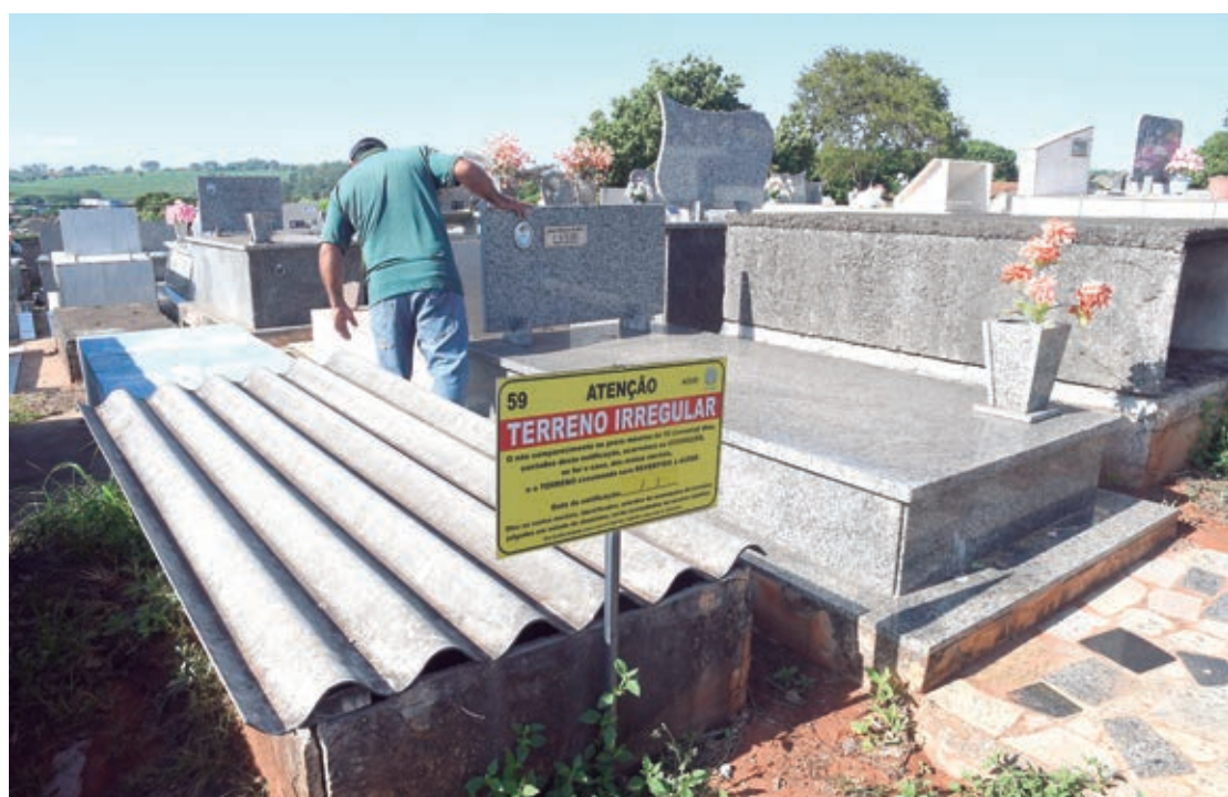
Com essas, já passa de 50 o total de terrenos revertidos para o município, que poderão ser concedidos a outros interessados

"A lei concede um prazo legal de 90 dias para a devida regularização a partir da publicação do edital de