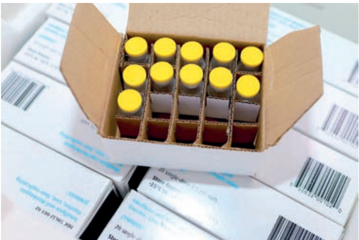
A Mpox é uma doença viral e a transmissão entre humanos ocorre principalmente por meio de contato com lesões de pele de pessoas infectadas

O Governo do Paraná fará a distribuição de vacinas contra a Mpox às Regionais de Saúde na terça-feira (21), o que dará início ao processo de vacinação. O Estado recebeu 981 doses do Ministério da Saúde, que serão destinadas ao público-alvo elencado pelo governo federal, que consiste em pessoas vivendo com HIV/aids (PVHA): homens cisgêneros (que se identificam como homens), travestis e mulheres transexuais que tenham idade igual ou superior a 18 anos e status imunológico identificado pela contagem de linfócitos T CD4 inferior a 200 células nos últimos seis meses.