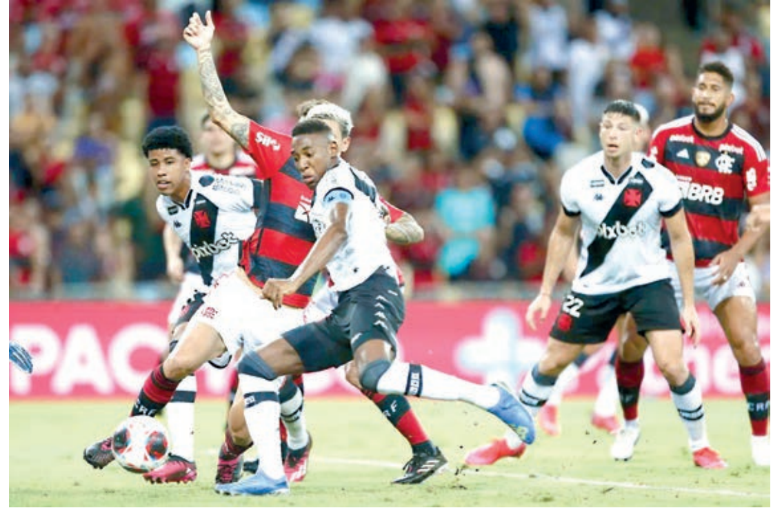
Vasco e Flamengo farão mais um 'Clássico dos Milhões', o terceiro da temporada, desta vez pelo segundo jogo das semifinais do Campeonato Carioca

Barbieri lamentou o desgaste físico e pediu para o time esquecer a eliminação e focar no clássico. "Estamos vindo de uma sequência de decisões e isso contribui para o desgaste. O mais importante é como vamos reagir. Não podemos fazer mais nada sobre o que aconteceu na Copa do Brasil. Assim como no primeiro jogo contra o Flamengo, a ideia é equilibrar e dar menos oportunidades para eles. Agora é virar a chave, a temporada é