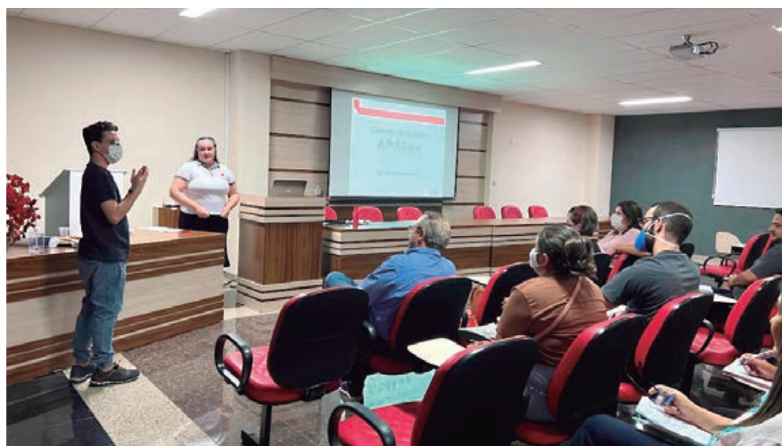
O curso possui carga horária de 60 horas e é ministrado todas as terças e quartas-feiras das 19h às 23h e sábados das 8h às 12h, no auditório da Uopecan de Umuarama

Para se inscrever, os profissionais interessados devem acessar o link e preencher o formulário https://bitly.com/projetolibrasuopecan . Para