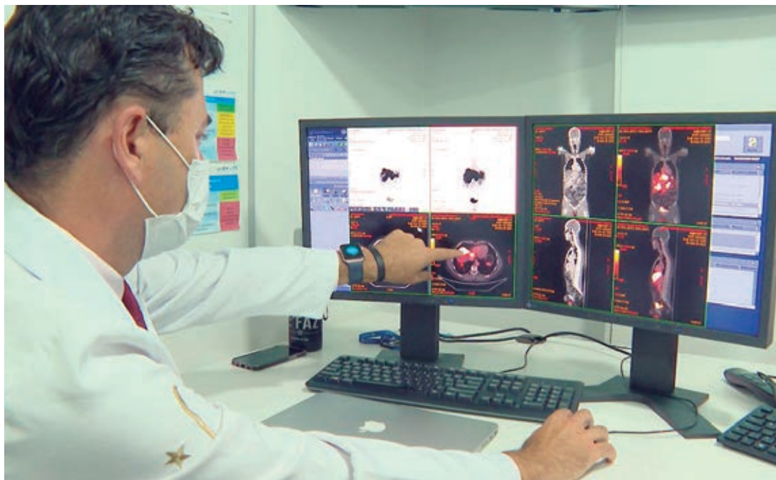
A orientação é que, a partir dos 45 anos, todos devem procurar um médico para avaliar a saúde do intestino

O Instituto Nacional do Câncer (Inca) projeta em 45.630 o número de novos casos de câncer de intestino no Brasil para o triênio