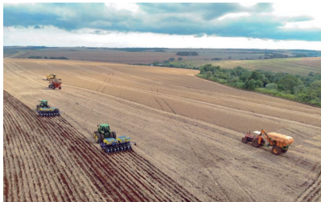
Caso a produtividade continue no patamar atual, espera-se uma safra recorde para o Estado, superando os 20,8 milhões de toneladas obtidos em 2020

Apesar do fluxo em meia pista em dois pontos da BR-277, no Litoral, o Porto de Paranaguá segue operando normalmente. Nas últimas 24 horas, foram recebidos 1.093 caminhões no pátio público de triagem. Ao longo desta semana, de segunda (13) a quarta (15), 3.778 veículos acessaram o local