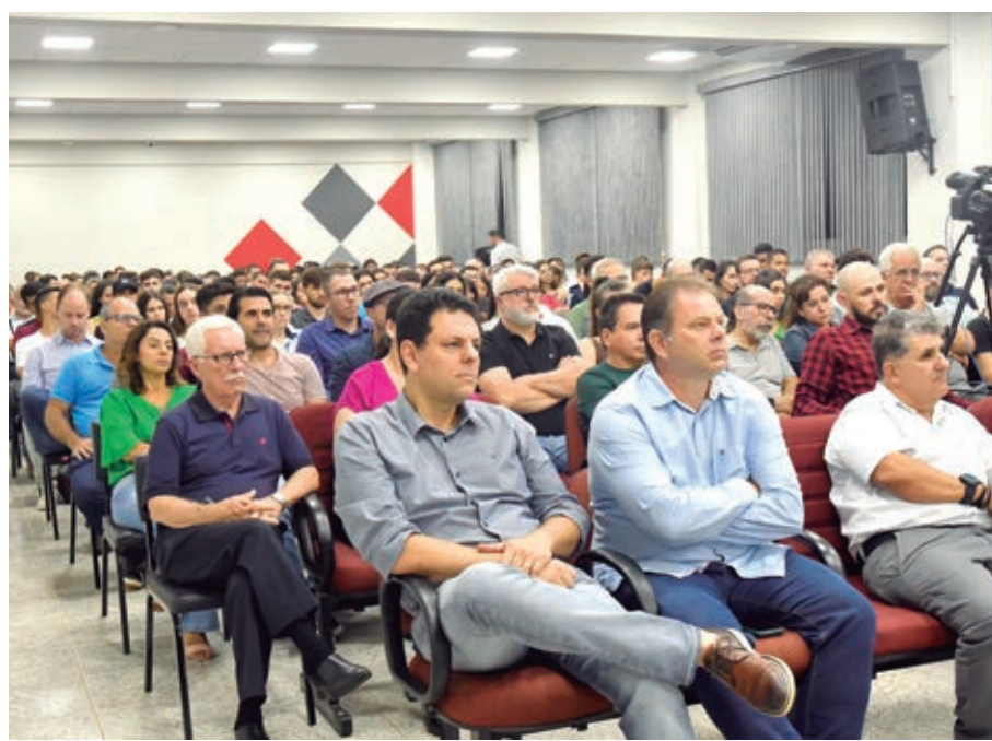
Empresários e lideranças políticas participaram do evento ocorrido no Campus III da Unipar nesta quinta-feira