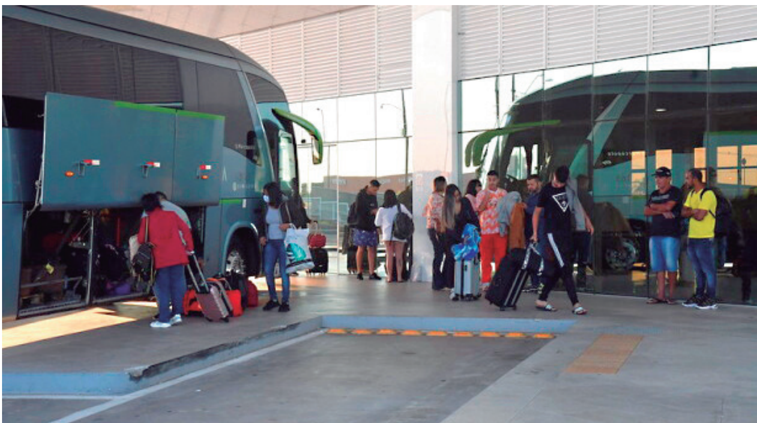
Localizada no alto da avenida Paraná, em uma região nobre e das mais valorizadas da cidade, a rodoviária possui banheiros em mármore, com acessibilidade, e dois jardins internos vazados com o piso superior

Localizada no alto da avenida Paraná, em uma região nobre e das mais valorizadas da cidade, a rodoviária possui banheiros em mármore, com acessibilidade, e dois jardins internos vazados com o piso superior. "O segundo piso pode ser acessado por escadas rolantes e fixas, além de elevadores, que ficam abaixo das escadas. Também já adquirimos os carrinhos para carregar bagagem, o que facilita a vida dos passageiros", observa Graciely Santos, gerente do local.