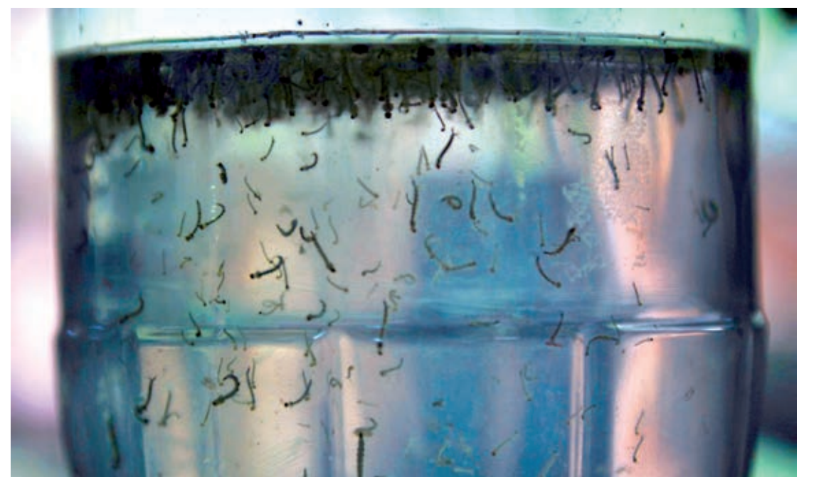
COE irá focar, principalmente, nos registros de dengue e chikungunya, fornecendo orientações para ações de vigilância em conjunto com estados e municípios.

De janeiro ao início de março, foram notificados 301,8 mil casos suspeitos de dengue, contra 209,9 mil casos no mesmo período