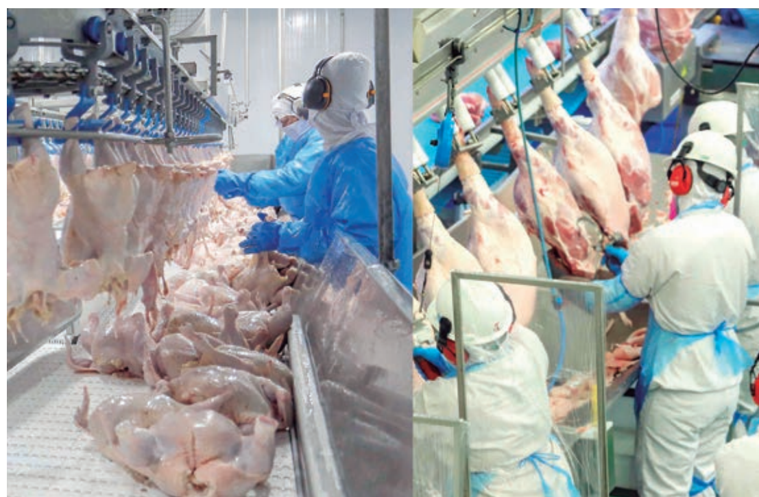
Estado registrou aumento expressivo no abate de frangos, segmento em que é líder disparado entre os estados, além de ocupar a vice-liderança na produção de carne suína

“Temos as maiores plantas da América Latina para o abate de porcos e a chancela internacional de qualidade, por isso essa viagem é tão importante para ampliarmos o mer-