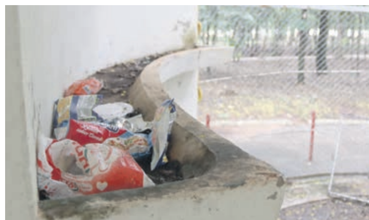
Até uma cozinha improvisada foi instalada no antigo borboletário do bosque

No bosque do Índio (bosque dos Xetá) mesmo com a implantação de uma grade ao longo da pista de caminhada, com o objetivo de separar a pista da mata fechada, situações foram registradas pela Polícia Militar e Guarda