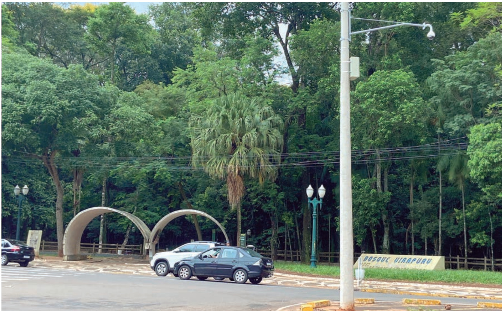
O Bosque Uirapuru é um dos destinos preferidos de pais e filhos nos fins de semana, mas atualmente local provoca receio

Recentes mortes e incidentes ocorridos em dois dos cartões-postais de Umuarama, os bosques do Índio e Uirapuru, levou frequentadores e famílias a mudarem hábitos e a olhar os locais com receio e insegurança. Semana passada o Jornal Umuarama Ilustrado esteve nos dois locais, conversou com populares e encontrou no antigo borboletário do Uirapuru resto de alimentos, colchões e principalmente vestígios de uso de drogas, como papetes de cocaína e garrafas de bebidas alcoólicas. A quantidade de preservativos espalhados pelo local, que está há 200 metros do parque das crianças chamou a atenção. A administração municipal informou que está ampliando o monitoramento das vias públicas e por meio de câmeras, sendo duas apontadas para os bosques, no sentido de promover mais segurança para quem utiliza os locais. Página A3