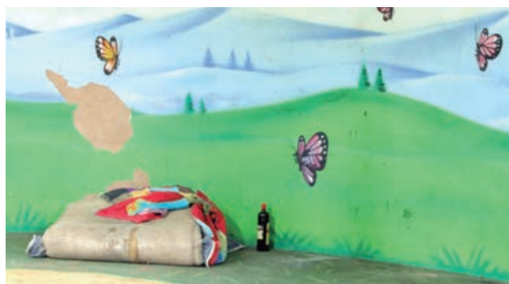
Pessoas em situação estão vivendo nas estruturas dentro do bosque. Segundo entrevistados, nos fins de semana o número aumenta

O mês de fevereiro foi assombrado para o bosque Uirapuru, quando a Polícia Civil de Umuarama encontrou três corpos enterrados no local, também próximo ao