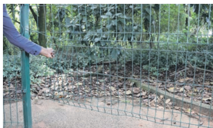
Usuários de drogas no bosque do Índio entram na mata pelos vários pontos danificados na grade de proteção

Municipal. No início do mês uma mulher foi abordada por um homem desconhecido, que tentou arrastá-la para a mata do bosque. Porém o homem não conseguiu levar a vítima e posteriormente agrediu a mulher e fugiu levando a bicicleta dela.