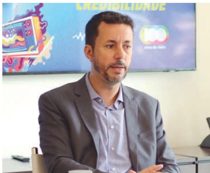
O secretário de Estado de Comunicação, Cleber Mata, participa de encontro com empresários em Umuarama

que essa aproximação é importante para se mostrar o que o Estado tem de bom, no turismo e no agronegócio.