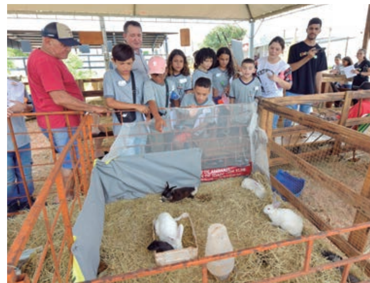
Nesta semana, a Expo Umuarama 2023 também faz parte da rotina escolar da Rede Municipal de Ensino

Umuarama - Nesta semana, a Expo Umuarama 2023 também faz parte da rotina escolar da Rede Municipal de Ensino. Entre segunda e quarta-feira, mais de 1 mil alunos de 22 estabelecimentos de ensino da cidade e dos distritos estão visitando o Parque de Exposições Dario Pimenta da Nóbrega durante o dia, para conhecer algumas das atrações e participar de oficinas educativas realizadas com parceiros do município.