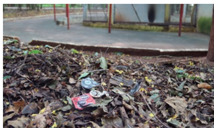
O que chamou atenção foi a quantidade de preservativos espalhados pelo local

parque das crianças. “Parei de correr dentro do bosque. Todo mundo está falando que o clima lá dentro tá pesado. Muitas famílias frequentam o local, mas a quantidade de pessoas bebendo pinga e usando droga lá está aumentando as famílias”, disse