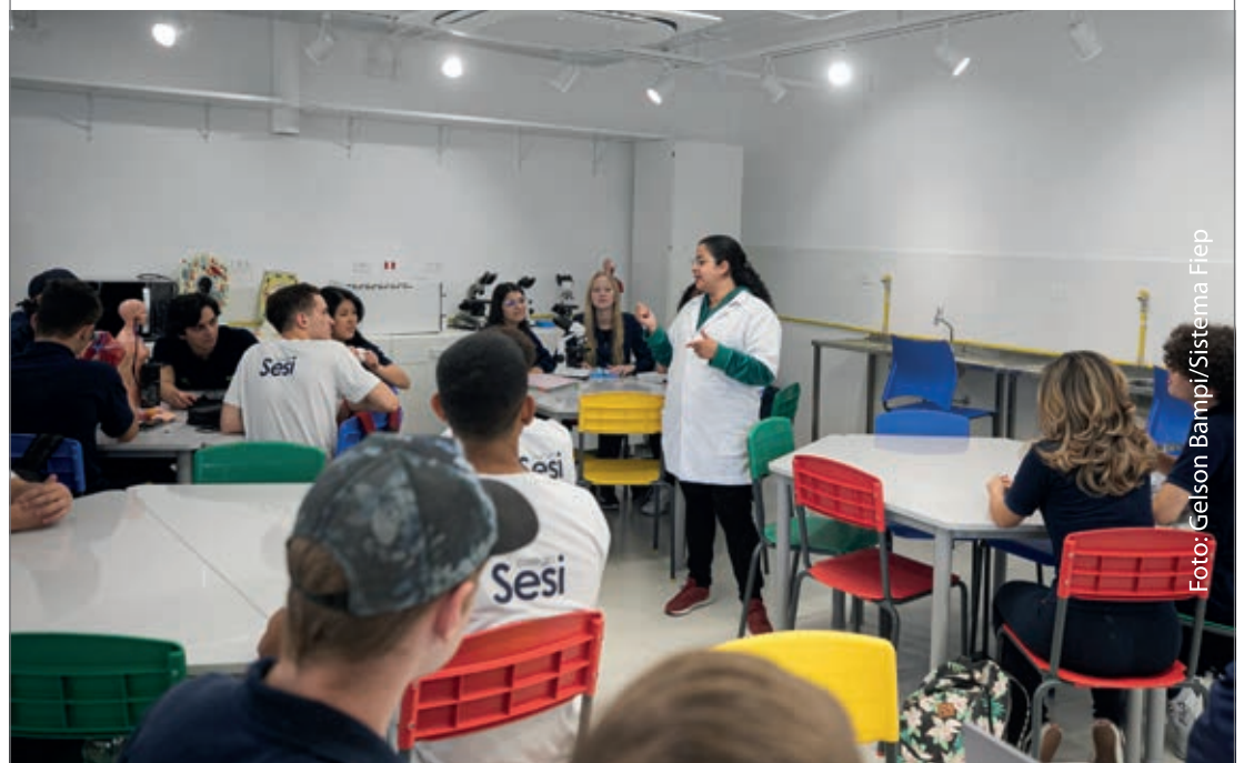
Escola tem espaços estruturados específicos para cada área do conhecimento

A inauguração da Escola Sesi de Referência Internacional de Londrina faz parte da programação do Mês da Indústria, que o Sistema Fiep promove em maio em comemoração pelo Dia Nacional da Indústria, celebrado no dia 25. A programação serve para destacar uma série de entregas de valor para o setor industrial que estão sendo realizadas em diversas regiões do Paraná.