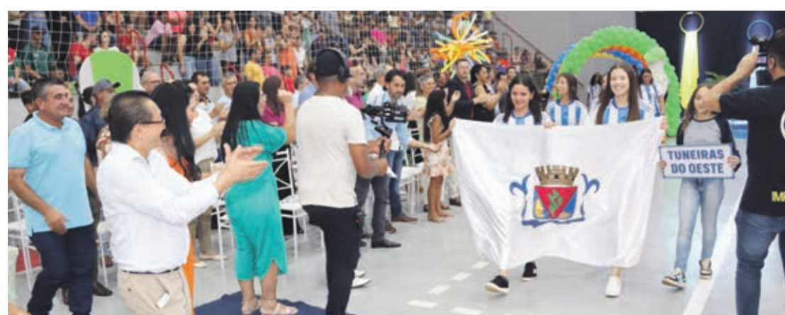
Delegação de Tuneiras do Oeste ao entrar no ginásio de esportes