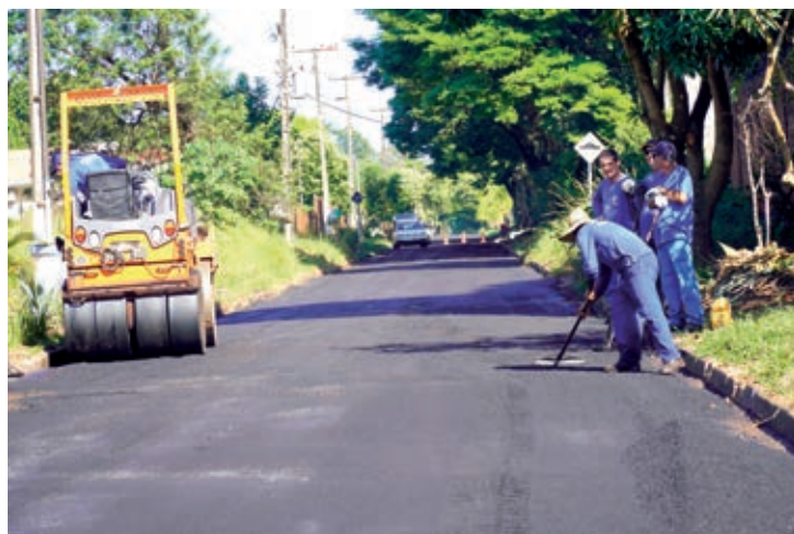
O serviço de micropavimentação para recuperação do pavimento asfáltico executado pela Prefeitura de Umuarama está avançando na região do Jardim São Cristóvão