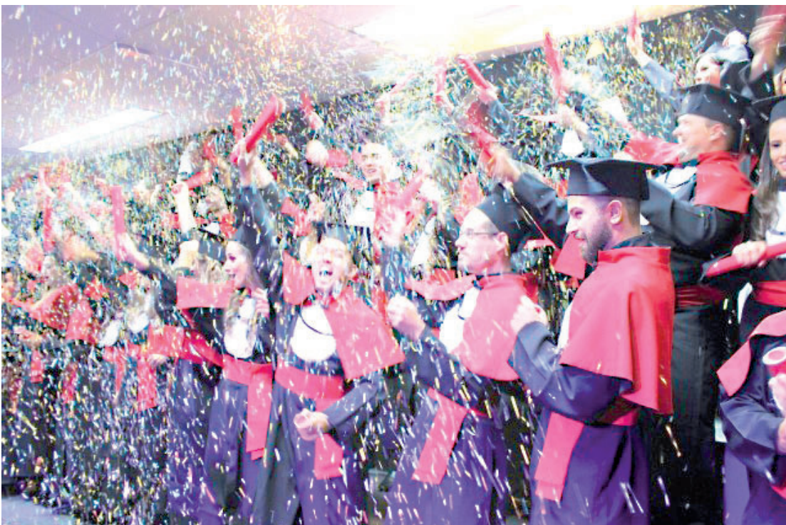
As microrregiões de Londrina, Ponta Grossa, Umuarama, Cornélio Procópio e Faxinal foram as regiões que mais perderam profissionais