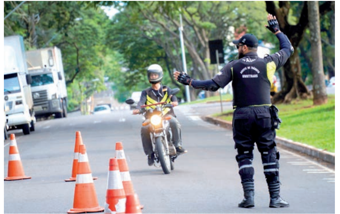
Apesar das orientações, motoristas ainda insistem em infrações que podem ser evitadas