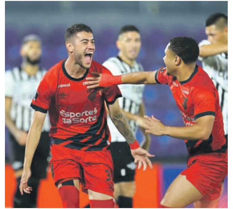
Furacão tenta manter a bosa fase diante do Flamengo