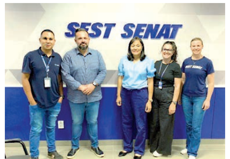
O Projeto Vida em Movimento, idealizado pelo Sest Senat, será colocado em prática em Umuarama

Aos profissionais de saúde, a prática é dividida entre cinco momentos: antes de tocar o paciente; antes de realizar procedimento limpo/asséptico; após o risco de exposição a fluidos corporais; após tocar o paciente e após tocar superfícies próximas ao paciente.