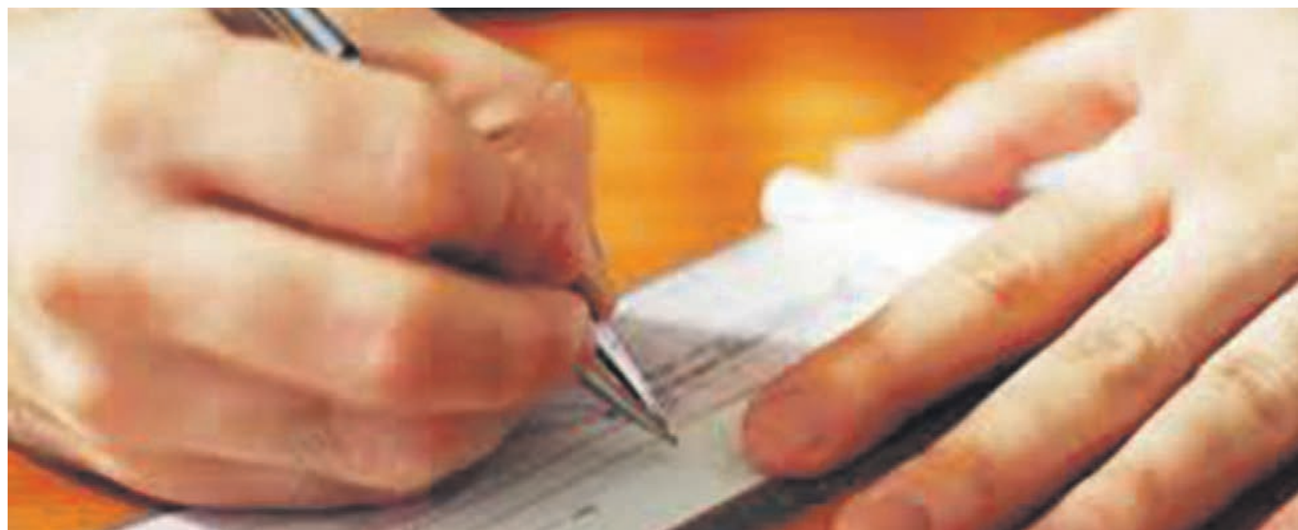
O Banco Central informou mudanças no padrão do cheque para modernizar e aumentar a segurança do meio de pagamento (imagem ilustrativa)

Guimarães ressaltou que as eventuais modificações decorrentes da autorregulação do padrão do cheque não devem alterar significativamente a cartela do cheque à disposição dos correntistas de bancos atualmente. “Até