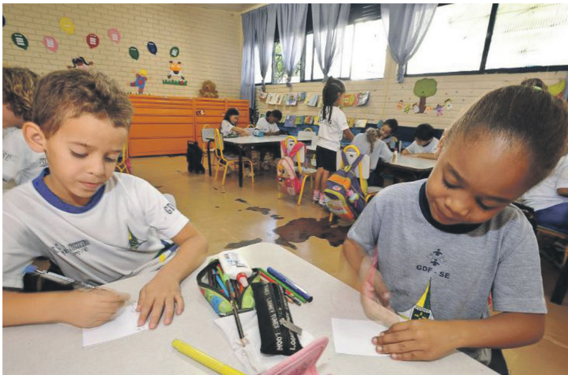
O tema será debatido no 4º Congresso Internacional Um Novo Tempo na Educação, que será realizado em Curitiba, de 31 de maio a 2 de junho

A pesquisa qualitativa foi feita, inclusive, para subsidiar os palestrantes do congresso. “Os dados vão contribuir para que os grandes educadores possam fazer uma análise, principalmente de alguns