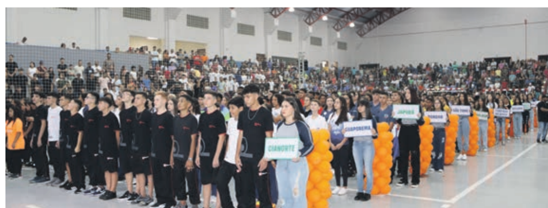
Mais de mil atletas de 12 cidades participam dos jogos