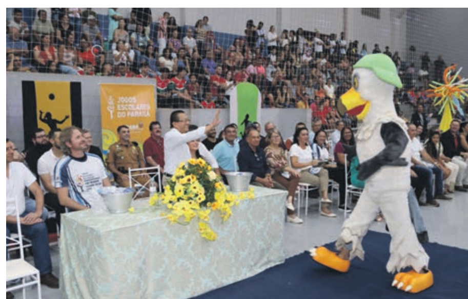
Mascote do Parque das Perobas, Gavião Pato animou o público