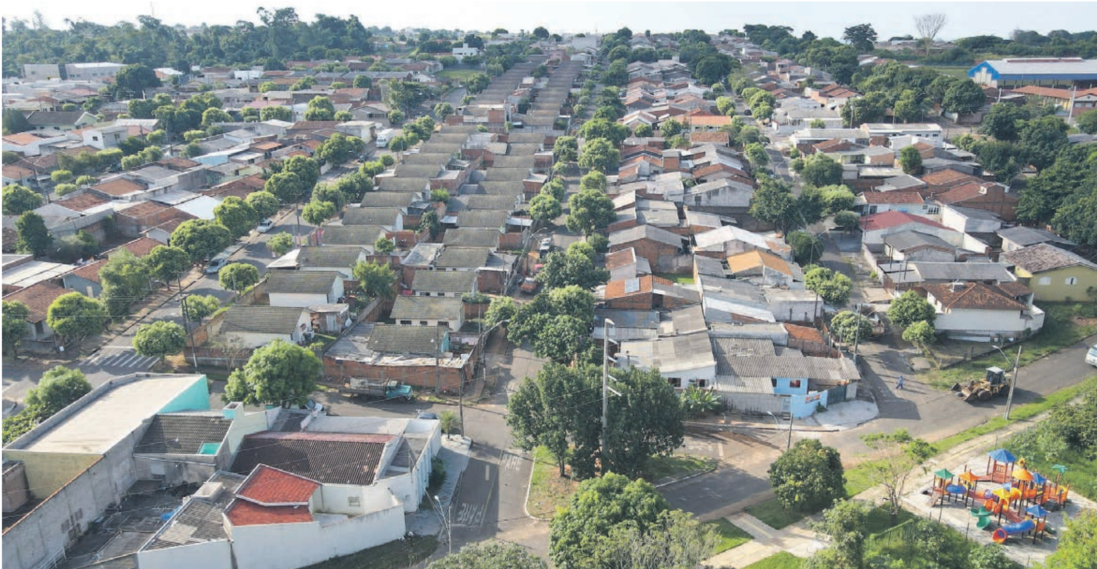
Vários bairros terão a documentação acertada em Umuarama