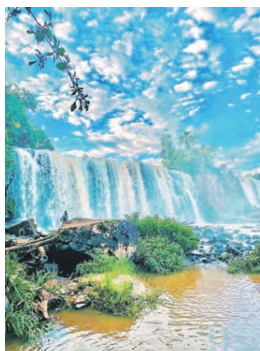
A imponência do Salto Paiquerê que recebe turistas, mas poderá ganhar melhor estrutura em breve