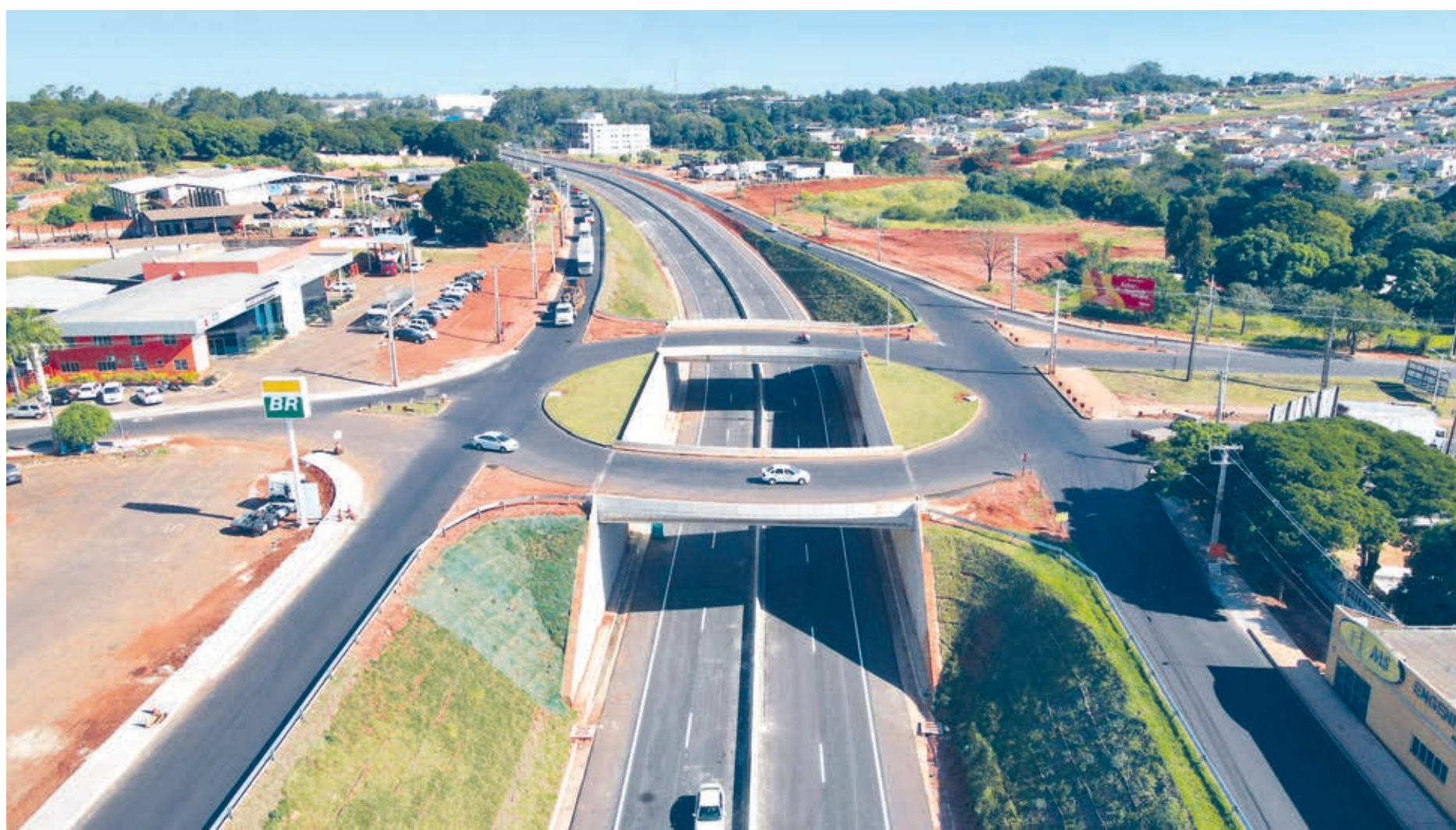
O trecho duplicado da PR-323 conta com três novos viadutos, sendo dois no trevo Gauchão e um no trevo para Mariluz, todos já concluídos

Atualmente, o tráfego está sendo desviado pelas vias marginais, com acesso a Umuarama já sendo feito pelos viadutos, enquanto a passagem pela pista principal permanece