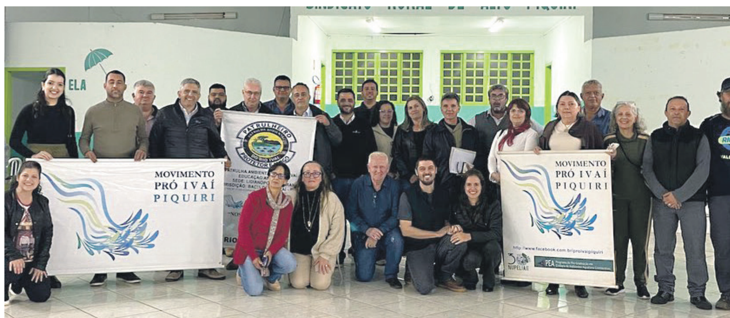
Lideranças reunidas em Alto Piquiri para debater o processo de tombamento