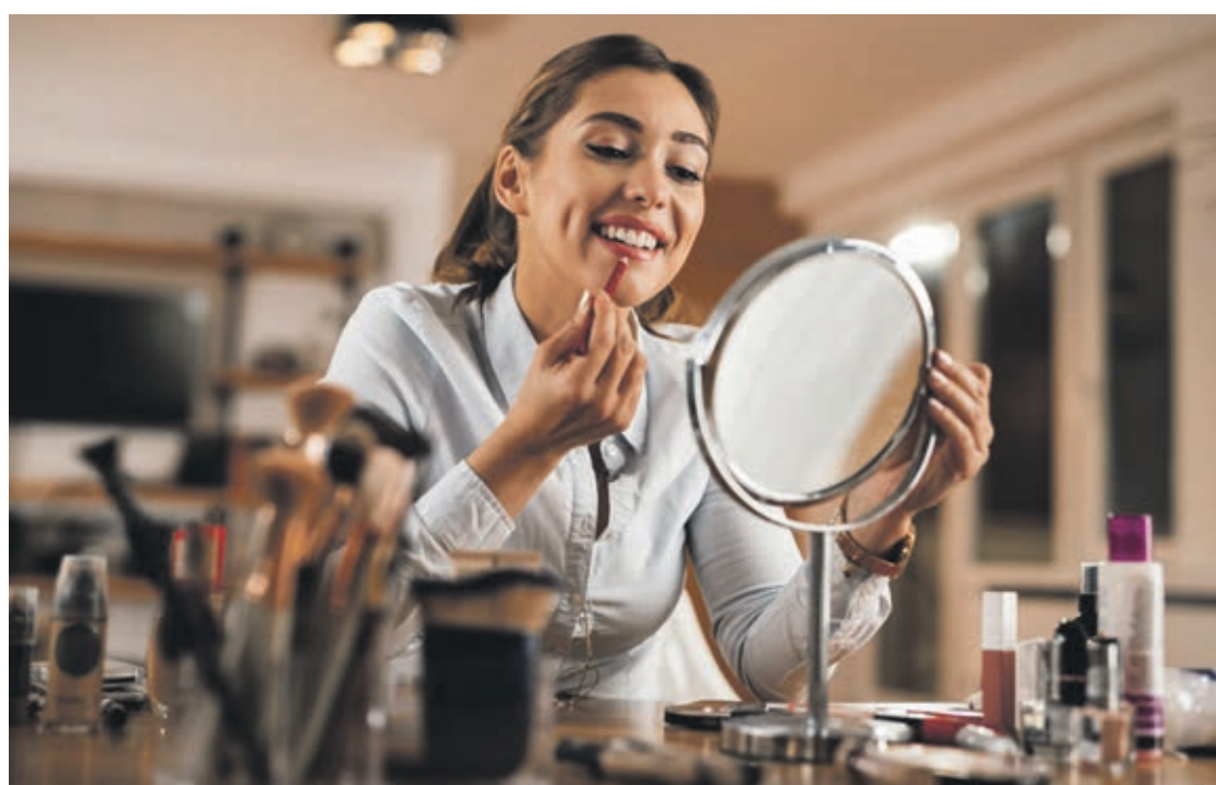
Inclua alimentos naturais em sua rotina de refeições

Sem dúvida, é preciso querer, como tudo nesta vida. Se quisermos sucesso em alguma coisa, temos que perseverar.