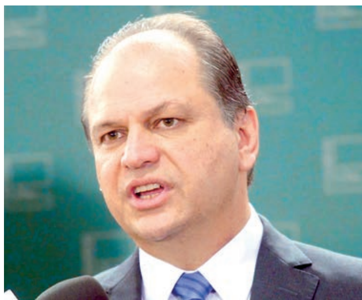
Ricardo Barros diz que foi feito justiça no caso

Também foi utilizado material que constava em uma ação de improbidade administrativa contra o deputado da época em que ele atuou como ministro da Saúde — este caso tem relação com supostas irre-