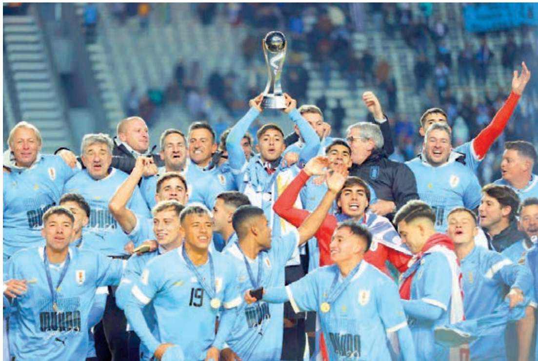
No domingo, o Uruguai ergueu o troféu de campeão do Mundial Sub-20 ao vencer a Itália por 1 a 0, um dos países que investem na base

A conquista do fim de semana também serviu para consolidar a aposta do expe-