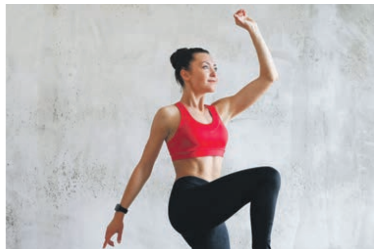
As modalidades de exercício aeróbico ajudam a queimar calorias e fortalecem o sistema respiratório.

A bicicleta é uma maneira de manter a forma e eliminar aquelas gordurinhas que estão incomodando. Pedalar aumenta a resistência física, acelera o fluxo sanguíneo e trabalha os músculos das nádegas e pernas. A bicicleta também é ótima para corrigir a postura e ajuda a adquirir o hábito de fazer exercícios todos os dias. Para quem vai começar, é aconselhável fazer de 15 a 20 minutos seguidos, por dia e, aos pouquinhos, ir aumentando esse tempo. Isso vale para os ciclistas das bikes e das bicicletas ergométricas.