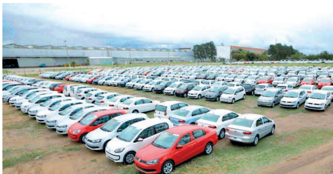
Carros populares já podem ser encontrados com descontos

Originalmente, o programa havia sido desenhado apenas para os automóveis de passeio, que ficariam com a totalidade de R$ 1,5 bilhão em créditos tributários. Nos últimos dias, antes do anúncio, porém, houve a inclusão de caminhões e ônibus. Em