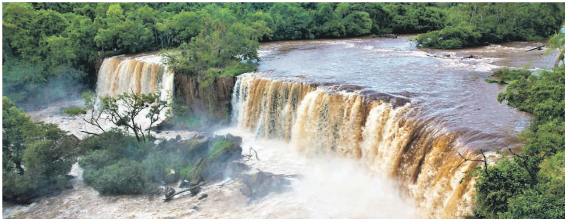
Salto Paiquerê visto do alto mostra a sua exuberância e o tombamento deve preservá-lo para as futuras gerações

Uma das esperanças com o possível tombamento do Paiquerê é superar a pressão que tem ocorrido visando a construção de Pequenas Centrais Hidrelétricas (PCHs) na região entre o Paiquerê o Apertado no rio Piquiri, o que poderia resultar no alagamento dessas belezas naturais, pois cerca de 8 quilômetros abaixo do Salto, após a confluência do rio Goioerê com o rio Piquiri, encontra-se um conjunto de corredeiras e canyon denominado Apertados do Piquiri, com contexto geológico similar. A região já está incluída no Programa de Regionalização do Turismo, integrando a Região Corredores das Águas. E tem atraído bom número de visitantes, principalmente no período de calor. E já foi palco de eventos náuticos,