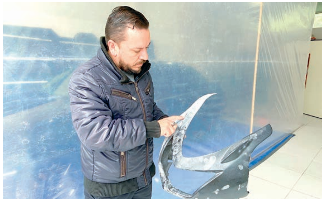
A Restaurações, localizada na rua Marialva 6153, em Umuarama, oferece serviços de funilaria em geral para veículos