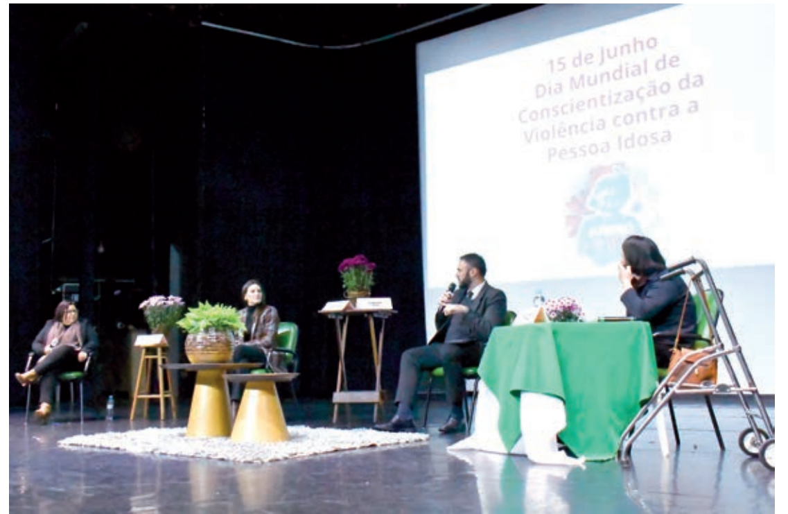
O evento serviu de alerta para o aumento nos registros de violência contra pessoas da terceira idade