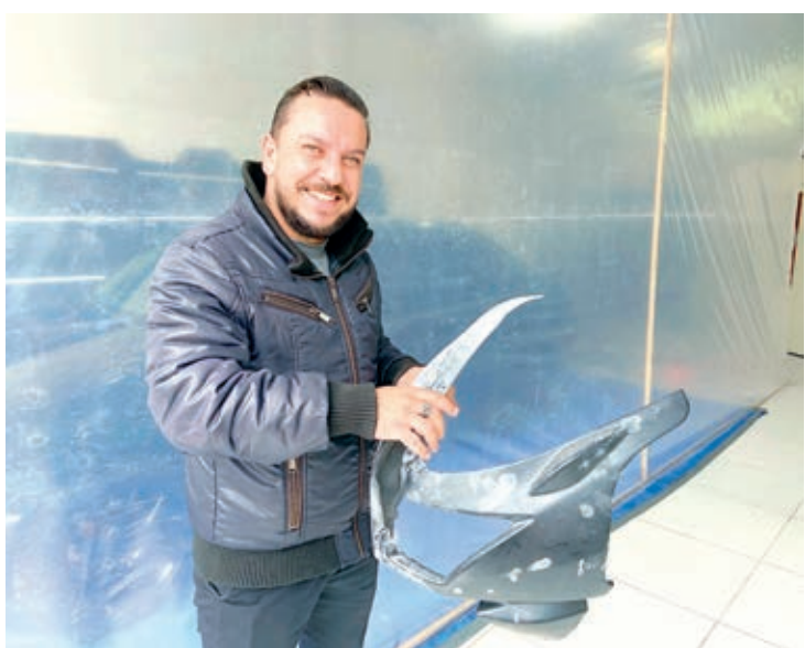
Para quem busca serviços de restauração de motos e carros antigos ou precisa realizar reparos de funilaria em seu veículo, a Restaurações é uma opção confiável