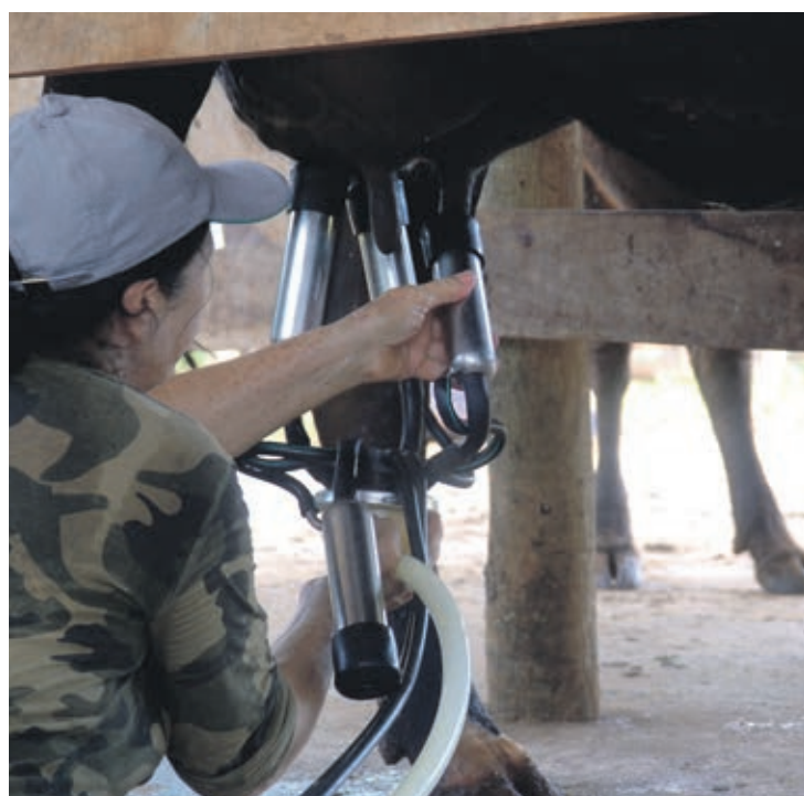
A produção leiteira é a principal atividade em centenas de pequenas propriedades rurais de Umuarama, que no ano passado produziram 19,7 milhões de litros

Membro da comissão técnica do Conseleite/PR, um conselho que reúne representantes de produtores e das indústrias de laticínios que processam a matéria-prima (leite), Tamaio avalia que o cená-