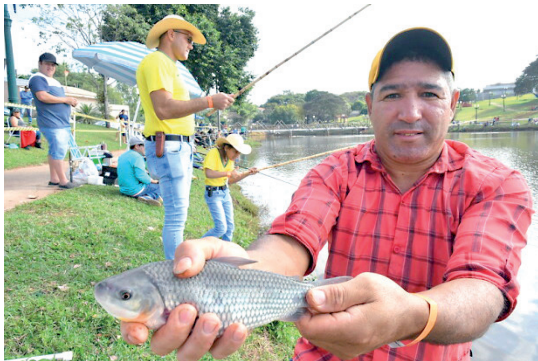
Os visitantes estavam liberados para pescar tanto espécies exóticas, como as tilápias, quanto as nativas, como curimbas, piaus e lambaris, sempre aos sábados e domingos