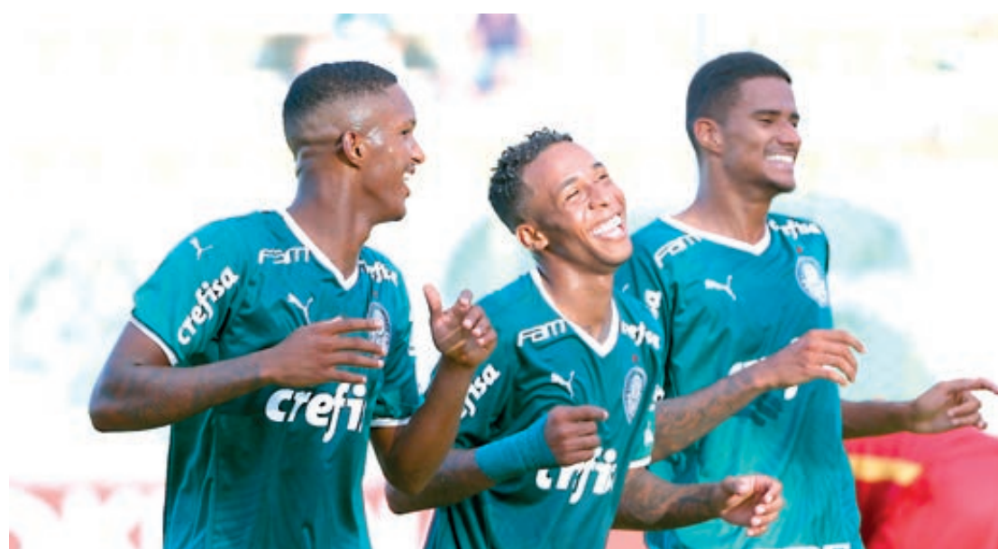
Palmeiras tenta o bi e chega embalado para a conquista