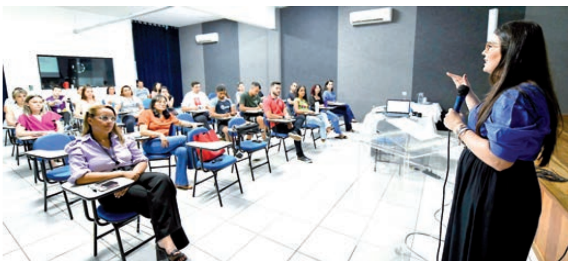
Servidores receberam treinamento em Umuarama

Umuarama - Servidores dos centros de referência da Assistência Social (Cras), de referência especializada (Creas), Centro Pop, Serviço de Convivência e Fortalecimento de Vínculos do Idoso (SCFVI) e do Centro da Juventude (Ceju) receberam um treinamento sobre a abordagem e o tratamento com pessoas acometidas pelo Transtorno de Espectro Autista (TEA) na tarde desta terça-feira, 24. Foi mais uma etapa da iniciativa 'Capacita Ceju' destinada às equipes que executam as políticas de assistência social do município.