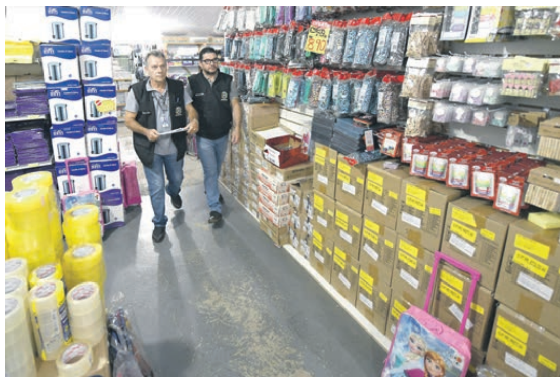
Fiscais do Procon estiveram em visita às livrarias e papelarias na cidade

O secretário do Procon Umuarama esclarece que a lista de materiais escolares é fornecida pela escola indicando apenas os itens que o aluno vai usar individualmente - e nunca com produtos de uso coletivo. "Até há alguns anos era comum vermos as escolas pedindo itens como produtos de limpeza, papel higiênico, sabonete, copos descartáveis, carimbo, álcool, algodão, entre outros. Contudo, essa prática tornou-se irregular, e esses materiais devem ser fornecidos pela escola e não pelos alunos", alerta.