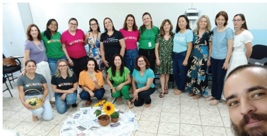
Equipe da Educação de Umuarama preparando a volta às aulas

Durante reunião nesta segunda-feira, 23, foram acertados os detalhes finais do cronograma de atividades de preparação, treinamentos e organização da volta às aulas, com ações programadas entre os dias 27 de janeiro e 9 de fevereiro. Neste período haverá assessoria online de Gestão Escolar à direção e coordenação pedagógica das escolas, bem como dos centros municipais de