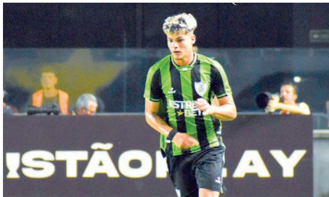
Equipe do América MG fez excelente campanha na Copinha

Os ingressos para a decisão da Copinha podem ser comprados através do site da Federação Paulista de Futebol (ingressospf@soudaliga.com.br). As entradas para a arquibancada custam R$ 50 (R$ 25 a meia) e os bilhetes para a numerada coberta podem ser adquiridas por R$ 120 (R$ 60 a meia).