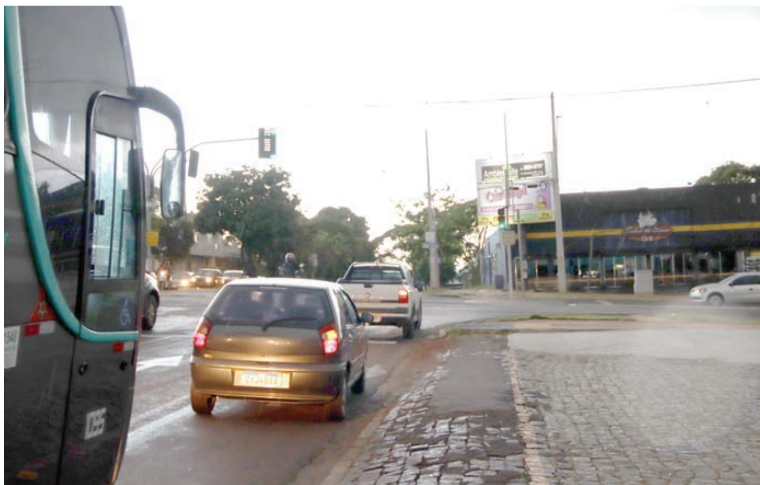
Fazer a conversão à direita com o farol fechado, desde que exista uma sinalização no local que permita a manobra, agora é permitido

O condutor que esteja com a CNH em processo