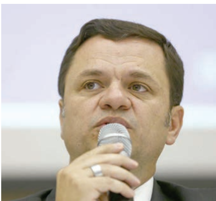
O ex-ministro da Justiça, Anderson Torres, foi preso ao chegar no Brasil