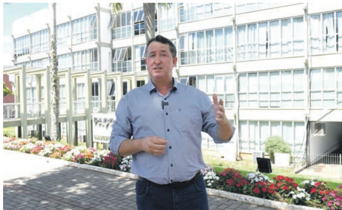
Hermes Pimentel, prefeito de Umuarama: “Com novo horário de atendimento, Prefeitura não fechará mais para almoço de segunda a sexta-feira”

O prefeito Hermes Pimentel reforçou que adaptações, como esta proposta, são sempre realizadas como forma de melhorar o atendimento ao cidadão. “Sabemos que muita gente, que trabalha no comércio, nas indústrias ou em serviços, só tem o horário de almoço para correr atrás de certos documentos, de ver questões de IPTU, de terrenos, se solicitação de serviços públicos, por exemplo, desta forma, com o novo horário, acreditamos que estaremos facilitando a vida dos umuaramenses”, pontuou.