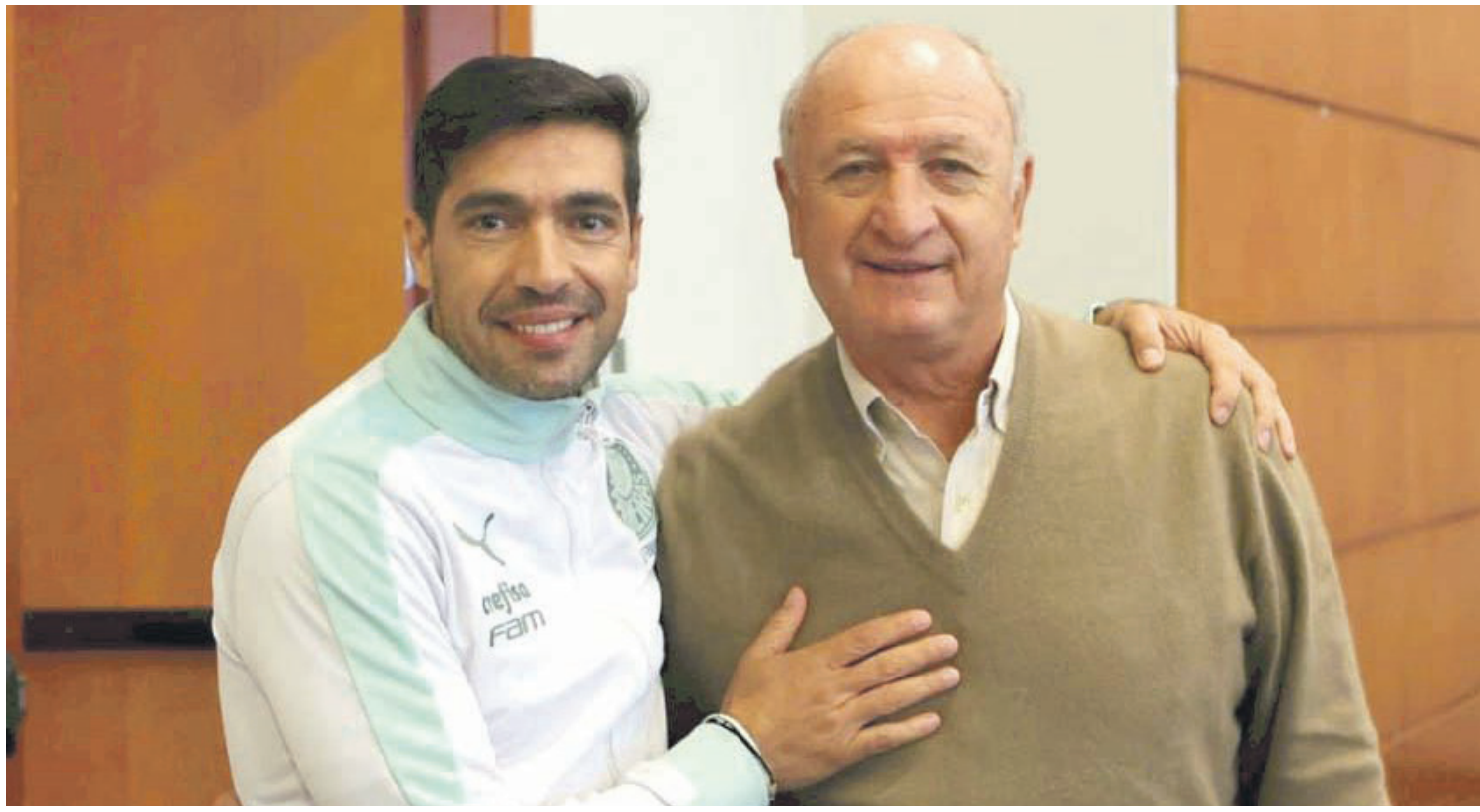
Luiz Felipe Scolari, o Felipão, gostaria de ver Abel Ferreira, do Palmeiras, no comando da seleção brasileira

"Se houver essa possibilidade, ficaria muito feliz em vê-lo na seleção brasileira. Só nós brasileiros somos bons para o Brasil? Não, não temos que ficar preservando cargos. Eu não gosto disso", afirmou Felipão. "Quero colocar a minha opinião para que todos saibam. Nós (treinadores) saímos do Brasil tantas vezes e tiramos lugar de tantos,