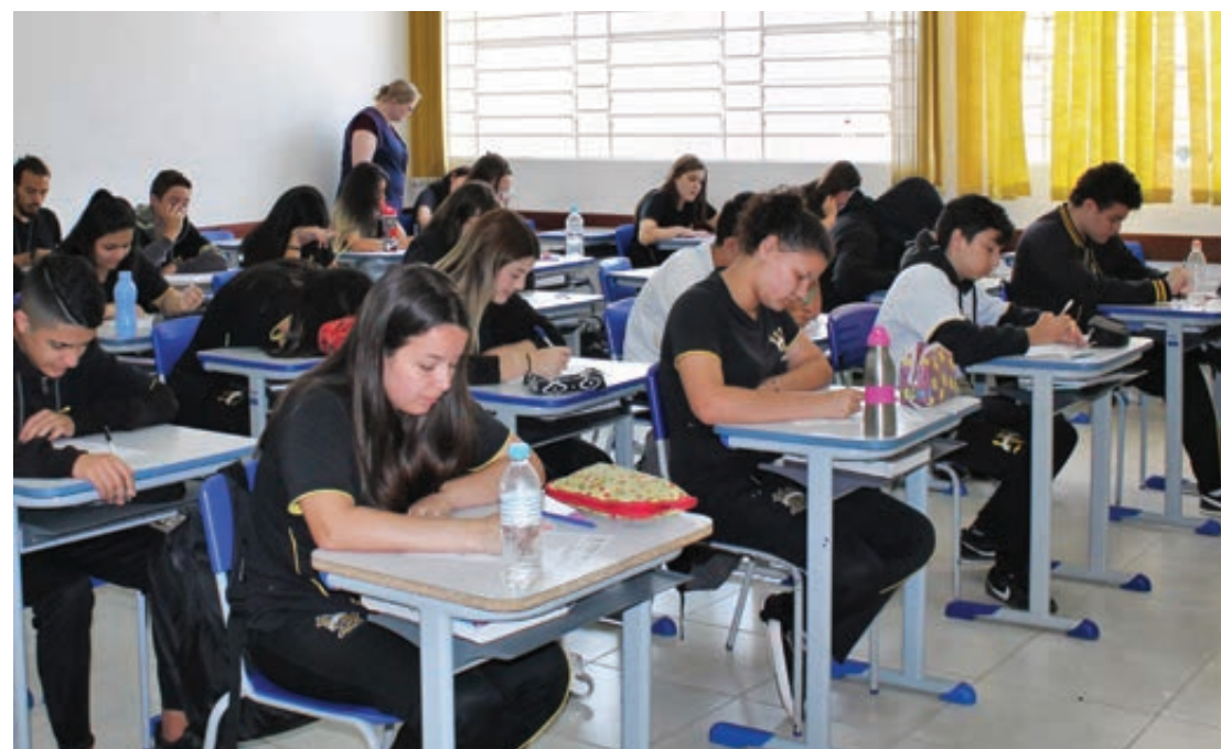
Estudantes que perderam o prazo de matrículas ainda podem ingressar em colégios da rede estadual de ensino neste ano letivo

Para os estudantes que haviam pleiteado uma vaga em escolas de sua preferência, não conseguiram e também não confirmaram a matrícula na instituição de ensino que havia sido indicada pela Secretaria de Estado da Educação (Seed-PR) até 20 de dezembro, é preciso que o responsável entre em contato diretamente com o colégio indicado para verificar a disponibilidade de vaga.