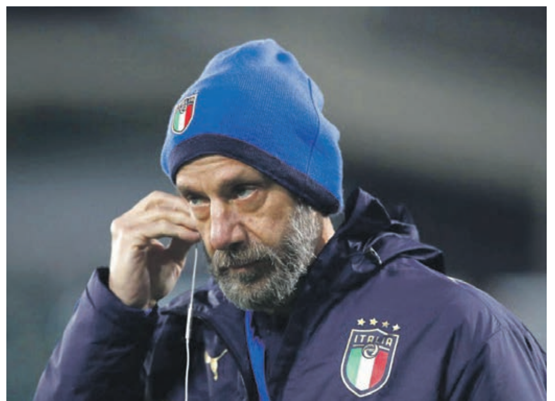
O ex-atacante Gianluca Vialli morreu após uma longa batalha contra um câncer no pâncreas

"Esperava até o fim que ele fosse capaz de realizar outro milagre. No entanto, me sinto confortado pela certeza de que o que ele fez pelo futebol italiano nunca será esquecido". A FIGC confirmou que um minuto de silêncio em memória a Vialli será realizado antes de todos os jogos no país neste fim de semana.