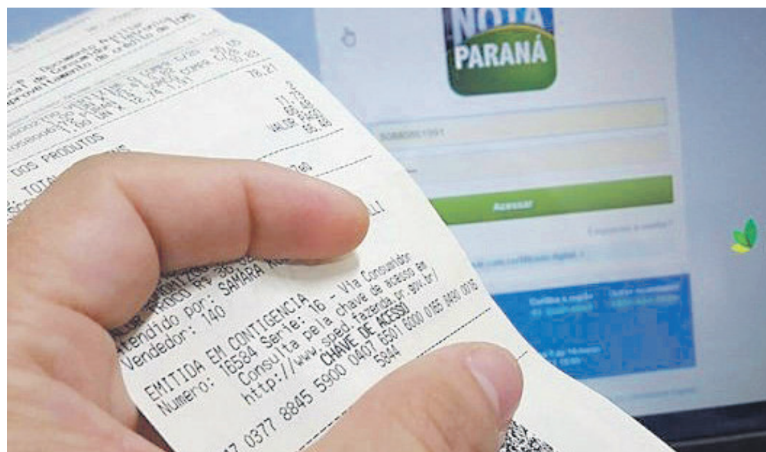
Os contribuintes concorrem a prêmios de R$ 10, R$ 10 mil, R$ 200 mil e R$ 1 milhão

O primeiro sorteio do ano do Nota Paraná, programa vinculado à Secretaria da Fazenda (Sefaz), será nesta segunda-feira (9). É uma nova chance de começar o ano com sete dígitos na conta, depois da Mega da Virada. A transmissão ao vivo acontece a partir das 9h30 pelo Instagram e Facebook.