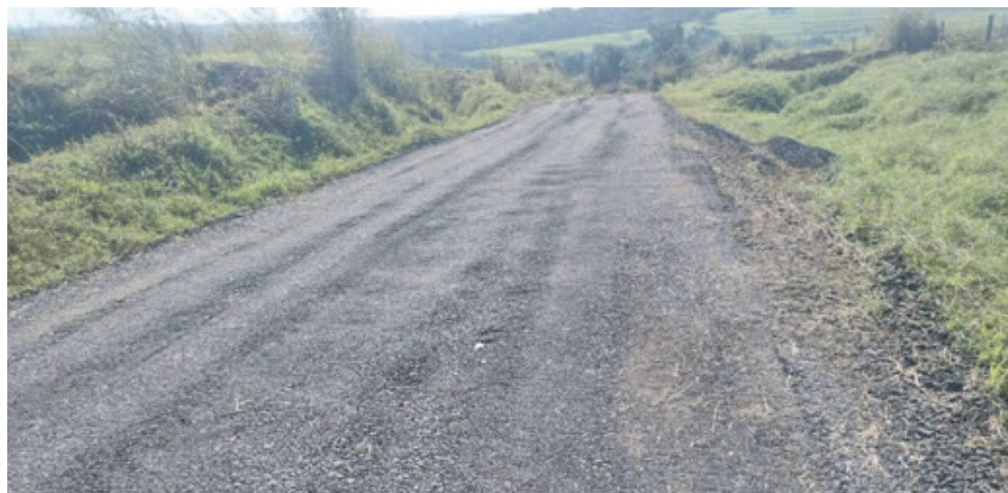
Ao todo, são atendidos os 18,54 quilômetros da rodovia, utilizada para transporte por pequenos produtores agrícolas

O Departamento de Estradas de Rodagem do Paraná (DER/PR) faz serviços de conservação na PR-682, estrada rural não pavimentada entre Serra dos Dourados, distrito de Umuarama, e a PR-482, acesso para Maria Helena, no Noroeste do Estado. Os reparos são executados desde o fim de 2021, e garantidos por contrato até novembro de 2023. O investimento do Governo do Paraná é de R$ 553.467,45.