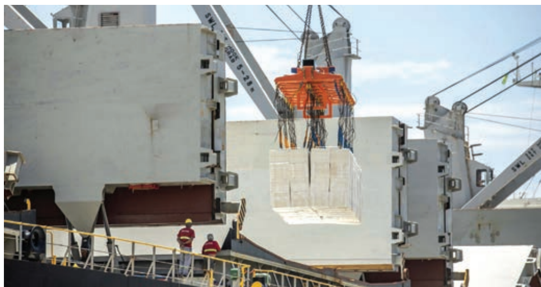
A movimentação portuária no Estado do Paraná atingiu um novo patamar recorde

Segundo ele, se comparada à movimentação de 2019, quando foi iniciado o trabalho desta gestão, o salto é ainda maior: 9,6%. Naquele ano a movimentação atingiu 53.203.775 toneladas de carga. Em 2020