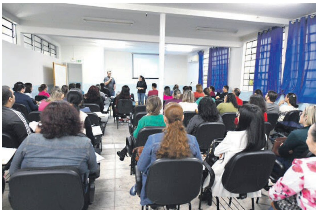
No município existem hoje exatamente 396 professores que serão beneficiados com a medida

No município existem hoje exatamente 396 professores que serão beneficiados com a medida, a maioria aprovada no último concurso público realizado pela administração municipal no final de 2021. “Existem também casos de professores que já estão no magistério há