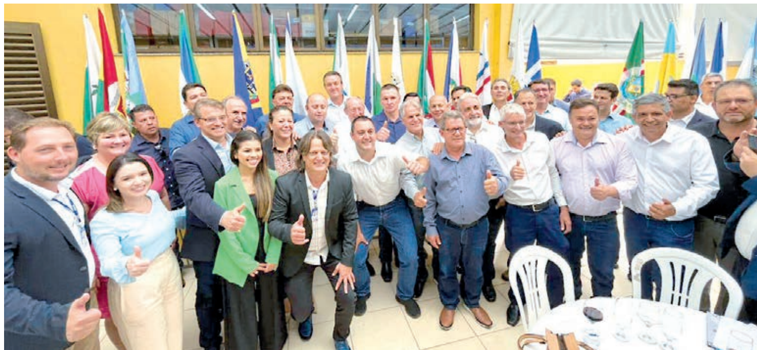
Governador e secretários com prefeitos e outras autoridades