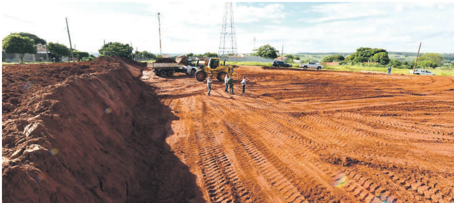
Operários estão no local realizando o trabalho de terraplenagem

Localizado na avenida Malta, entre os bairros Patrimônio Umuarama e Parque Bonfim, a sede da 4ª Companhia do BPFron da Polícia Militar do Paraná será construída com recursos próprios, oriundos de acordos formalizados por meio de TACs (Termos de Ajuste de Conduta) realizados pelo Ministério Público do Trabalho (MPT) no município, conforme relata o capitão. “O processo já está em fase adiantada e o projeto está pronto, seguindo