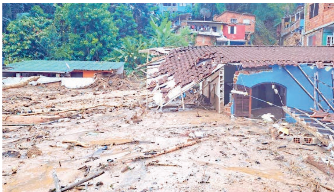
No litoral paulista, a tragédia mais recente matou mais de 50 pessoas

O professor aponta que se trata de um problema social, pois a ocupação de encostas é em parte uma consequência do encarecimento do custo de vida em áreas mais seguras. No caso de São Sebastião, por exemplo, em vários bairros, as áreas planas são limitadas às quadras mais próximas à orla, que se valorizaram com o aumento do turismo