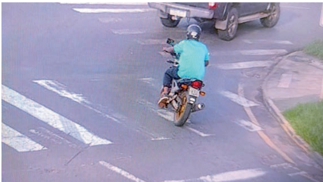
Imagem flagrada no dia 15/02 onde é possível ver Guilherme Alves conduzindo a moto da vítima Fernandes Araújo. Ele usa a mesma camiseta usada no dia em que abastece o carro do médico