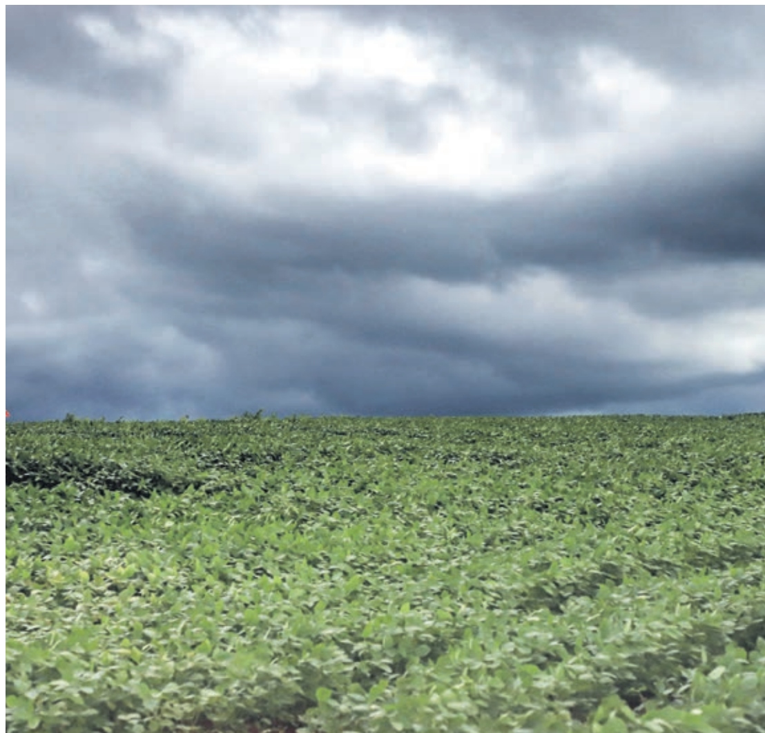
Agricultores esperam uma trégua das chuvas para o sol aparecer e começar a colheita