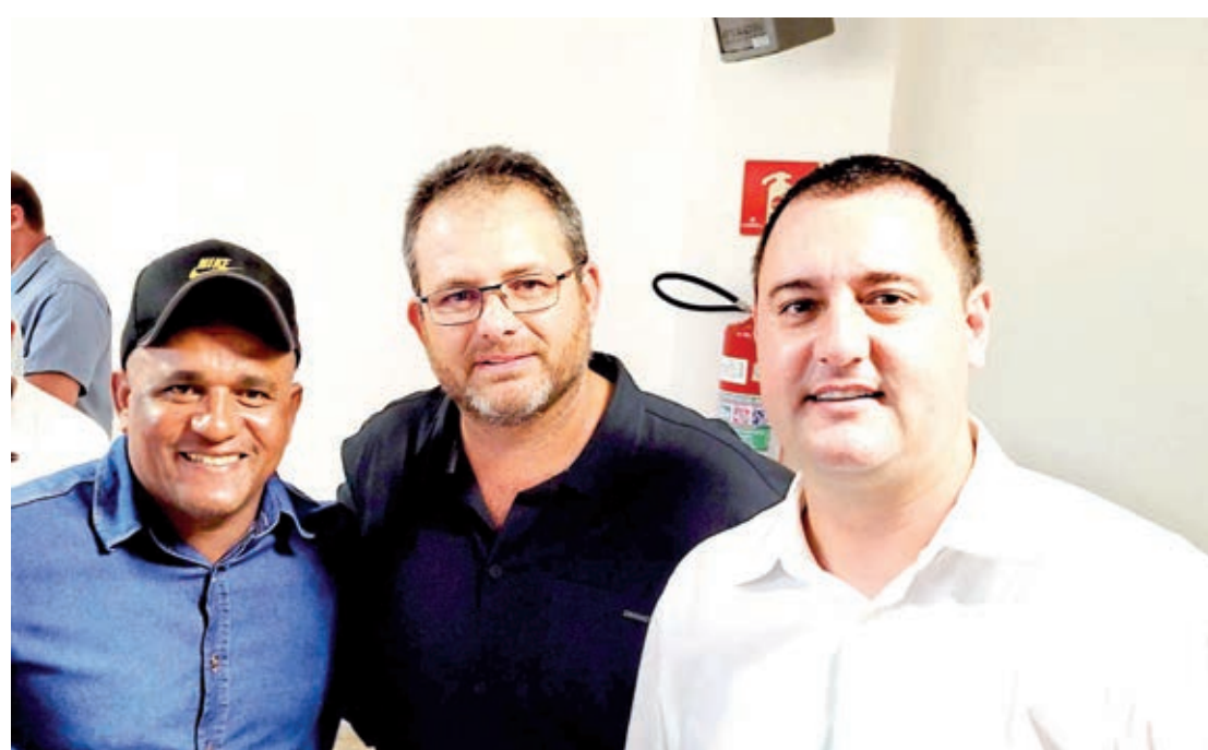
Prefeito Alex e vereador Preto com o governador Ratinho Jr

Pimentel foram referências no discurso do governador Ratinho Junior no sentido de ajudar os prefeitos em seus Municípios. “É sempre uma honra prestigiar nosso governador Ratinho Junior e aproveitar para trocar ideias com os Secretários de Estado, além disso, ainda discutimos sobre recursos para Brasilândia do Sul com nosso deputado federal, Sérgio Souza, que também se fez presente neste evento”, destacou o prefeito Alex Cavalcante.