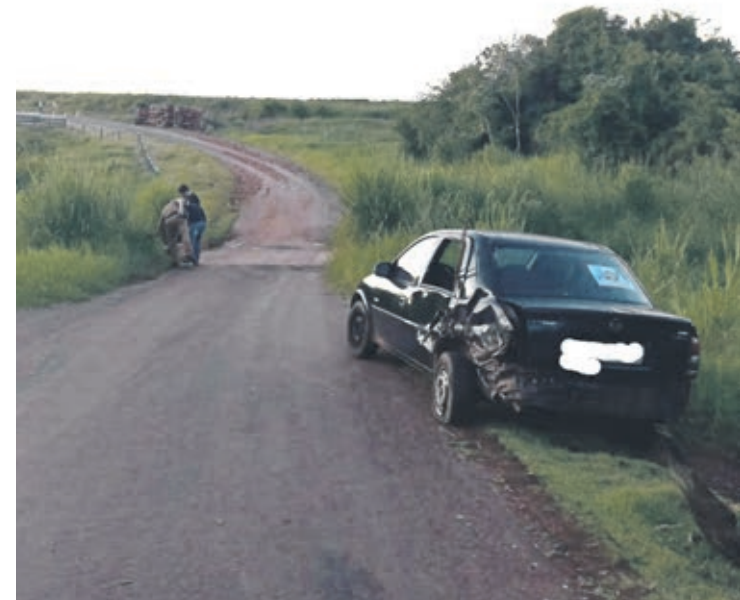
CARRO COM QUEIXA DE FURTO Ainda segundo a PM, no interior do Corsa Sedan

não havia ninguém. Durante checagem no emplacamento do veículo, os policiais constataram que o automóvel