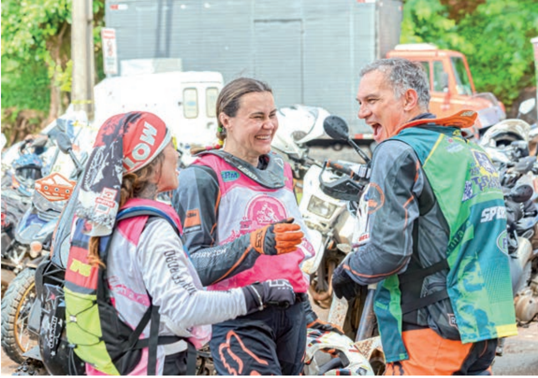
Bom humor dominou o evento em Guaíra