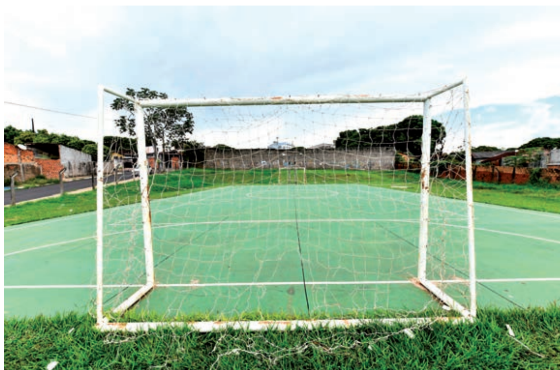
O evento será das 9h às 15h na quadra esportiva do bairro Mutirão do Alvorada

de Saúde vai disponibilizar profissionais de enfermagem para oferecer a atualização de todas as vacinas de rotina para todas as idades. "Também teremos equipe da Vigilância Sanitária para oferecer orientações sobre dengue, zikavírus e chikungunya. Mas também estaremos à disposição para ouvir a população", indica o secretário Herison Cleik da Silva Lima.