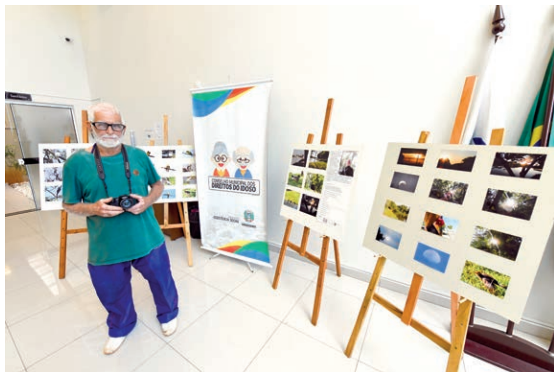
A exposição de fotos fica aberta à visitação pública até o dia de março