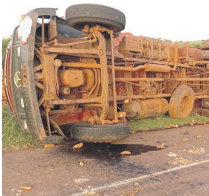
O condutor do caminhão recebeu atendimento no hospital, sendo liberado no mesmo dia.

Devido ao estado de saúde grave da criança, ela teve que ser transferida ao Hospital Cemil de Umuarama (PR). O transporte foi realizado pelo helicóptero do Samu (Serviço de Atendimento Móvel de Urgência).