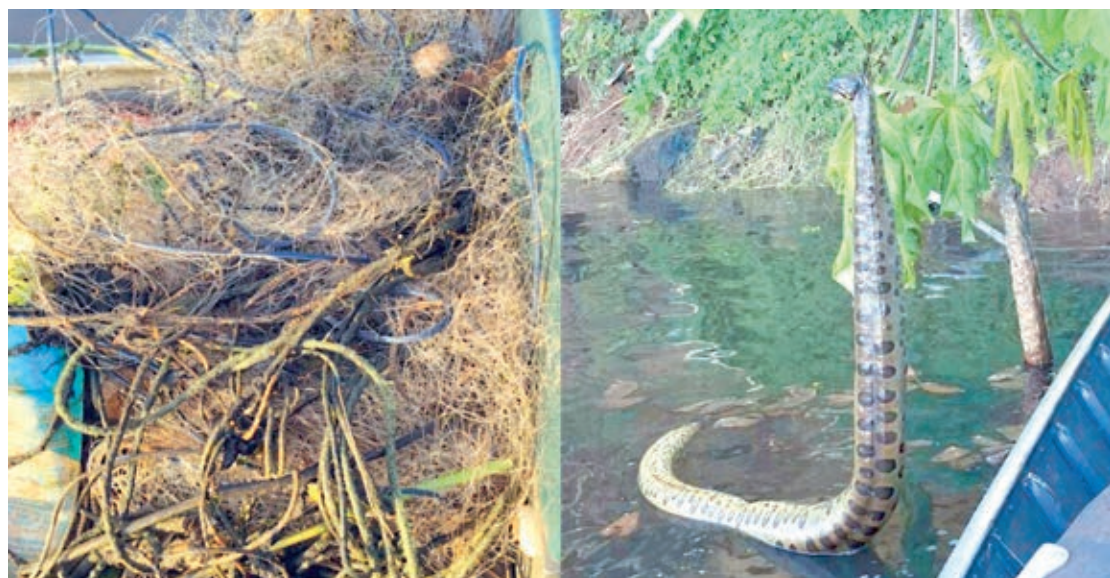
De acordo com a Polícia Ambiental, os policiais realizavam patrulhamento aquático referente ao período do defeso

Equipes da Polícia Ambiental de Umuarama apreenderam apetrechos utilizados para pesca ilegal durante patrulhamento no rio Paraná, na região de divisa entre o Paraná (PR) e o Mato Grosso (MS). Peixes nativos e uma cobra sucuri morta foram encontrados enroscados nos apetrechos.