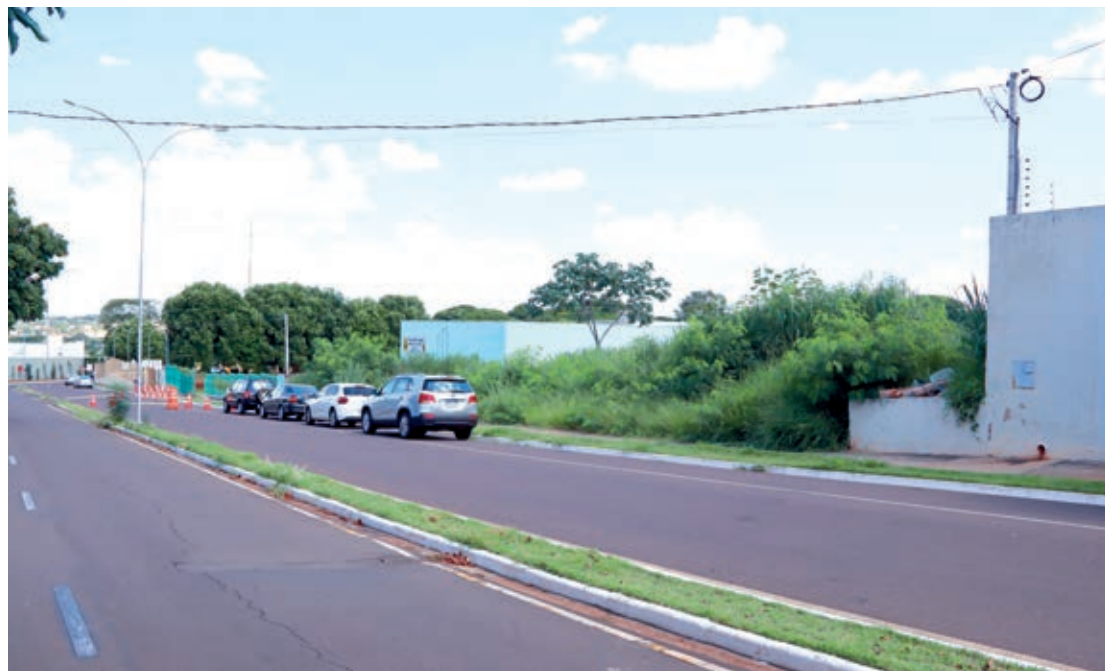
O terreno doado fica ao lado do Pelotão do Batalhão de Polícia Ambiental e vizinho a sede do 25º BPM

Agora, já no início de 2023 e a superação dessa vedação legal, os trâmites necessários a conclusão do projeto voltaram a andar. O prazo máximo para a construção e implantação da nova delegacia será de até 3 anos, contados a partir da data da publicação da lei que autorizou a doação do imóvel.