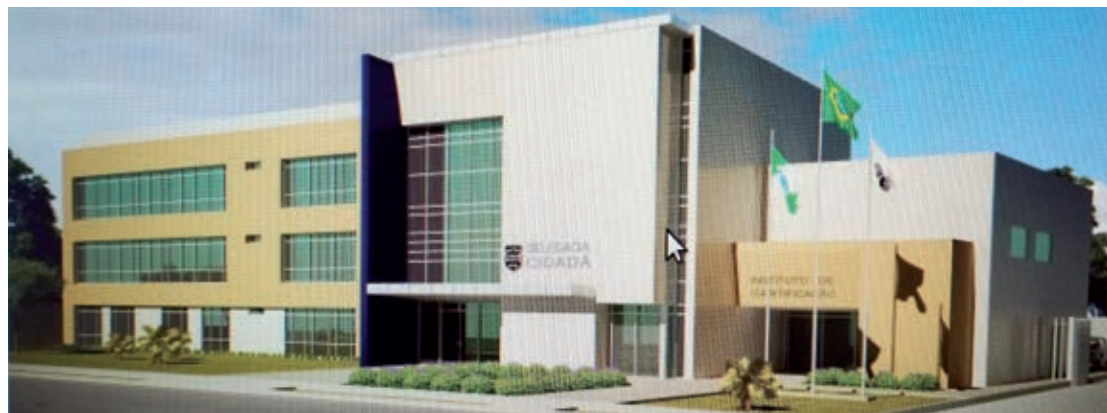
O projeto é de uma Delegacia Cidadã - Padrão III. O Estado tem até 3 anos para concluir a obra

tempos a Polícia Civil de Umuarama aguarda essa iniciativa. "As atuais instalações da delegacia são antigas e, apesar da manutenção periódica, são