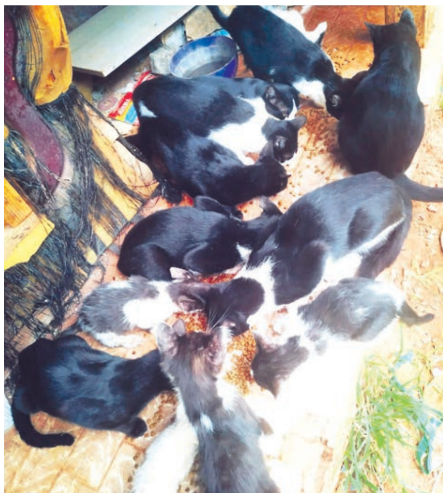
As voluntárias do grupo “Mãos que acolhem por amor” alimentam todos os dias cães e gatos em pontos conhecidos por colônias e presentes em toda a cidade

Além da Saau, a cidade conta ainda com dois hospitais veterinários universitários, que também realizam os procedimentos de castração, a um valor diferenciado das