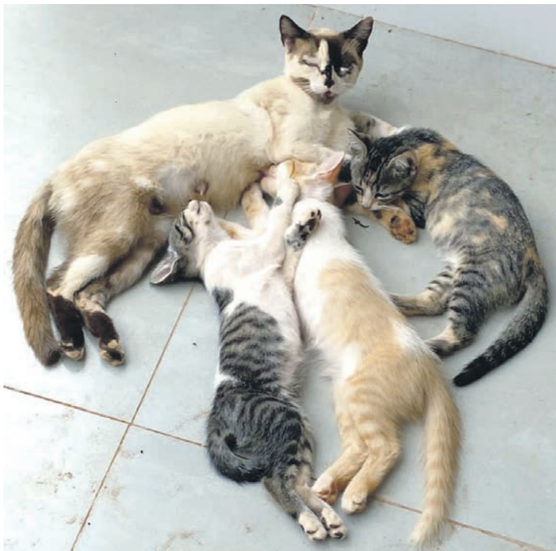
Gata com ninhada foi abandonada na área rural. Com recursos de apoiadores a mãe foi castrada e agora as voluntárias buscam lar para os filhotes