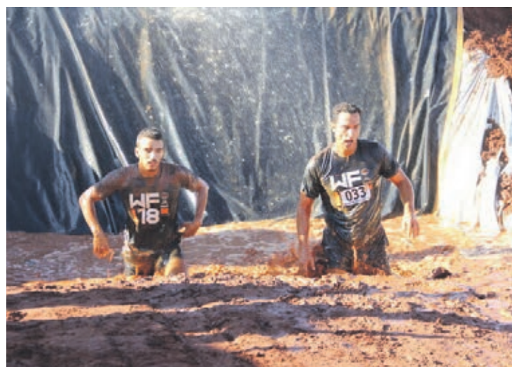
Os obstáculos são muitos e só os mais fortes vencem

“Todos os atletas que cruzarem a linha de chegada de forma legal, que estiverem regularmente inscritos e não descumprirem o regulamento,