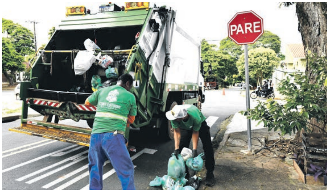
Prefeitura diz que a situação da coleta do lixo estará regularizada já no início da semana

São 13 rotas (10 realizadas na parte da manhã e três à tarde), além da coleta noturna e dos distritos. Esse volume revela a dimensão desse importante serviço público realizado pelo município, que exige o trabalho de 70 garis. Porém o município conta com apenas 37 concursados na ativa. Outros 40 trabalhadores terceirizados prestam serviço temporário, em caráter emergencial, cujo contrato será encerrado ao final deste mês sem a