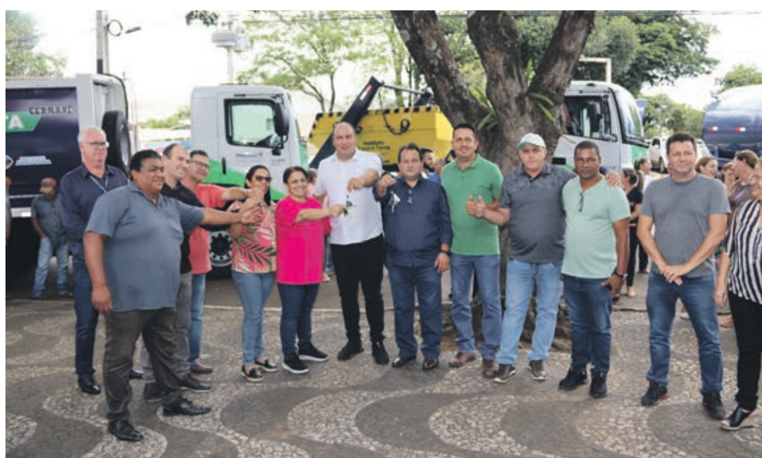
Entrega das chaves dos três caminhões feita pelas autoridades