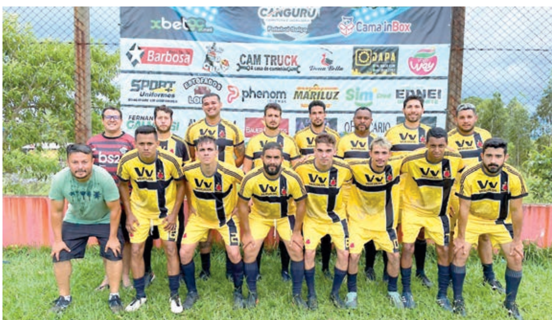
Equipes que disputam neste domingo a final do campeonato

Será realizada neste domingo a grande final do Campeonato Canguru de Futebol Suíço. Estarão em campo os times da Cama InBox contra o Tatu Fundações/Rece pinturas