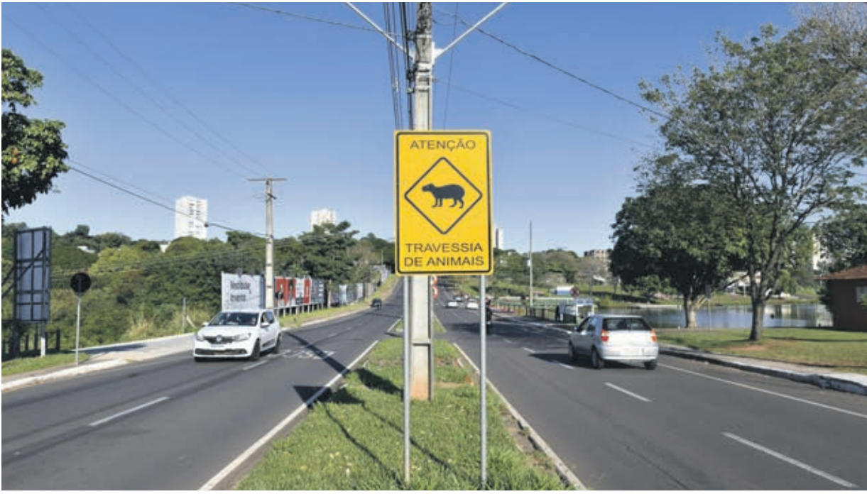
Animal morreu no momento do atropelamento