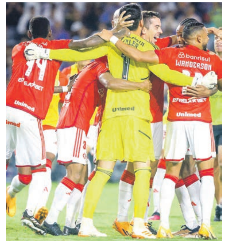
Em casa, Inter tenta embalar no Brasileiro