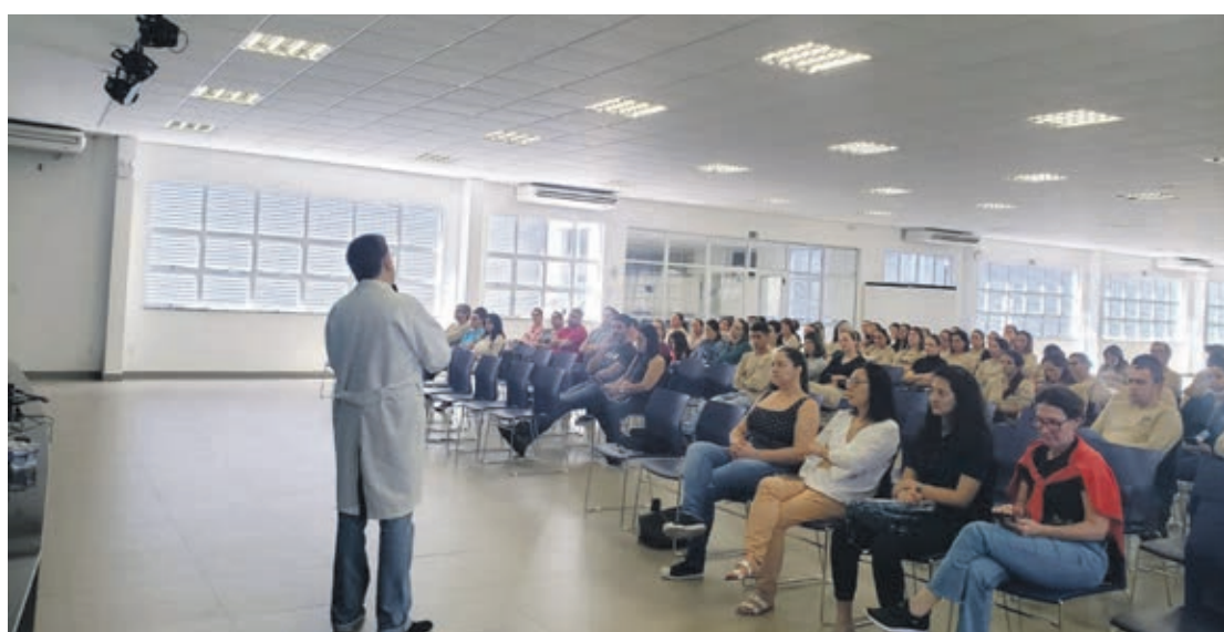
O evento reuniu agentes de endemias, técnicos da Vigilância em Saúde Ambiental, enfermeiros da Atenção Primária em Saúde e enfermeiros

Ele detalha que os animais peçonhentos são reconhecidos como aqueles que produzem ou modificam algum veneno e possuem algum aparato para injetá-lo na sua presa ou predador. “Os principais animais peçonhentos que causam acidentes no Brasil são algumas espécies de serpentes, de escorpiões, de aranhas, de lepidópteros (mariposas e suas larvas), de himenópteros (abelhas, formigas e vespas), de coleópteros (besouros), de