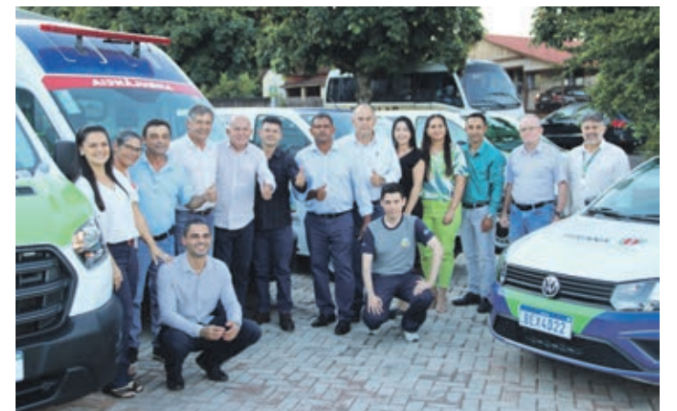
Ao todo seis veículos para a Saúde, incluindo uma de suporte avançado UTI. Na foto, autoridades na entrega