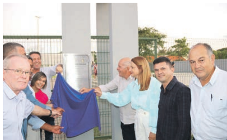
Momento da inauguração do Parque das Perobas