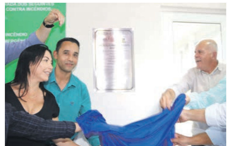
Momento da inauguração no Posto de Saúde