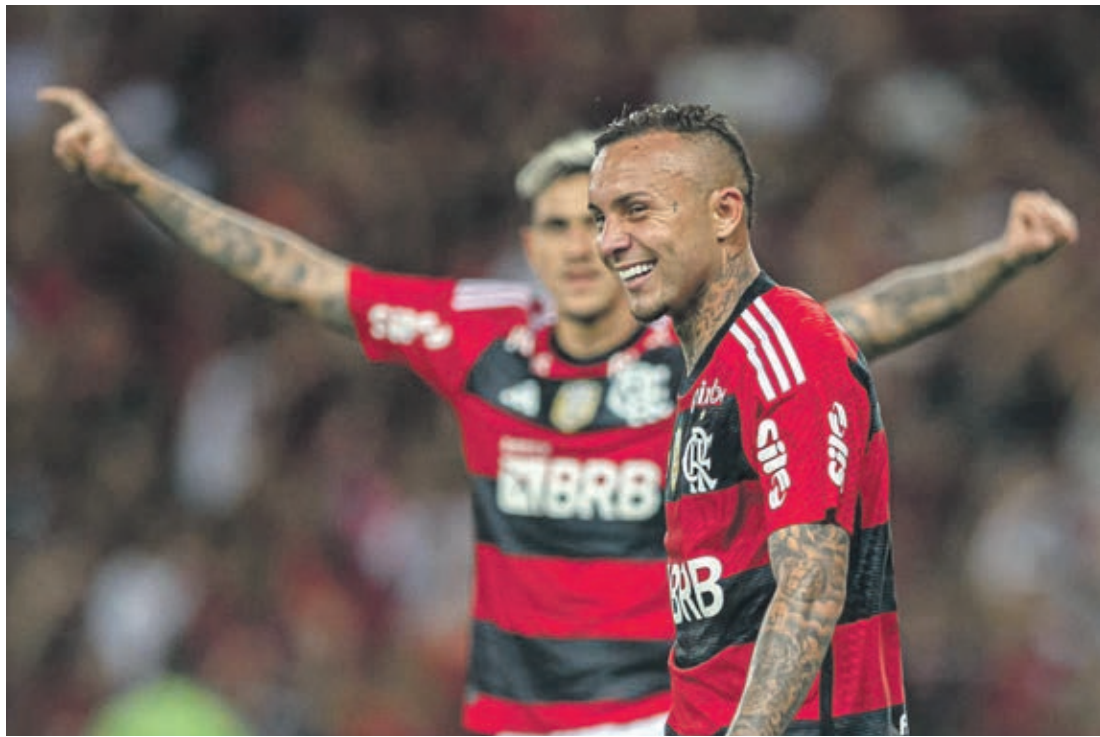
Flamengo vai com força máxima para o clássico

O Botafogo está com 100% de aproveitamento. O time alvinegro venceu o São Paulo por 2 a 1,