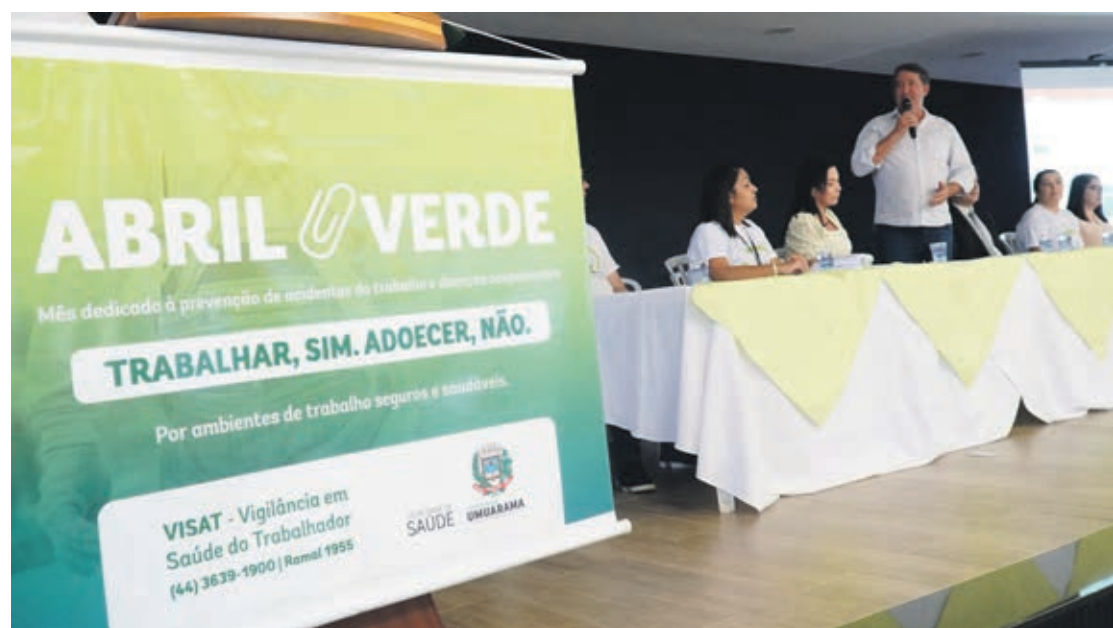
O evento encerrou a programação do Abril Verde, uma ação mundial que busca conscientizar empregadores e empregados sobre os riscos dos acidentes de trabalho

O evento encerrou a programação do Abril Verde, uma ação mundial que busca conscientizar empregadores e empregados sobre os riscos dos acidentes de trabalho e do desenvolvimento de doenças ocupacionais, bem como as formas de prevenção. A Secretaria de Saúde promoveu uma série de ações reforçando os ideais do movimento, criado pela Organização Internacional do Trabalho (OIT) em me-