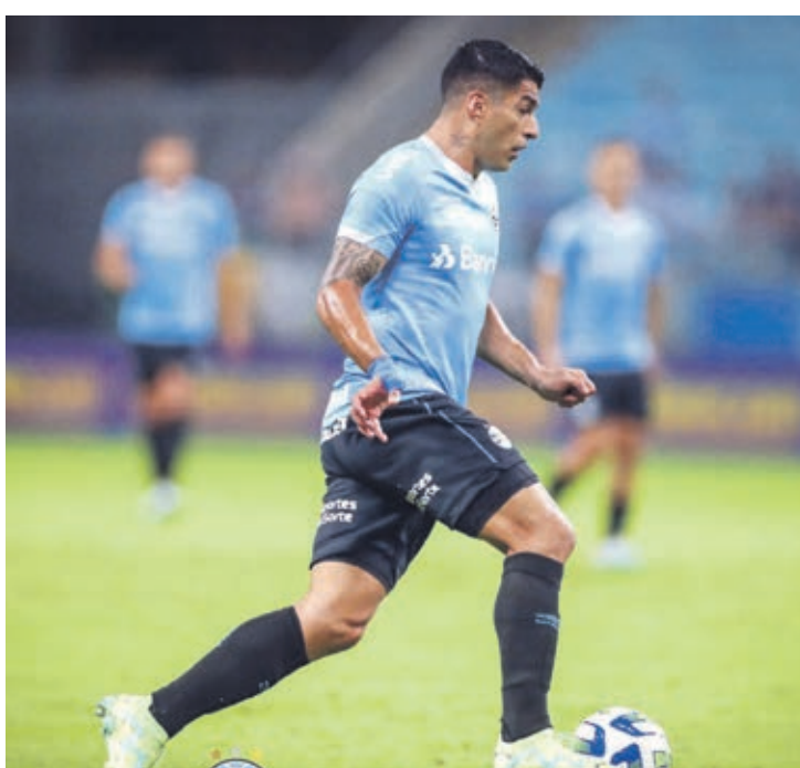
Grêmio conta com a força de Soares para tentar a vitória

Atualmente, o Grêmio aparece na parte intermediária da tabela com três pontos. Nas primeiras rodadas, venceu em casa o Santos por 1 a 0 e depois perdeu fora para o Cruzeiro pelo mesmo placar. Já o Cuiabá somou um ponto em dois jogos. Primeiro perdeu fora