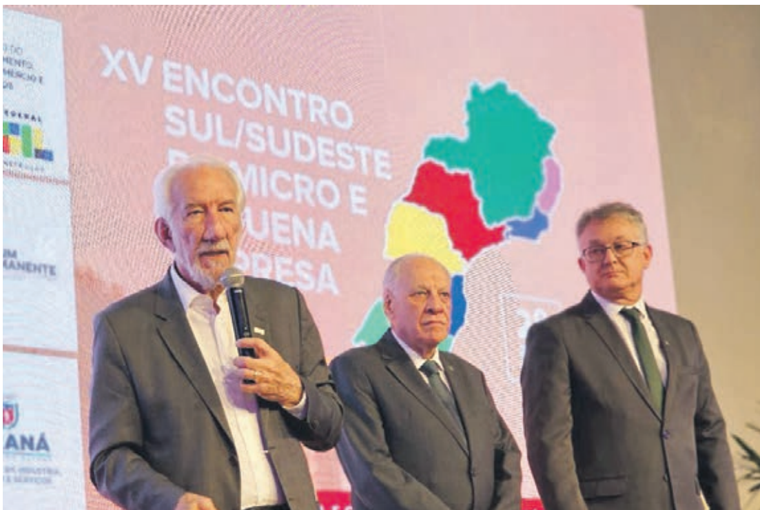
Vice-governador Darci Piana participou do evento

“Nosso objetivo é facilitar o trabalho do micro e pequeno empreendedor. Tornar o atendimento mais rápido na Junta Comercial