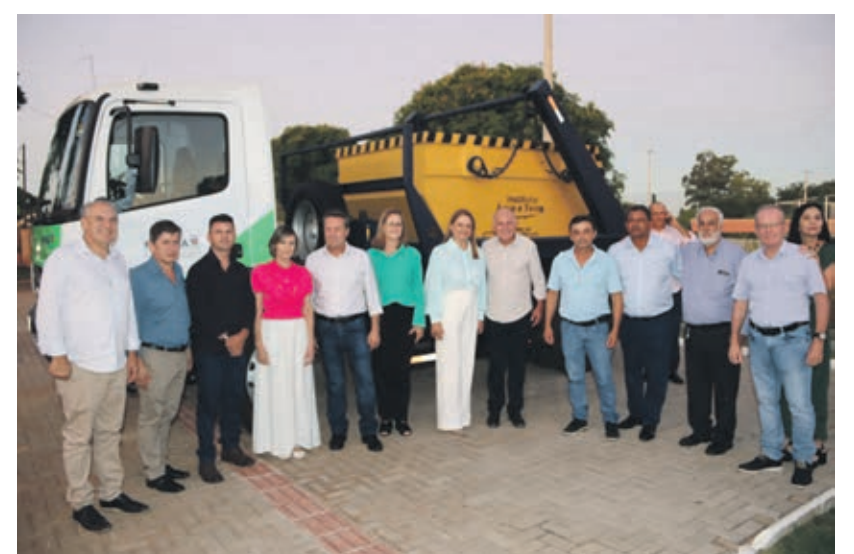
Autoridades na entrega oficial do caminhão novo para o município