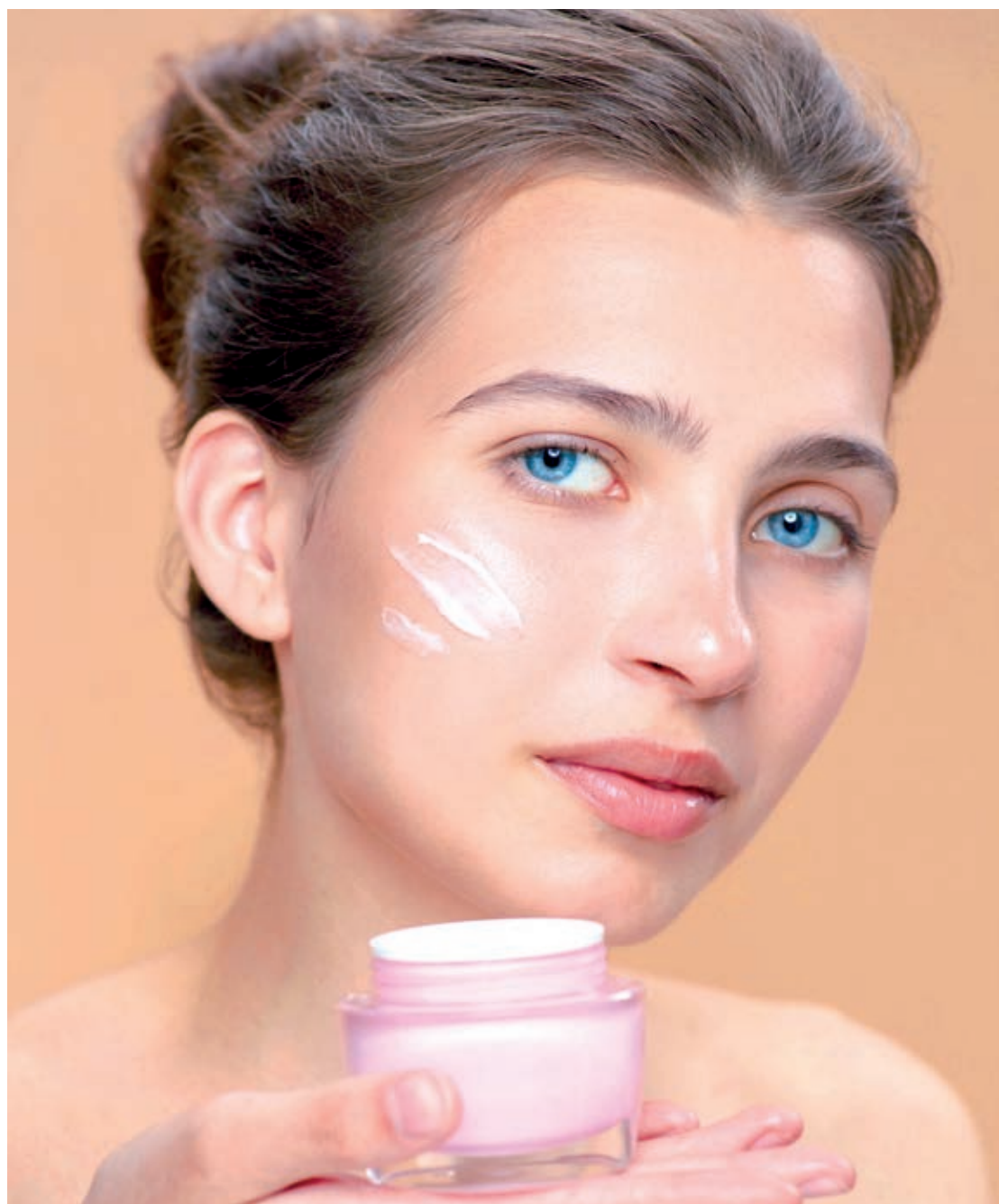
Para garantir o sucesso nos cuidados com a pele, é importante consultar dermatologista e assim adequar corretamente os cosméticos a real necessidade da pele

As sombras também ganharam ingredientes especiais. São superfinais com ingredientes da seda e garantem um visual mais leve