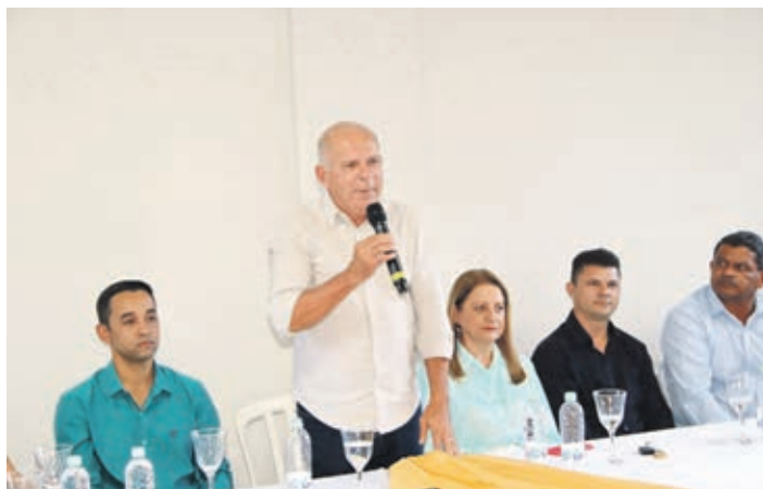
Prefeito Almir Almeida enaltece a importância das obras inauguradas