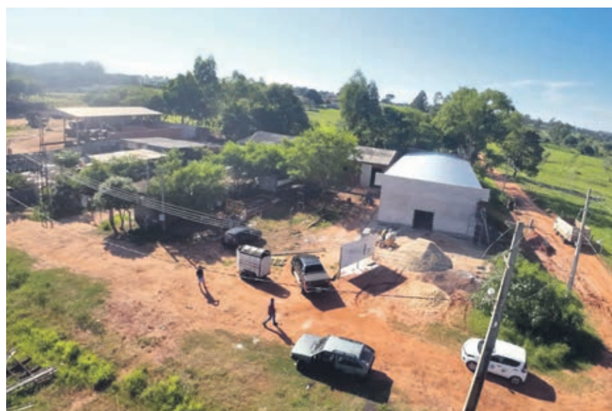
Barracão Industrial em construção