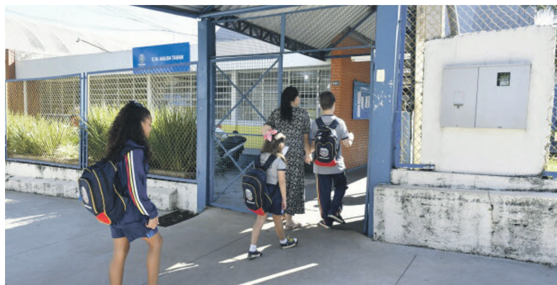
O momento é de esclarecer os pais sobre o pânico disseminado por fake news e ameaças falsas nas redes sociais

Rissato lembrou que as ações do município estão integradas com a Polícia Militar, que também intensificou o patrulhamento e a presença nas escolas estaduais, e com