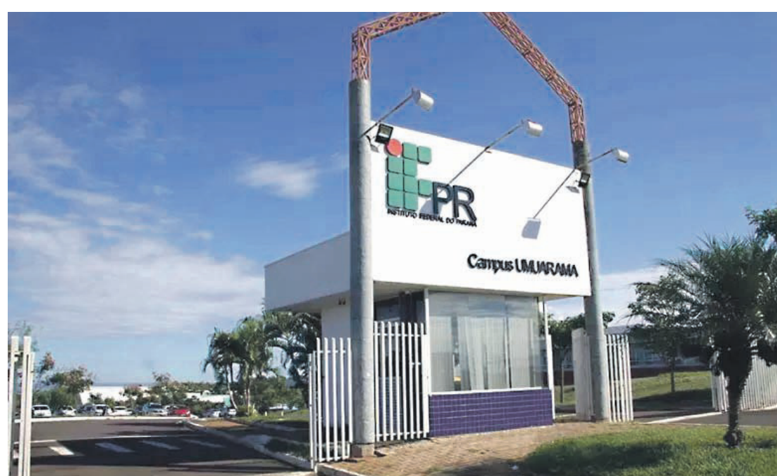
Os candidatos interessados em ocupar vaga remanescente deverão participar da sessão, que ocorrerá no Campus Umuarama

Todos podem concorrer as vagas remanescentes desde que possuam Ensino Médio completo. Já na data do sorteio os interessados, portando RG, preencherão uma ficha de inscrição numerada. Essa ficha será conferida por um servidor do IFPR e inserida em uma urna. No momento do sorteio, serão retiradas o número de fichas