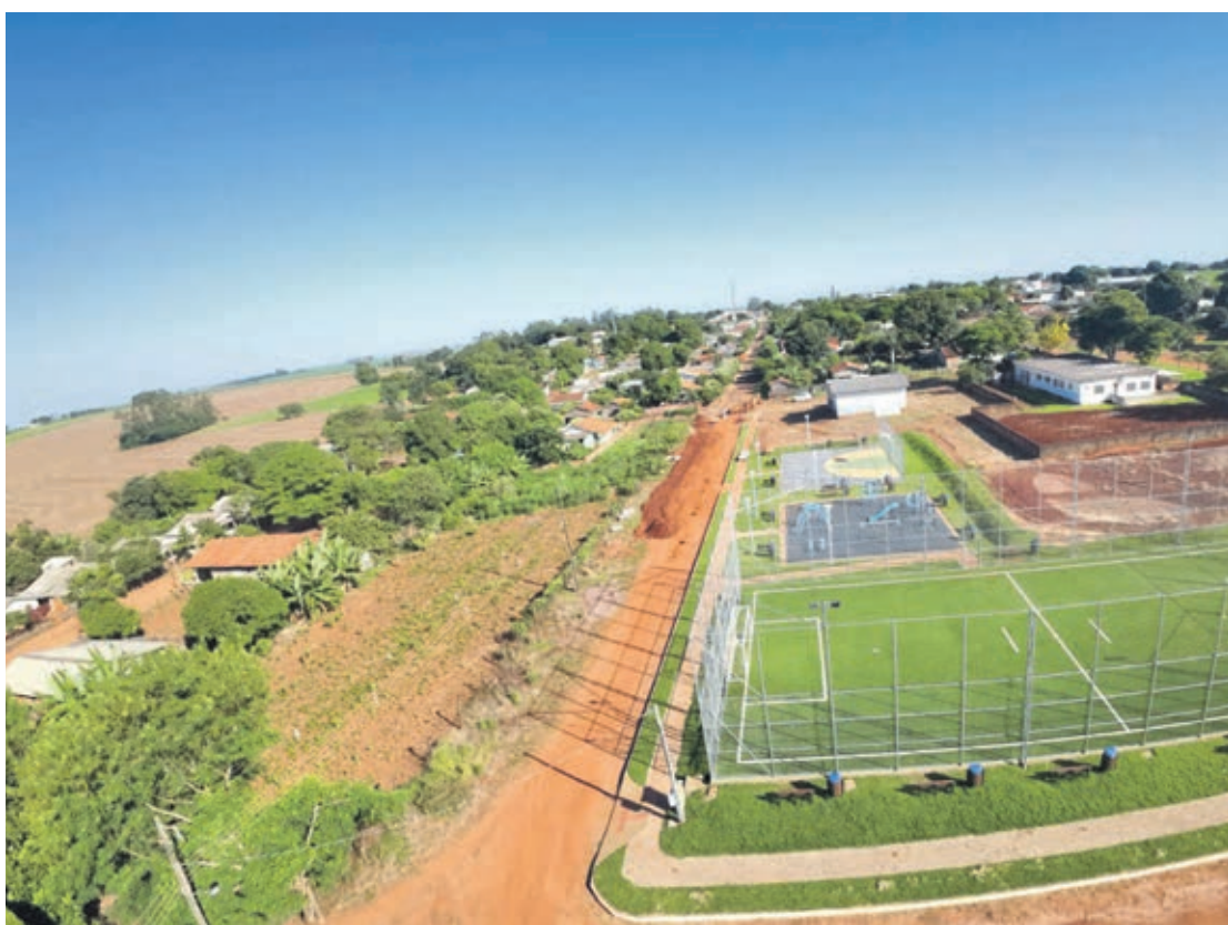
Praça Meu Campinho em Saltinho do Oeste e Mirante do Piquiri.