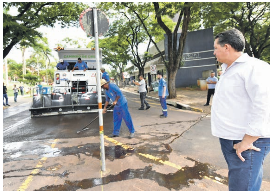
Como o processo de recuperação das vias pela micropavimentação é bastante detalhado, os moradores das regiões contempladas serão sempre comunicados com antecedência

Com relação ao cronograma, ainda não há uma