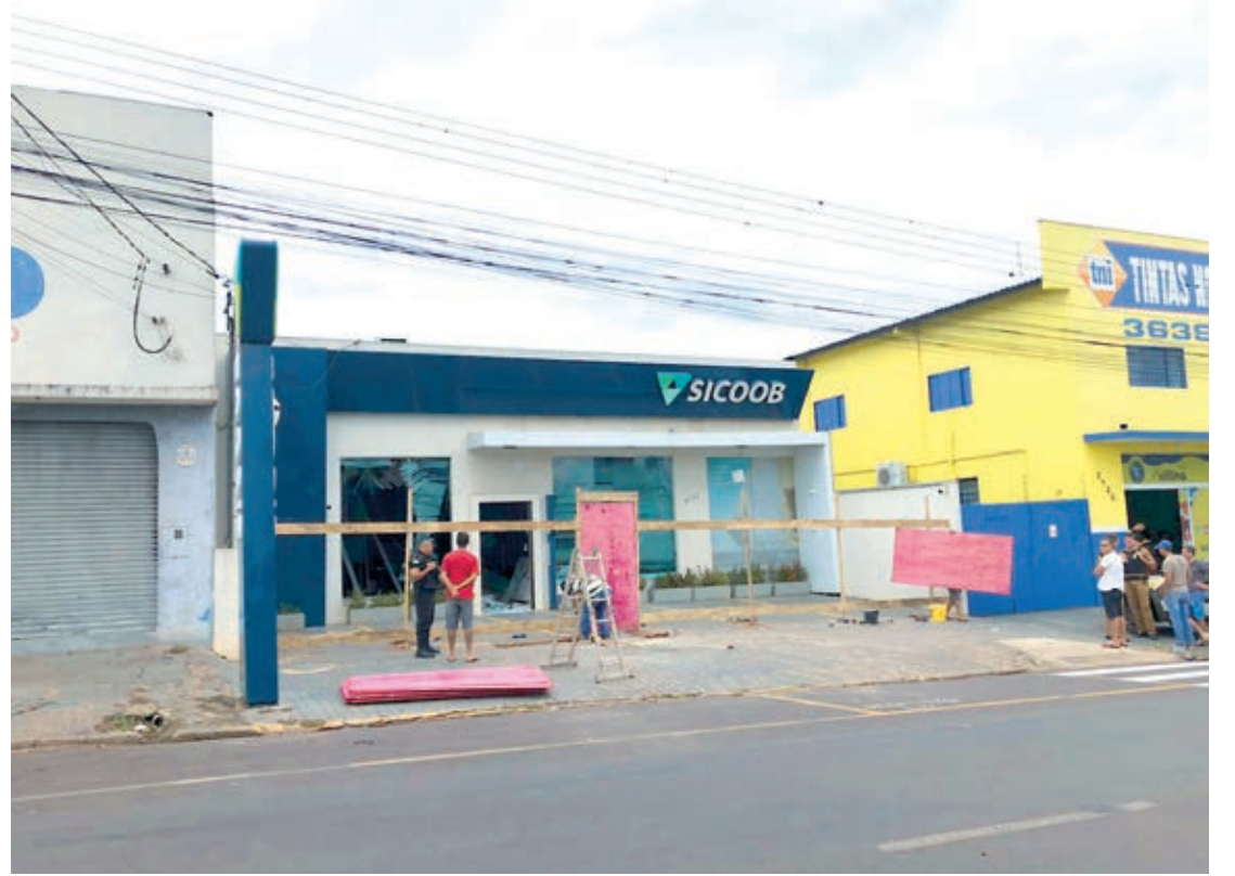
O valor do prejuízo deixado na agência ainda está sendo calculado e não há previsão de reabertura para atendimento ao público