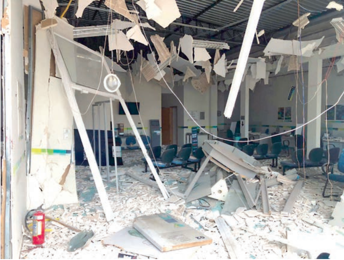
A explosão ocorreu durante a madrugada e deixou a agência totalmente destruída