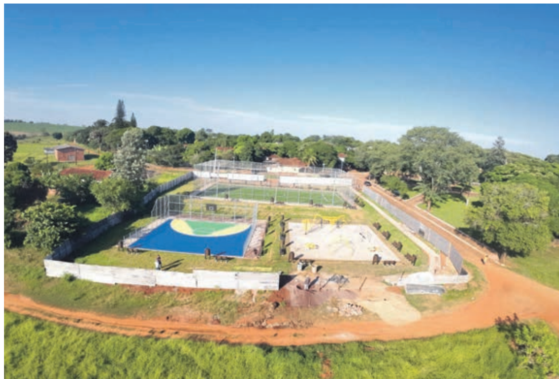
Praça Meu Campinho no distrito de Paulistânia