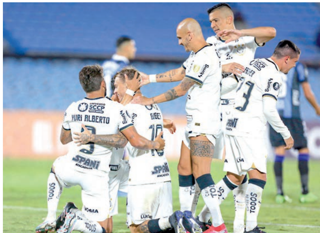
Após fiasco na Copa do Brasil, Corinthians estreia no Brasileiro sob pressão

Será, inclusive, o primeiro jogo do Corinthians na Neo Química Arena desde a queda no Estadual há mais de um mês. No ano, o aproveitamento da equipe em sua casa é de 81% - cinco vitórias e dois empates, todos os jogos válidos pelo Paulistão.