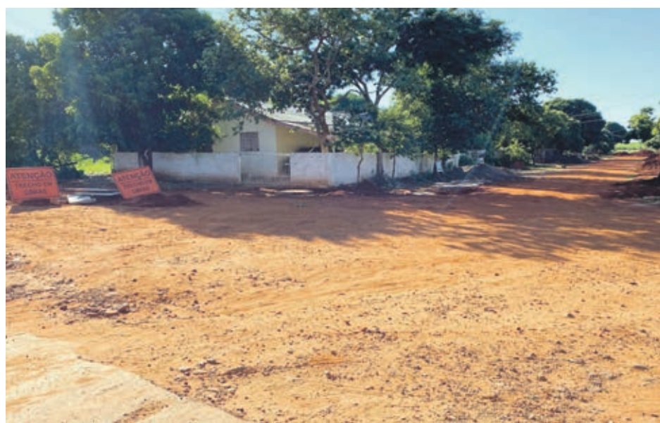
Pavimentação Asfáltica em Paulistânia