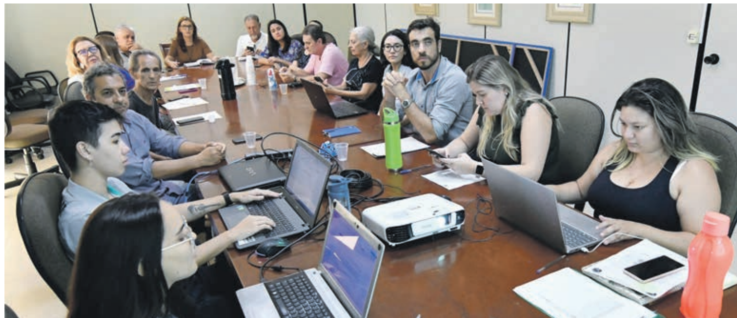
A empresa Ambiente-se, que desenvolve o trabalho, falou sobre as medidas que devem ser tomadas tanto para proteger a Unidade de Conservação

Umuarama - Propostas para a revisão do plano de manejo da Área de Proteção Ambiental (APA) do Rio Piava, único manancial de abastecimento da cidade, foram apresentadas a membros do Conselho Municipal do Meio Ambiente (CMMA), em reunião realizada na Prefeitura de Umuarama. A empresa Ambiente-se, que desenvolve o trabalho, falou sobre as medidas que devem ser tomadas tanto