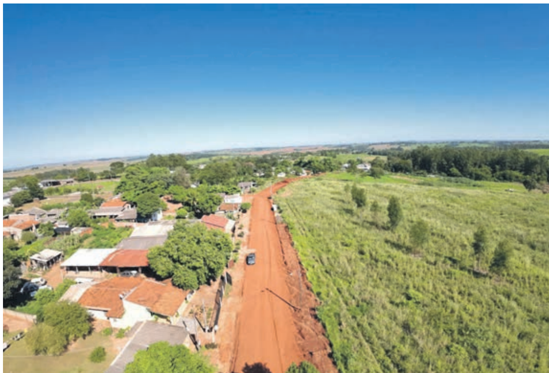
Pavimentação Asfáltica da Rua Silveira Lima