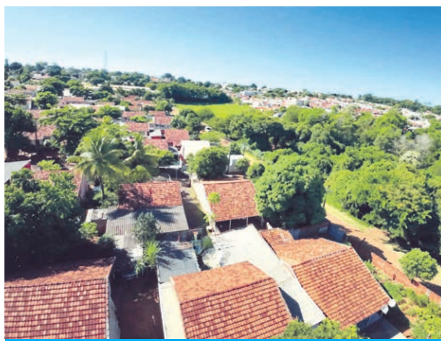
Pavimentação na Rua G no Conjunto Vila Verde