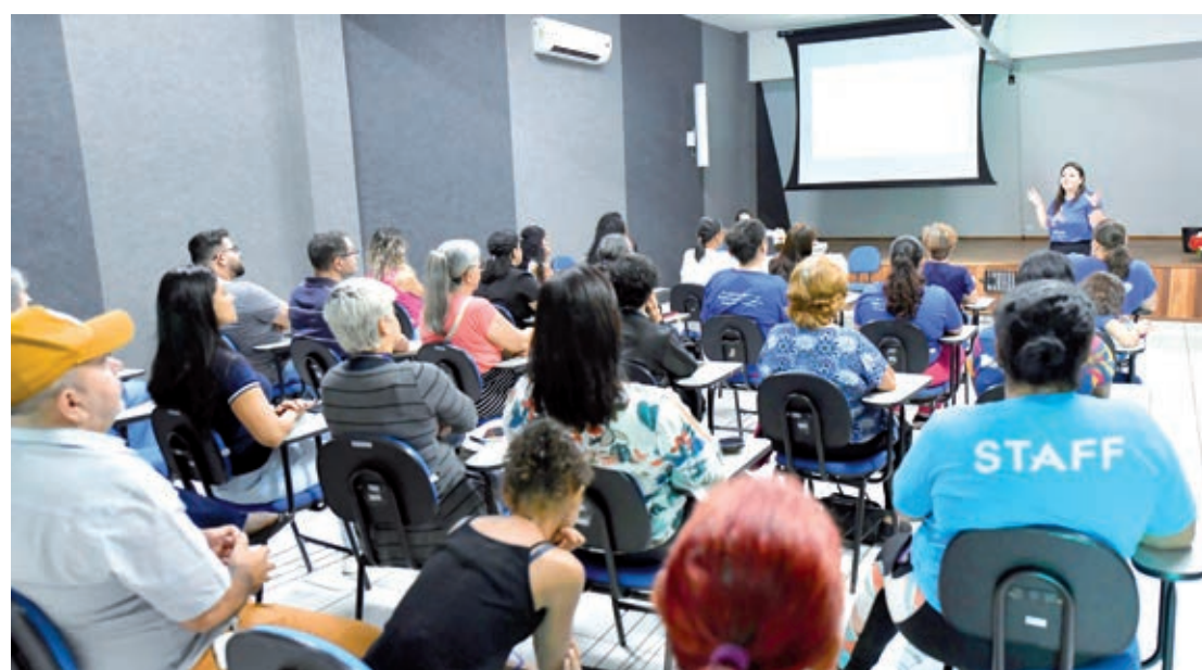
Famílias de crianças e adolescentes com Transtorno de Espectro Autista (TEA) participaram de uma roda de conversa na manhã desta sexta-feira, 14