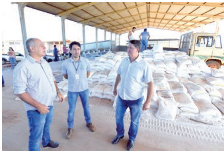
A Secretaria Municipal de Agricultura entregou mais um lote de calcário para pequenos produtores rurais de Umuarama