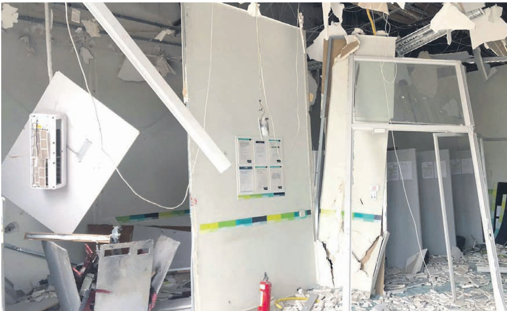
Explosivos usados na agência danificaram toda a estrutura das caixas eletrônicas

Dois homens explodiram na madrugada de ontem a caixa eletrônica da agência Sicoob na avenida Ângelo Moreira da Fonseca, em Umuarama. A ação durou apenas um minuto e vinte e três segundos entre a chegada da dupla em uma motocicleta, a explosão, a retirada de um malote e a fuga. O prédio ficou parcialmente destruído. Tudo foi flagrado por câmeras de segurança. E os ladrões mostraram um pouco de amorismo na ação. A polícia agiu rápido e no meio do dia deste sábado já havia identificado e detido três suspeitos de envolvimento na ação. Página A6