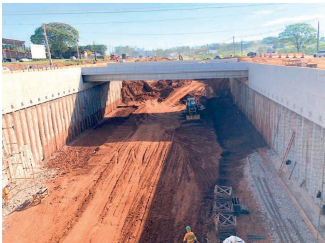
A duplicação da PR-323 em Umuarama atingiu a marca de 70,45% da obra na medição de setembro

Assessoria do DER ressaltou que a duplicação em Umuarama, com o investimento de R$ 66,1 milhões, atingiu a marca de 70,45% na medição de setembro e com a trégua nas chuvas, os trabalhos estão concentrados na implantação do novo pavimento e a ligação com as novas obras de arte especiais no antigo Trevo Gauchão e Trevo de Mariluz. (Na construção civil é usado o jargão técnico de Obras de Arte Especiais (OAEs) para grandes construções de infraestrutura: pontes, rodovias, viadutos, túneis, ferrovias e entre outras. Essas obras são destinadas a estruturar ou fortalecer redes viárias).