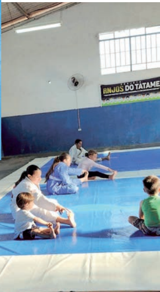
Alunos se aquecendo antes de começar o treino