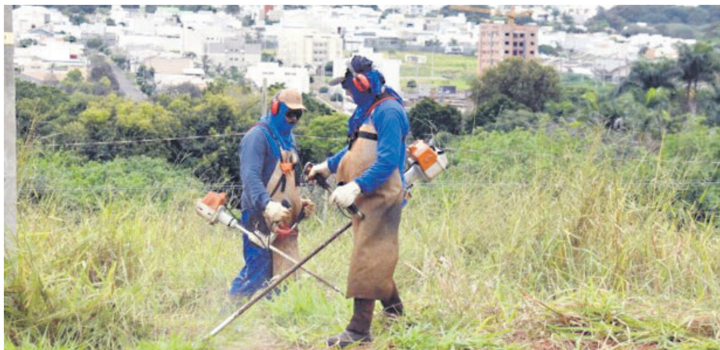
Exatamente 2.979 profissionais que trabalham na Prefeitura de Umuarama terão seus salários depositados na manhã desta sexta-feira (28), quando se comemora o Dia do Servidor Público

Em mensagem aos servidores, Pimentel elogiou a dedicação desses quase 3 mil profissionais que, segundo ele, saem de suas casas para contribuir com a construção de uma das cidades mais importantes do Paraná. “Umuarama tem em sua linha de frente, trabalhadores que se dedicam com ética, garra e determinação para manter o motor da administração municipal em pleno funcionamento. E o Dia do