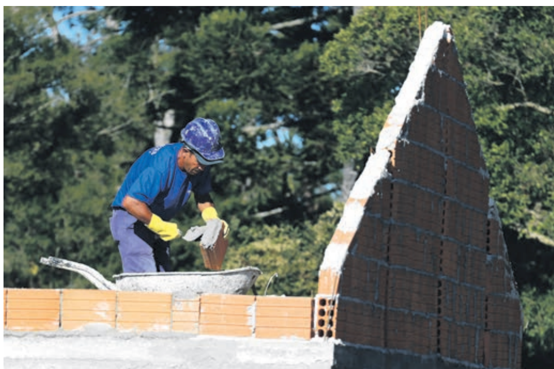
A grande maioria das cidades paranaenses está com saldo positivo na geração de empregos no ano

“Também é importante destacar que em setembro tivemos o maior número de contratações no comércio neste ano, superando agos-