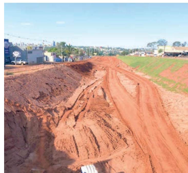
A duplicação do trecho da PR-323, em Umuarama, conhecido com trevo do Gauchão, terá o prazo de conclusão prorrogada

A duplicação do trecho da PR-323, em Doutor Camargo, na Região Metropolitana de Maringá, será concluída nas próximas semanas. Segundo o Departamento de Estradas de Rodagem do Paraná (DER/PR), mais de 95% dos serviços já foram finalizados. A obra recebeu investimento de R$ 38.626.237,07 e está incluída no Programa Estratégico de Infraestrutura e Logística de Transportes do Paraná, uma parceria do governo estadual com o Banco Interamericano de Desenvolvimento (BID), que traz uma série de melhorias na integração rodoviária em todo Estado.