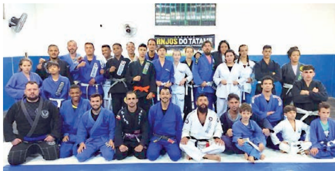
As aulas são realizadas no salão comunitário do parque Industrial