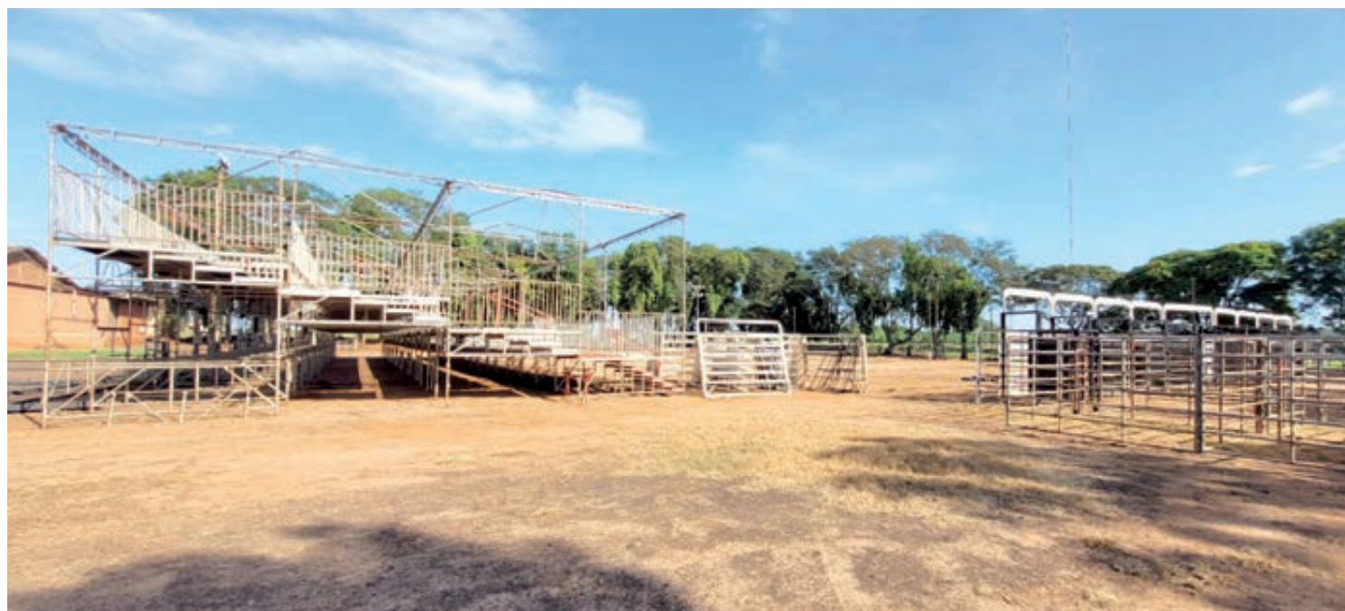
Estrutura do parque está sendo preparada para a festa

Brasilândia do Sul - O trabalho na Associação dos Pequenos e Médios Agricultores de Brasilândia do Sul - APMA - na montagem da estrutura aos poucos vai ganhando o formato para a realização da melhor festa de peão da região e do Estado do Paraná.