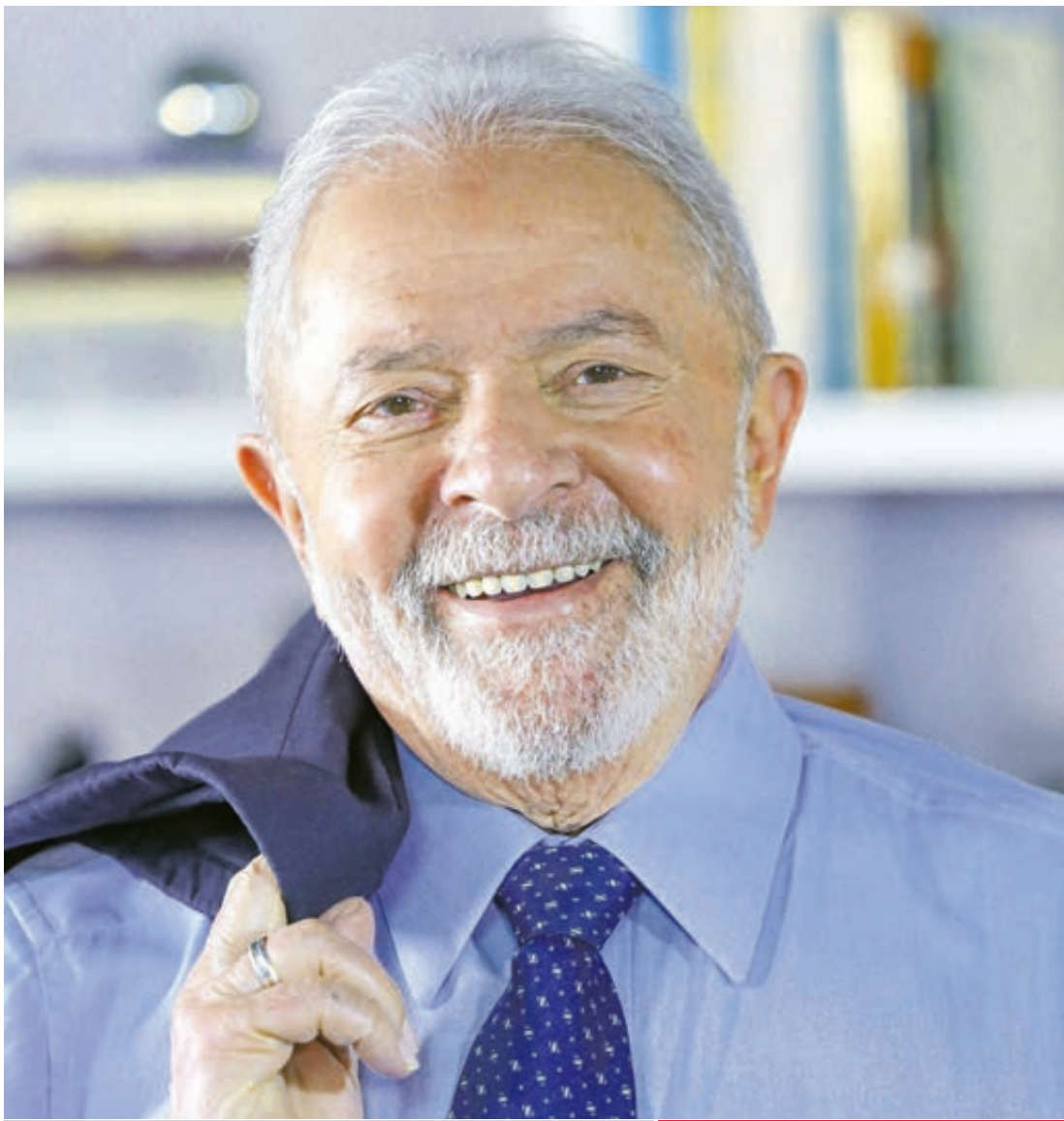
Luiz Inácio Lula da Silva