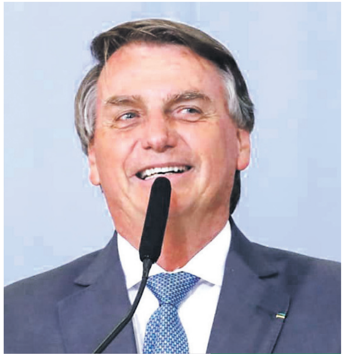
Jair Messias Bolsonaro