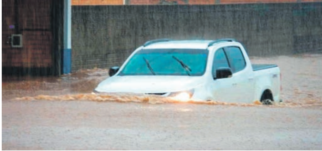
Decretada situação de emergência nas regiões Oeste, Sudoeste, Centro-Sul e Sudeste do Estado por conta das chuvas e temporais

Na prática, com o decreto, o Estado não precisa fazer licitações para contratar serviços e realizar compras destinadas à reabilitação dos cenários de calamidade, desde que possam ser concluídas no prazo máximo de 180 dias consecutivos e ininterruptos, contados a partir da caracterização do desastre. Ele também autoriza mobilização de todas as áreas do Governo em prol das ações da Defesa Civil Estadual.