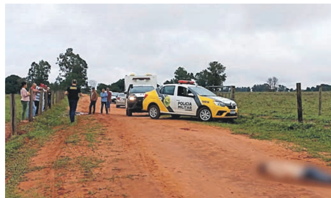
Os policiais disseram que encontraram o corpo com diversas perfurações e degolado

Os dois outros veículos que acompanhavam Voyage, um conseguiu fugir e outro foi abordado na Estrada Boiadeira, próximo a Campo Mourão. Os três ocupantes foram presos em flagrante.