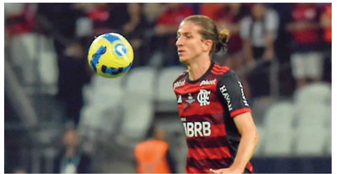
Flamengo vai com poucos titulares para a partida de hoje

Se para o Flamengo a partida deste sábado não tem muito valor, o Atlético-MG está encarando