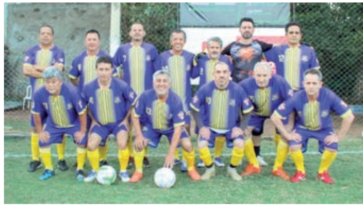
Equipe do Rancho MR mostrou força e goleou na final por 3 x 0 a Clínica de Olhos Almeida

A 1ª copa Kairós Walter Nery 50 e 35 Master do HCC prestou mais uma homenagem a um associado, desta vez Walter Nery foi o grande homenageado, associado antigo do clube onde