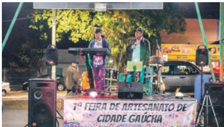
Evento mostrou a qualidade de muitos produtos produzidos em Cidade Gaúcha