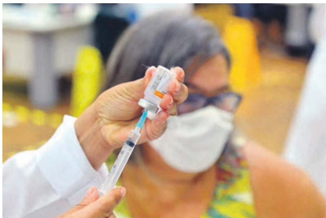
Na UBS Panorama também serão disponibilizadas quartas doses da vacina contra covid

A Secretaria de Saúde aproveita para dar prosseguimento à campanha Outubro Rosa, oferecendo neste sábado (15) coleta de exames citopatológicos (para detectar câncer de colo de útero) e fazer agendamentos para mamografias em três unidades de saúde: Panorama (das 8h às 11h30 e das 13h30 às 17h), Parque Industrial (das 8h às 13h) e 26 de Junho (das 8h às 12h).