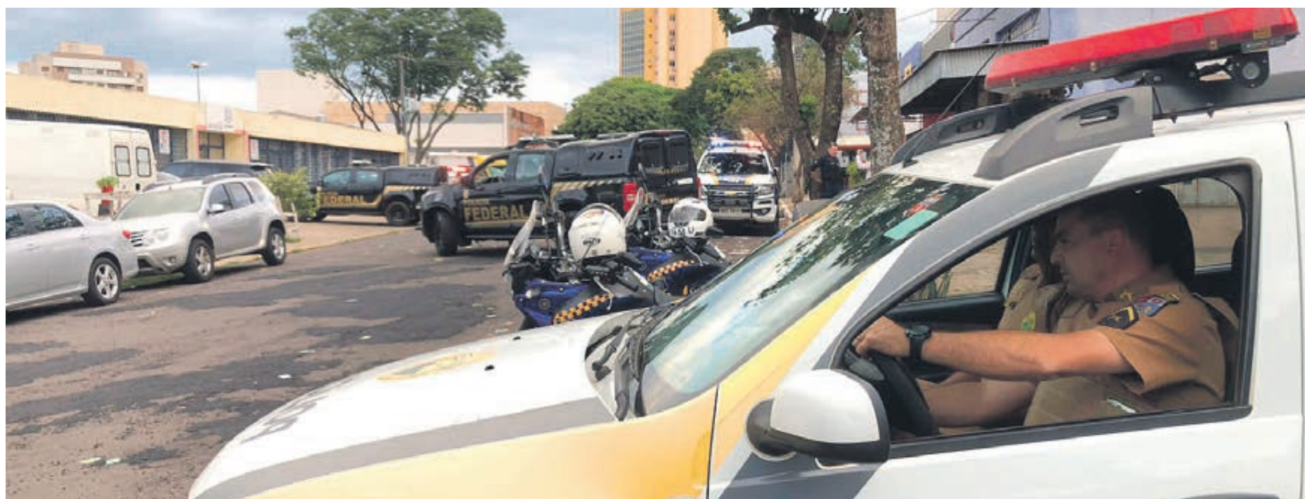
Região do Fórum Eleitoral ficou isolada após o encerramento da votação por questão de segurança

aglutinação de seções eleitorais. A Zona 89ª abarcou a Zona 202ª e após isso por determinação da Justiça Eleitoral, houve a