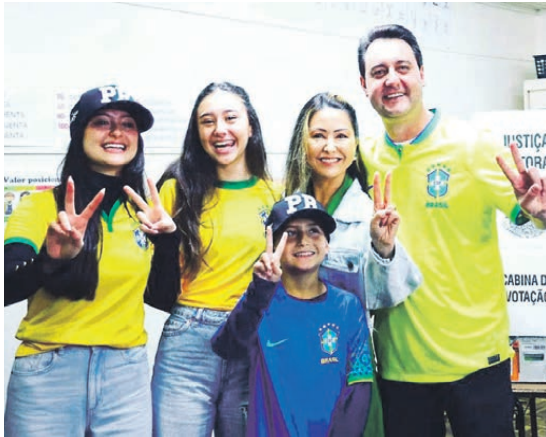
Governador Ratinho Jr. ao votar ontem ao lado da família

“Obrigado, Paraná, por mais uma vez acreditar em um pé vermelho sonhador. Tenho orgulho de continuar a trabalhar nessa transformação”, disse Ratinho Junior logo