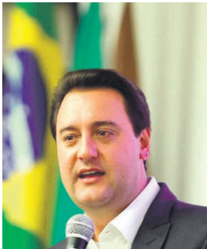
após a confirmação do resultado. Ratinho Jr.

Nascido em Jandaia do Sul (PR), Carlos Massa Ratinho Junior, 41 anos, é