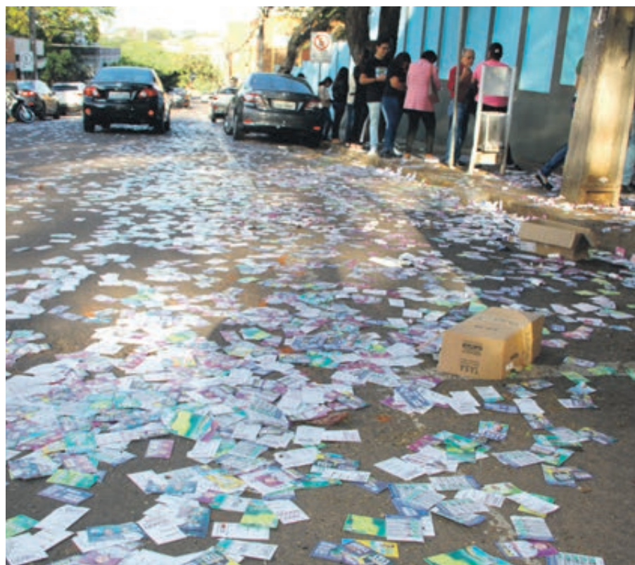
Além do problema ambiental, os papéis levam perigo para os pedestres, que podem escorregar

O infrator e o candidato beneficiado estão sujeitos à multa, sem prejuízo da apu-