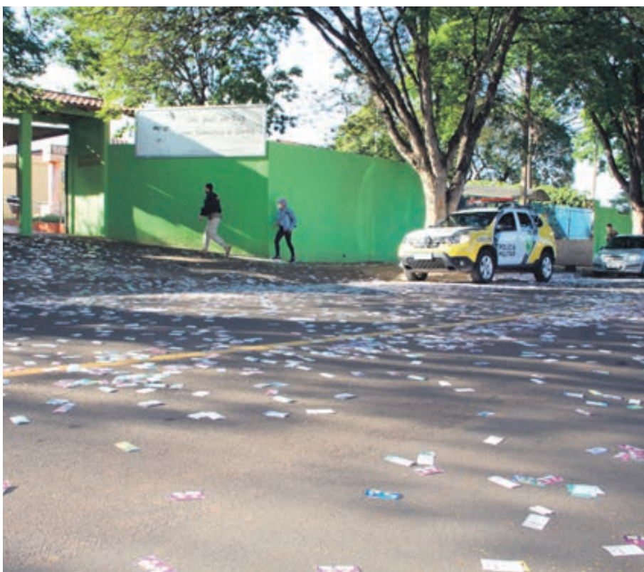
No Colégio Monteiro Lobato, assim como nos demais locais de votação, teve muita sujeira

ração de crime eleitoral, mesmo que a infração ocorra na véspera da eleição.