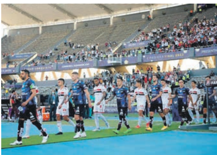
São Paulo não fez um bom jogo e perdeu o título

"Del Valle cedeu bastante espaço, mas soube controlar a bola. Inegavelmente tem uma qualidade de jogo muito boa. No momento que tivemos nossas chances, não tivemos sorte. Cabeçada do