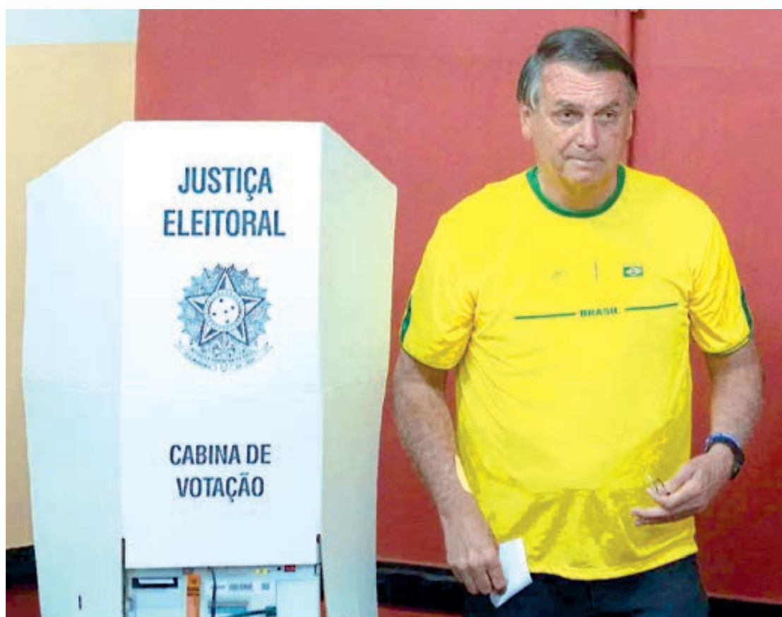
No primeiro turno das Eleições 2022, Jair Bolsonaro foi o candidato mais votado em Umuarama, com 40.972 de votos válidos

Umuarama - No primeiro turno das Eleições 2022, Jair Bolsonaro foi o candidato mais votado para presidente do Brasil em Umuarama, com 40.972 de votos válidos. O candidato Luiz Inácio Lula da Silva teve 16.880 de votos válido. No segundo turno das Eleições de 2018, Jair Bolsonaro teve 75% dos votos em