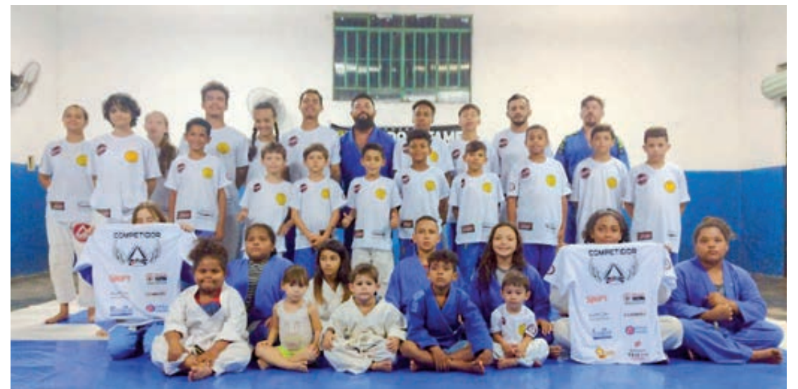
O projeto reúne cerca de 60 alunos, sendo crianças, adolescentes, jovens e até mesmo adultos

HORÁRIO DAS AULAS As aulas são realizadas todas as terças-feiras, quartas-feiras e sábados, no salão comunitário do bairro. Nos dias de semana os treinos são divididos em três períodos - manhã, tarde e noite. No período da manhã as aulas começam às 10h e vai até as 11h30. No período vespertino o início é às 15h30, com término às 17h. À noite, as aulas são das 17h às 20h. Já nos sábados as aulas ocorrem apenas no período vespertino - das 15h00 às 17h.