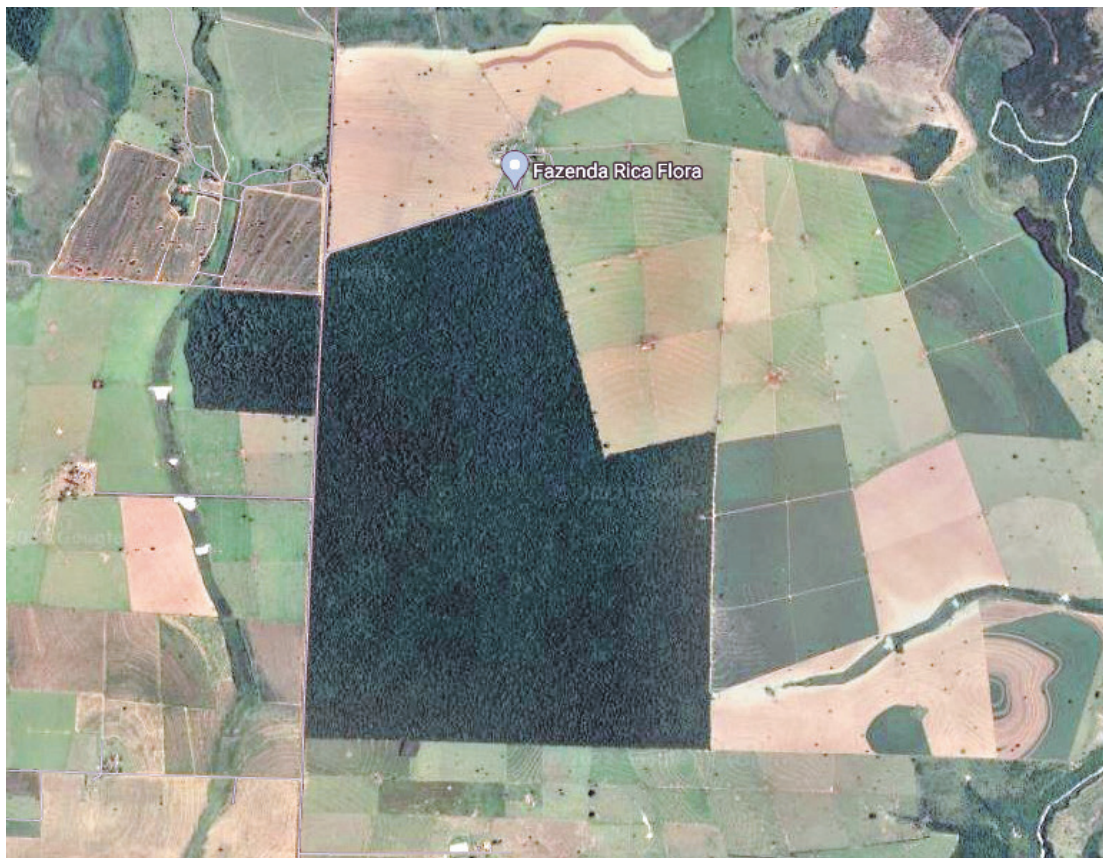
Visão de cima, as reservas de mata fechada impressionam