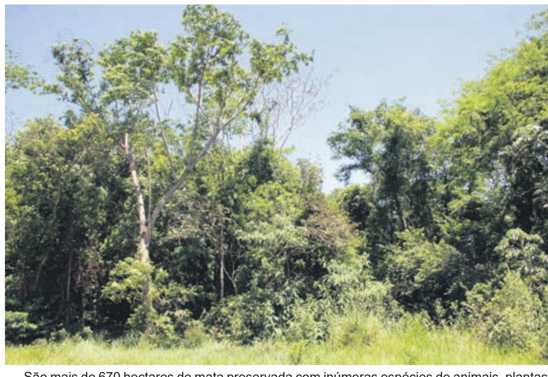
São mais de 670 hectares de mata preservada com inúmeras espécies de animais, plantas, pássaros e outros