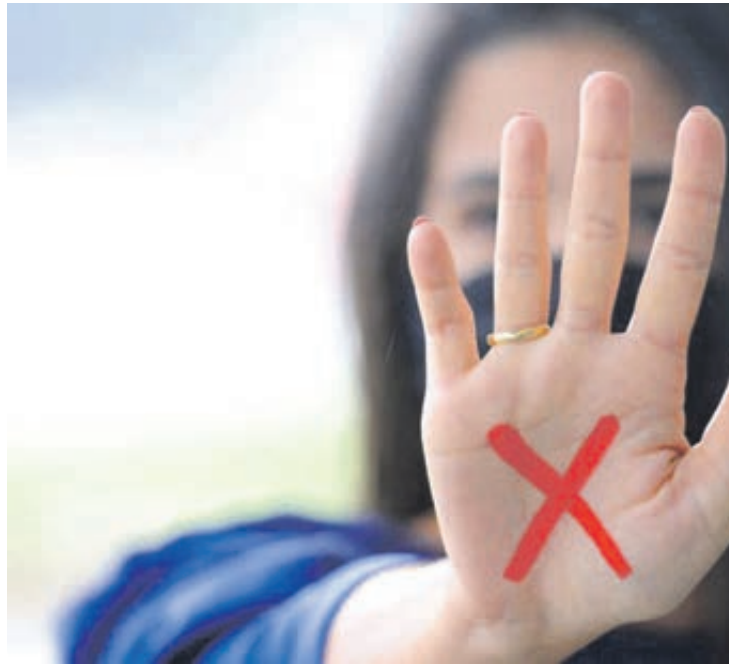
O levantamento revela ainda que 36% das 800 brasileiras entrevistadas já foram vítimas de violência doméstica

No questionário, 66% dos homens que admitem