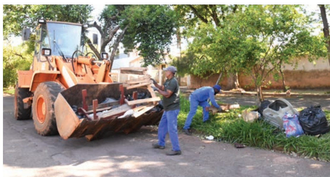
A megaoperação de serviços públicos é uma realização da Prefeitura de Umuarama e esta semana retirou 80 toneladas de entulhos dessas três localidades

Obras, Agricultura, Meio Ambiente, Habitação, Cultura e Smel (Esporte e Lazer). “Iniciamos pelo Sonho Meu, fomos ao Dom Bosco, ao Industrial, enfim, estamos, aos poucos, levando este projeto a todas as regiões da cidade. É uma forma que encontramos de melhorar a qualidade de vida dos cidadãos”, observa o prefeito Hermes Pimentel, indicando que o encerramento da Operação Bairro Limpo está agendado para o domingo, dia 27, com programação especial para as crianças.