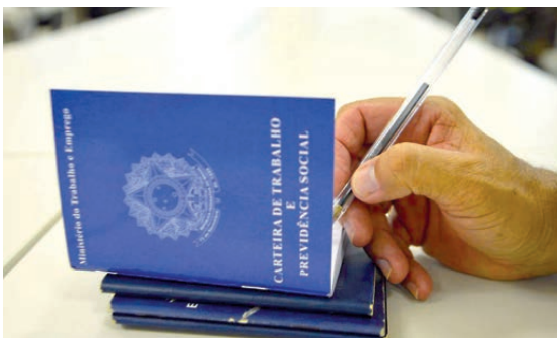
A desigualdade se repete na formalização dos contratos de trabalho

A Secretaria de Segurança Pública do Piauí informou que não comenta dados relativos a pesquisas realizadas por outras instituições e órgãos.