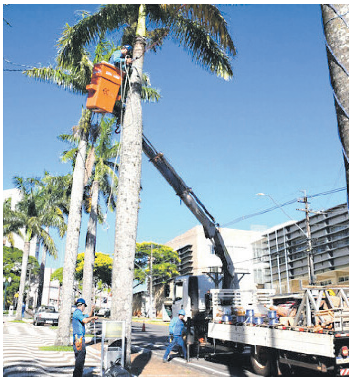
Este ano haverá atividades em três locais: no Lago Aratimbó e nas praças Hênio Romagnolli e Arthur Thomas