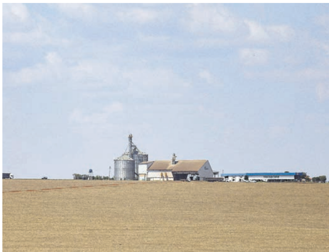
O agronegócio foi um dos responsáveis pela evolução positiva paranaense

O governador Carlos Massa Ratinho Junior ressaltou que o resultado é marcante do ponto de vista histórico e mostra que a economia paranaense suportou a crise provocada pela pandemia, que chegou ao País em março daquele ano. "Alcançamos esse patamar no segundo ano da gestão, após algumas reformas já implementadas, e em um período muito difícil para todos os segmentos