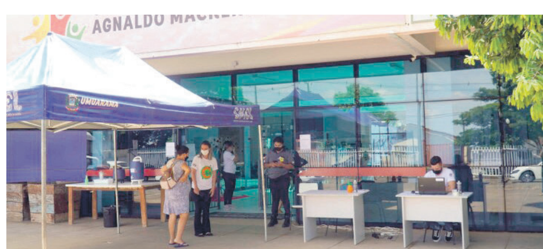
A gincana será desenvolvida no período de 18 a 22 de julho

Umuarama - As escolas estão em período de férias, mas o Centro da Juventude Aginaldo Mackert Barbosa (Ceju) quer manter a gincana ativa. Uma gincana foi preparada para oferecer atividades diferentes, mais recreativas e divertidas, a fim de tirar os usuários da rotina das oficinas, neste período.