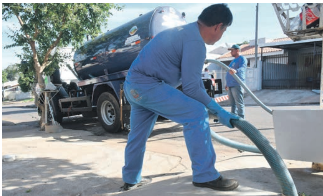
O veículo também poderá auxiliar na desobstrução do esgoto nas vias e na drenagem pluvial

Umuarama - A Prefeitura de Umuarama recebeu recentemente um caminhão limpa-fossa destinado pelo governo do Estado, por meio da Secretaria de Estado do Desenvolvimento Sustentável e do Turismo (Sedest). Com o veículo será possível auxiliar no esgotamento sanitário de comunidades carentes, que ainda não contam com rede de esgotos. Os efluentes serão encaminhados a locais de tratamento e destinação ambientalmente correta.