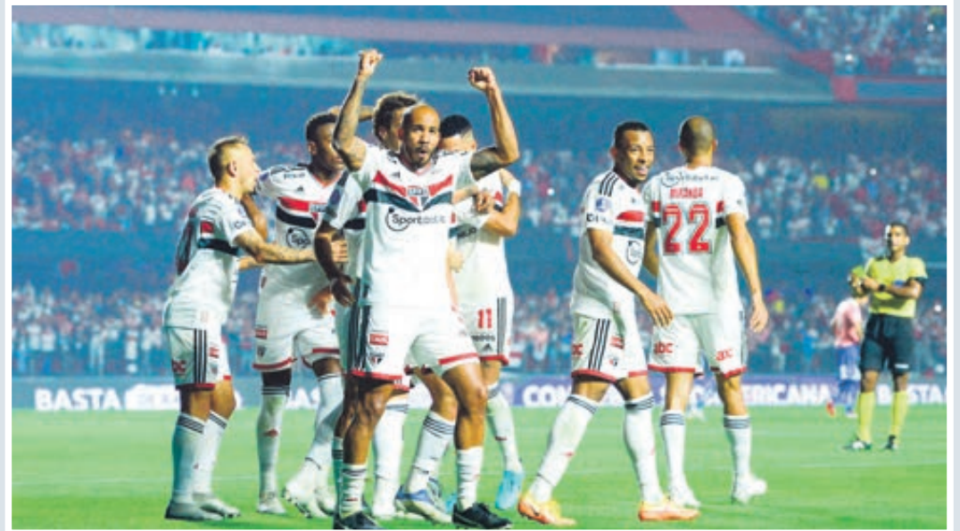
SP EMBALADO CONTRA O FLU - Após eliminar o Palmeiras na Copa do Brasil, o São Paulo vai embalado para cima do Fluminense, neste domingo no Morumbi. E a partida tem também o duelo de dois artilheiros. Página A8