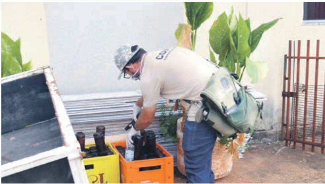
DENGUE AVANÇA EM QUASE TODA UMUARAMA - Das 18 UBS da cidade, 17 enfrentam uma escalada de casos de dengue que deixa a cidade em estado de alerta. Nesta semana mais 42 pessoas tiveram exames positivos. Página A4