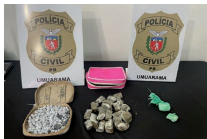
No local foi localizado 174 invólucros de crack, pesando 30,3g; 21 invólucros de maconha, pesando 119,4 g e duas porções de cocaína, pesando 19,6 g

No momento em que os policiais encontravam-se na residência, chegou ao local um adolescente conduzindo uma motocicleta Honda/