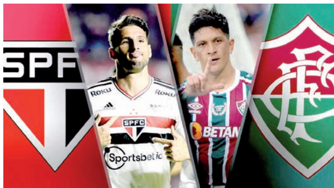
Equipe do São Paulo vai empolgada para o confronto com o Fluminense

Ambos disputaram todos os compromissos de