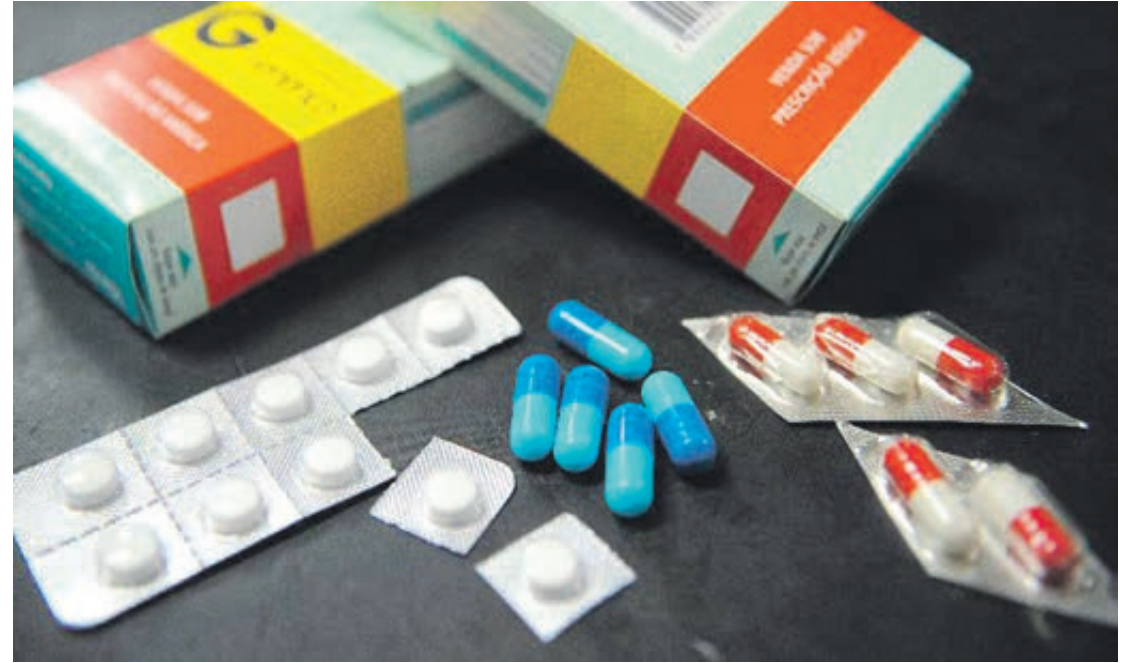
Conforme a CNM, mais de 80,4% dos gestores que responderam à consulta afirmaram sofrer com falta de remédios básicos para atender a população

“Problemas no fornecimento pelo Ministério da Saúde, movimentos de protesto de funcionários em portos e aeroportos, questões envolvendo a política internacional como dificuldades de importação de insumos, por causa da guerra na Ucrânia e do lockdown na China, são alguns dos motivos mais relatados”, informou a CNM no relatório do levantamento.