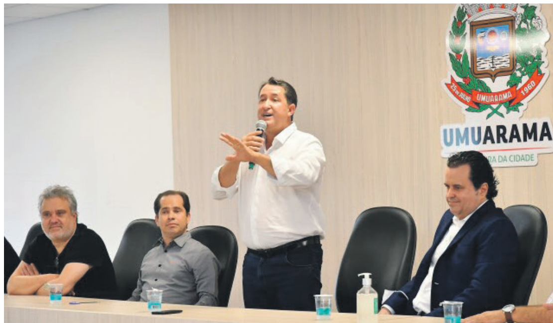
Na última semana a Prefeitura assinou o termo de compromisso com a empresa Fênix Empreendimentos, que é de Umuarama

Agora a empresa vencedora do certame dará o próximo passo com o projeto da ZPE, que será apresentado pelo município e governo do Estado à União, explicando a viabilidade financeira, a capacidade econômica do investidor e como será a gestão administrativa. “Mais adiante serão apresentadas pela Fênix in-