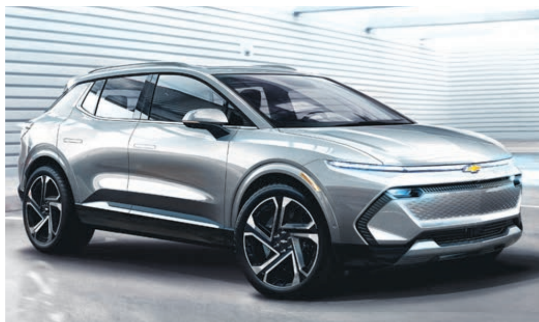
A tendência é que a venda de veículos elétricos e eletrificados continue a crescer também no Brasil

Aqui, o carro elétrico vira uma opção ainda mais sustentável. Mais que o car-