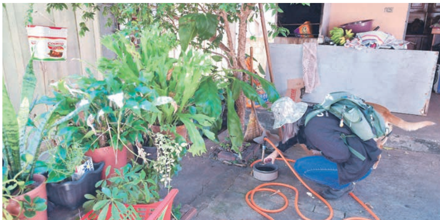
O povoado de Nova Jerusalém e os distritos de Lovat e Santa Eliza também enfrentam surto, enquanto Serra dos Dourados continua com baixa incidência de casos

Nesta semana foram lançadas 280 notificações de suspeita de dengue (já