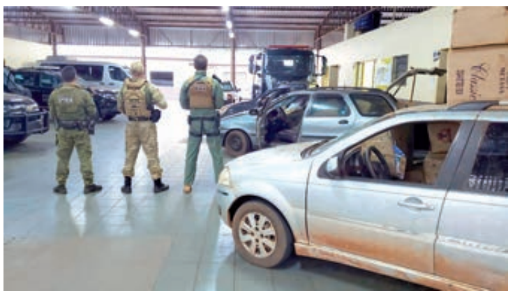
Os veículos, os cigarros e os volumes foram encaminhados para a Receita Federal de Guairá

Na noite de sexta-feira, (15/07), operação integrada entre BPFRO, Polícia Federal e GOA patrulhavam a região de Guairá, quando avistaram quatro veículos, numa área próxima ao rio Paraná. Ao perceberem a presença dos policiais que patrulhavam pela terra e o apoio aérea