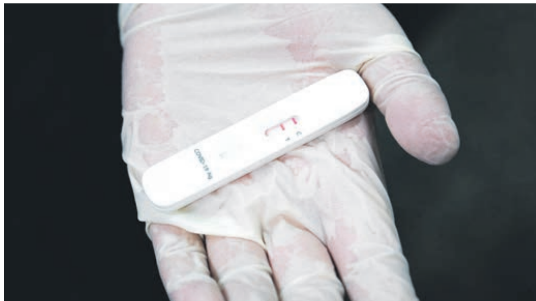
A Abramed aponta que a alta transmissibilidade da variante Ômicron causou aumento exponencial de casos, o que vem demandando significativo aumento da capacidade produtiva global de testes

Nas farmácias que realizam a testagem a procura é ainda maior. Segundo uma farmacêutica - que preferiu não se identificar - na rede em que atua o telefone foi