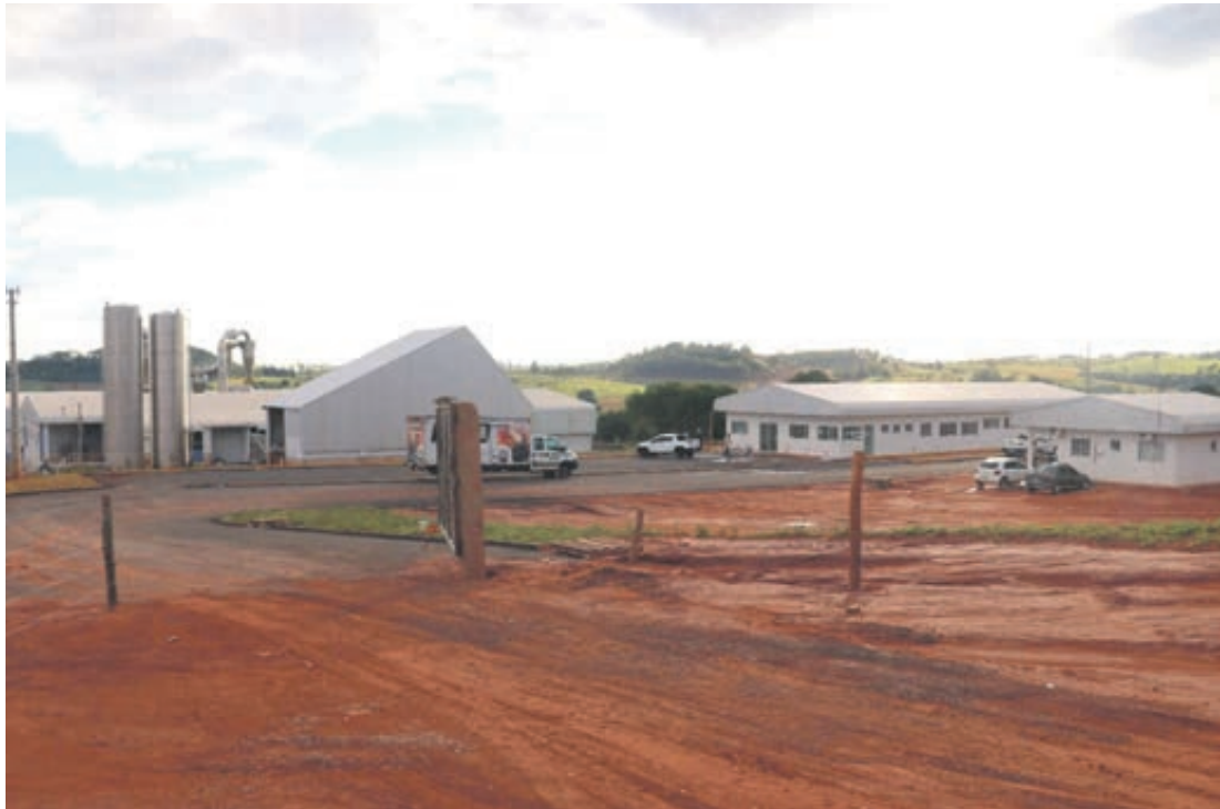
A unidade da Amafil em Pérola começa com a moagem de 300 toneladas de mandioca por dia