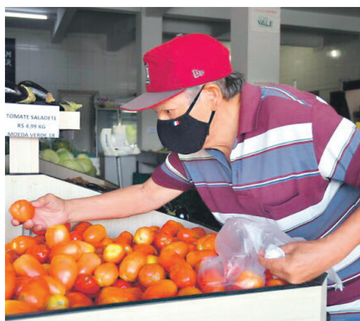
Um dos mais importantes programas de garantia da segurança alimentar das famílias de seis grandes bairros de Umuarama, o Lixo que Vale troca materiais recicláveis por 'moeda verde'