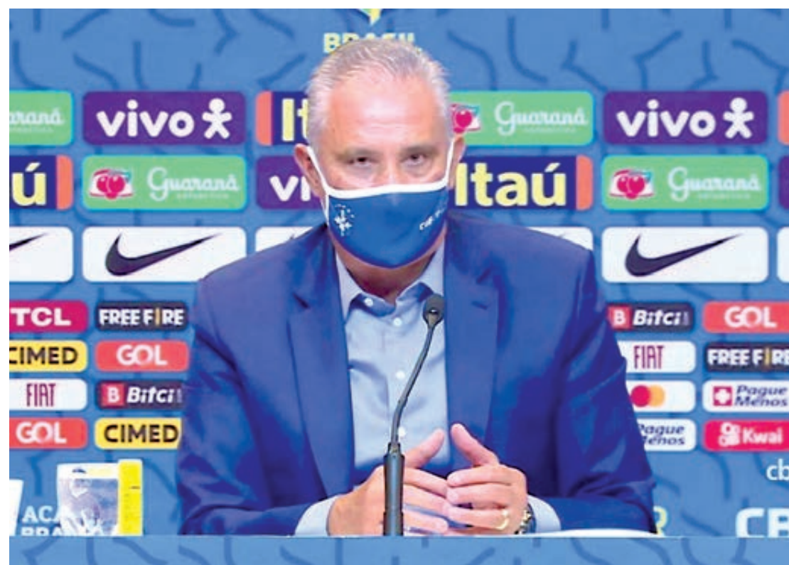
Tite anunciou os 26 convocados nesta quinta-feira que vão representar a seleção brasileira nas Eliminatórias da Copa do Mundo

Neymar não apareceu na lista, mas isso já era esperado. O jogador não atua desde 28 de novembro, quando sofreu uma lesão no tornozelo esquerdo, e a previsão é de que volte a ter condições de jogo justamente às vésperas da partida contra o Equador. O problema é que seu clube, o Paris Saint-Germain, enfrenta o Real Madrid, pelas oitavas de final da Liga dos