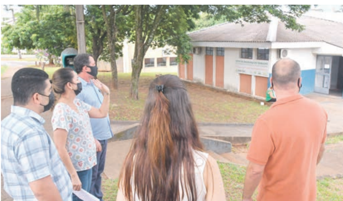
O prefeito já determinou à Secretaria Municipal de Obras, Planejamento Urbano, Projetos Técnicos e Habitação a elaboração do projeto estrutural para construir a edificação, que terá amplo estacionamento e acesso pela Avenida Rio Branco

Inserido em um imóvel com área total de 4.218,75 m 2 , o espaço destina-se à prestação de serviços públicos municipais com cláusula de