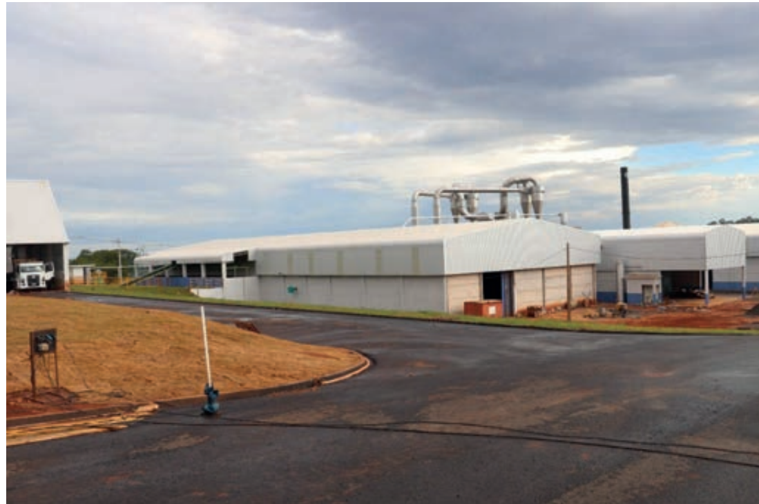
O empreendimento é de mais de R$ 25 milhões e deve gerar até 500 empregos diretos e indiretos para Pérola