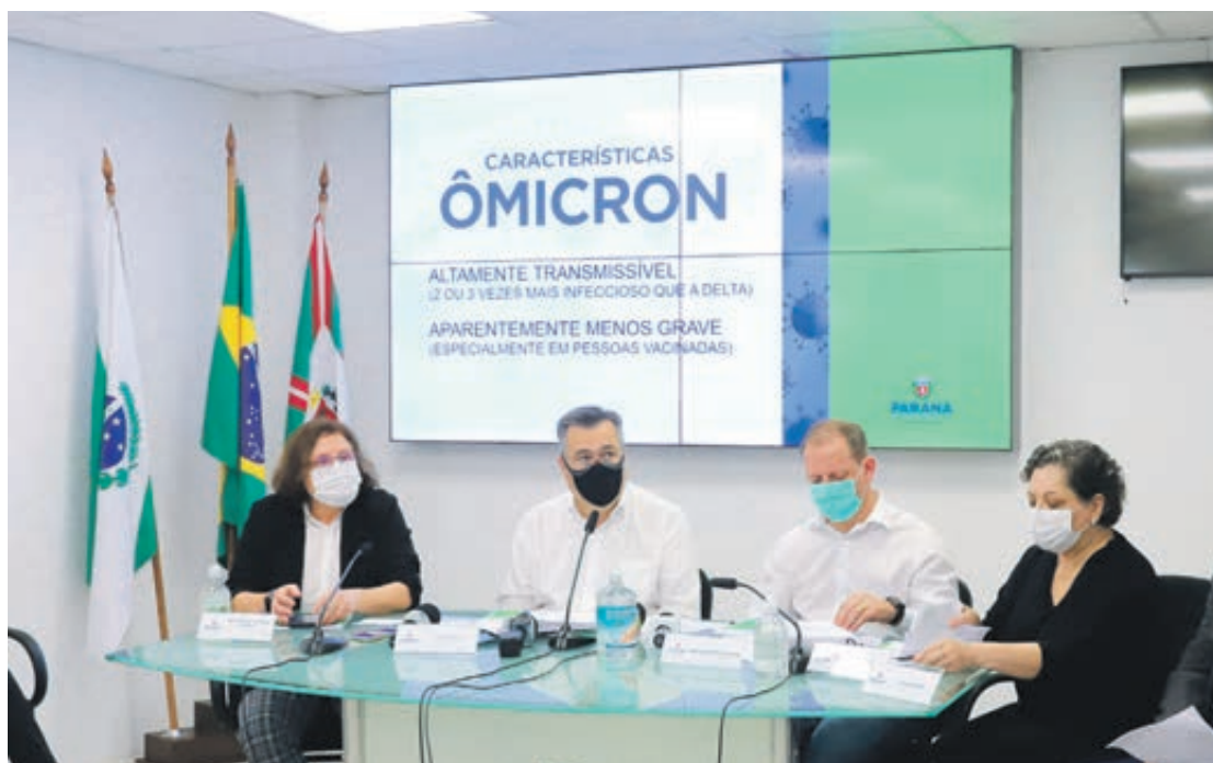
O secretário de Estado da Saúde, Beto Preto, anunciou na manhã desta quarta-feira (12) que o Paraná está em estado de epidemia da gripe Influenza

“Este número de casos e óbitos é o registro que conseguimos da investigação epidemiológica após a detecção da doença pelas unidades sentinela, o que certamente não representa a realidade da doença no Estado. Temos estimativa que este número