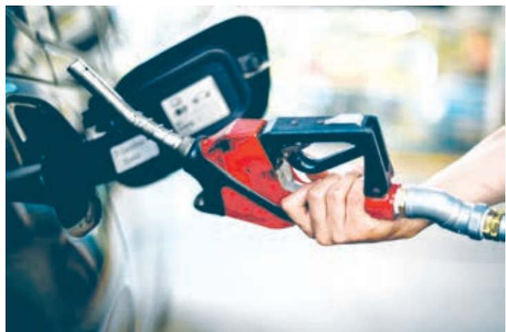
O preço da gasolina em Umuarama custa em média R$ 6,57 e tem variação de 3,4% entre os postos consultados

Umuarama - O preço da gasolina em Umuarama custa em média R$ 6,57 e tem variação de 3,4% entre os postos consultados. Os números são informados pelo Procon de Umuarama (Secretaria Municipal de Proteção e Defesa do Consumidor), que realiza pesquisas mensais sobre combustíveis na cidade. O preço mais barato foi encontrado a R$ 6,47 e o mais caro a R$ 6,69.