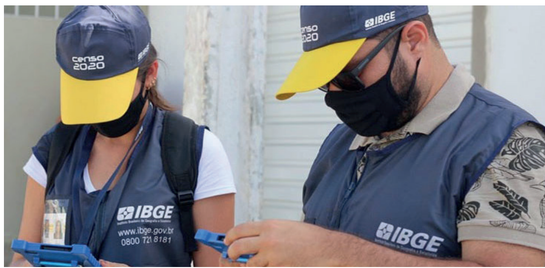
A taxa de inscrição para recenseador é de R$ 57,50, e de R$ 60,50 para agente censitário, e pode ser paga até 16 de fevereiro

Há ainda 1.373 vagas de agente censitário supervisor (ACS) e de agente censitário municipal (ACM), ambas de nível médio. Os salários são de R$ 1.700 e R$ 2.100, respectivamente. O ACM gerencia o trabalho do posto de coleta, enquanto o ACS, subordinado ao ACM, tem como principal função