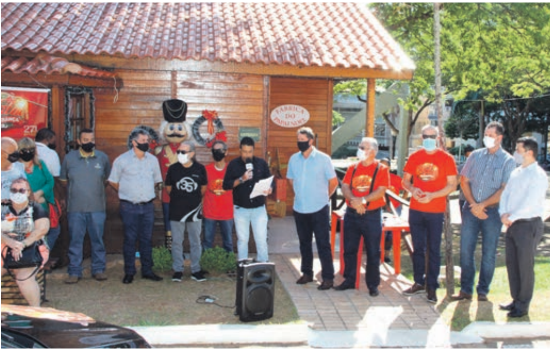
A entrega de três automóveis e cinco motos, na manhã de ontem na praça Hênio Romagnoli, encerrou oficialmente a campanha Natal de Esperança Acui 2021