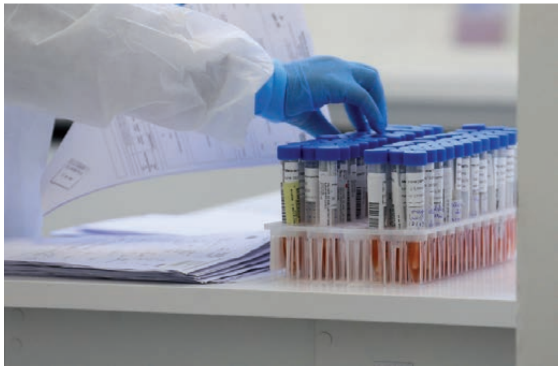
Os casos ativos subiram de 180 para 412 – um aumento de 129% –, já o número de suspeitos caiu de 494 para 466

Sobre a questão de a cidade continuar classificada com 'Bandeira Verde' pela Sesa (Secretaria de Estado da Saúde), mesmo com aumento tão significativo