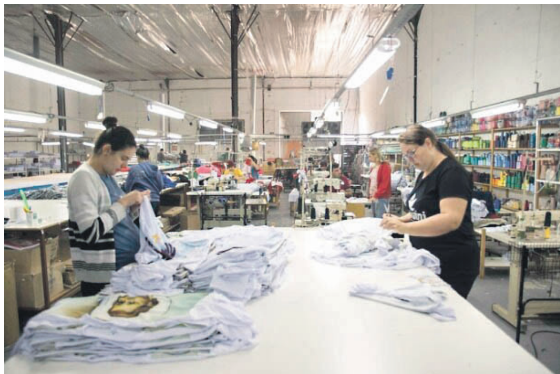
Umuarama colocou 219 profissionais no mercado de trabalho formal, o que garante à cidade o 4º lugar no ranking das que mais empregaram.

Barros comenta também que estar entre os 10 municípios que mais empregam é algo realmente a ser comemorado, pois coloca Umuarama em lugar de destaque no Paraná. “Ficamos à frente