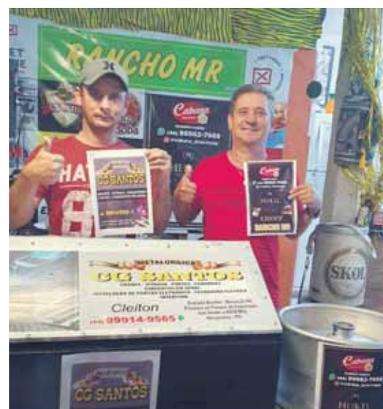
Dupla campeã do ranking anual do truco no MR