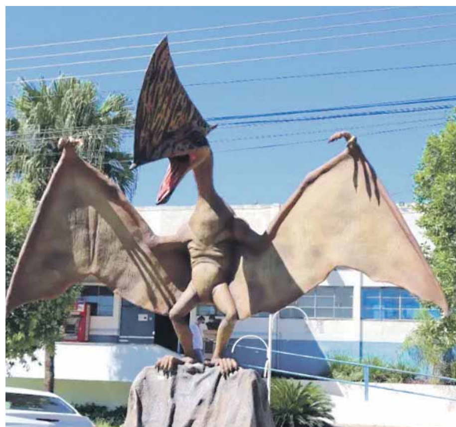
A Prefeitura também incentiva a divulgação dos pterossauros pela cidade e região

O Sítio Paleontológico de Cruzeiro do Oeste apresenta um diferencial