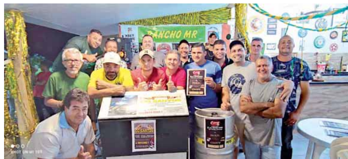
Campeões e demais participantes do truco no Rancho MR

E vem aí, mais um campeonato de futebol suíço time do coração Rancho MR, 6 equipes confirma-