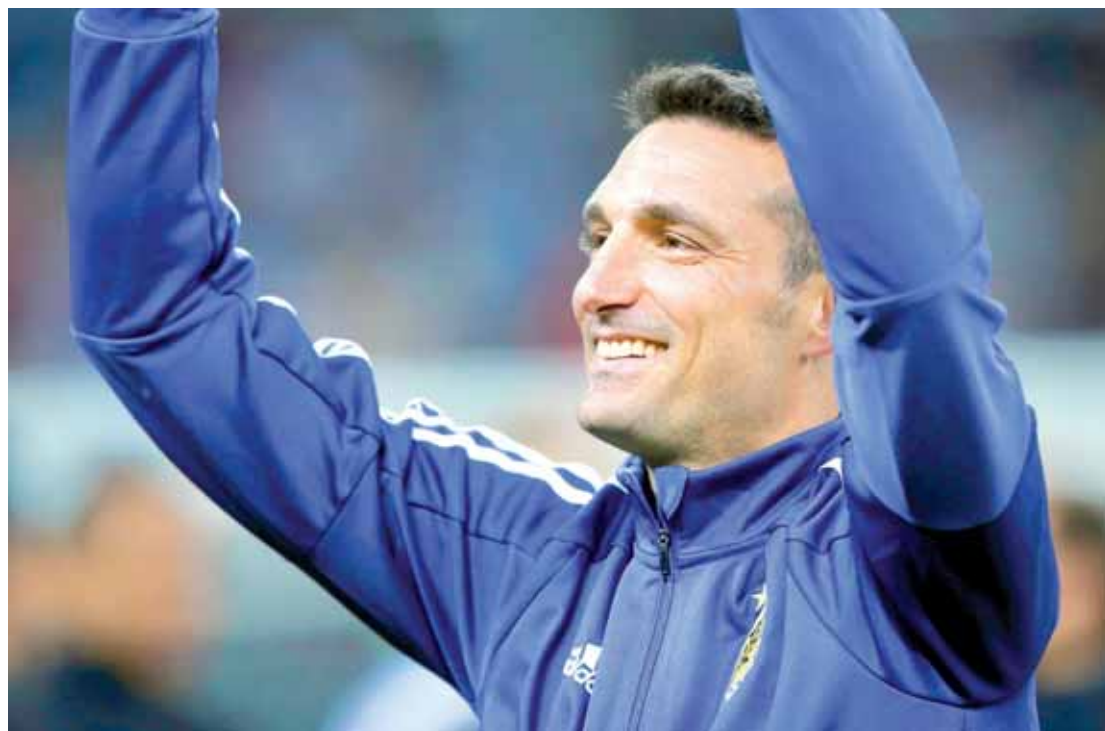
O técnico da seleção argentina, Lionel Scaloni

Em suas redes sociais, o treinador usou uma foto da multidão cercando o ônibus da delegação para mostrar o respeito e a gratidão para com os argentinos. "Vocês foram