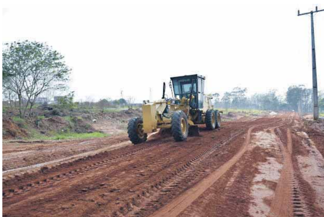
O objetivo do investimento é equipar melhor o pátio de máquinas para atender toda a demanda de serviços

O aviso do pregão eletrônico com maiores detalhes foi publicado nesta quinta-feira, 22, no diário oficial do município. Os veículos e implementos serão colocados à disposição da Secretaria de Serviços Rodoviários, podendo atender também