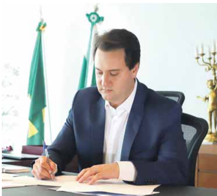
Governador promove mudanças na equipe

Nesta quarta-feira (21) foi anunciado o primeiro nome, na Secretaria Segurança Pública do Estado: o coronel Hudson Leônico Teixeira, que até então era comandante-geral da Polícia Militar do Paraná (PMPR). Nesta quinta também foi confirmado