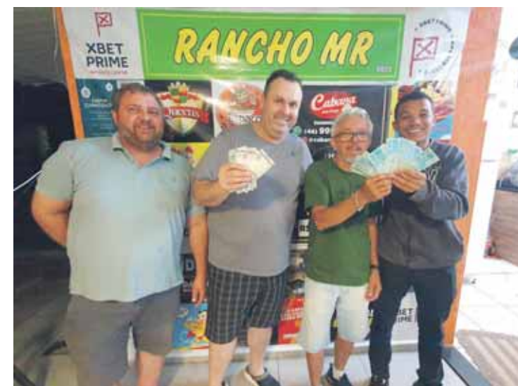
Destaque do truco no Rancho MR

A diretoria agradece aos apoiadores UNIPAR, Chopp Cabana Heikel, Black Horse Jeans, Fenix Byte informática, AM Bolsas, Protecon, Sorverterias Itália Gelato Praça anchieta, Alexandre Esportes, Umuarama Ilustrado, Lider Funilaria e Pinturas Multi Marcas, Distribuidora de Frios Nutry Queijo, Metalúrgica C. G. Santos, Madesul, Ribeiro Tur locação de vans, Galles Delivery cone de pizza, Espaço Yakisoba no trailer Umuarama, O Chefim Hamburgueria e Choperia, Virtual Es-