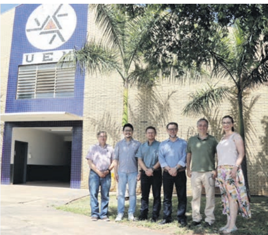
PESQUISA NA UEM - A unidade da UEM em Umuarama fechou parceria para pesquisar o biofertilizante orgânico e vegano, sem nada de origem animal. É um produto à base de óleos essenciais. Página A4