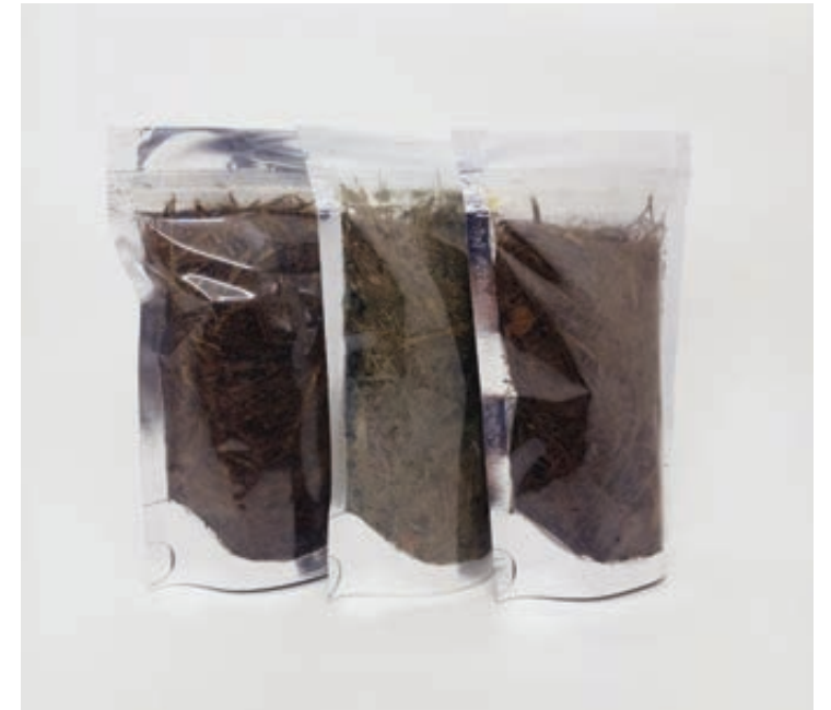
O material vegetal residual da extração dos óleos essenciais se transforma em biofertilizante

Na composição do biofertilizante são agregados produtos vegetais de demais produtores rurais da região de Querência do Norte, explicou Maurício Garcia. Desta forma um subproduto que não é utilizado ou é descartado pelo pequeno produtor, a ideia é fazer uma parceria e agregar