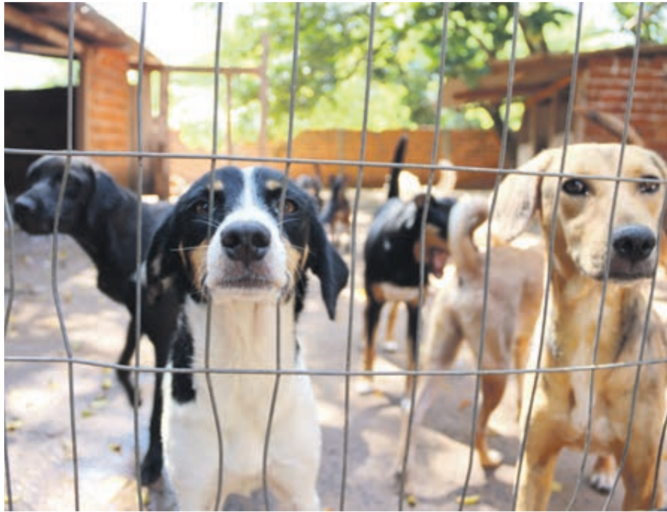
Quem maltrata ou matar animais é enquadrado no art. 32 da Lei 9.605/98 se houver flagrante, o agressor é levado para a prisão.

Quem maltrata os animais é enquadrado no art. 32 da Lei 9.605/98. Antes da modificação, os autores tinham que cumprir pena de detenção, de três meses a um ano, além de multa. A partir de 2020, o criminoso