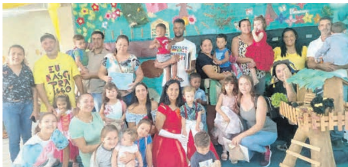
Projeto pequenos leitores fez sucesso na escola

Os alunos contemplados pelo projeto construíram um livro de história coletivo, fizeram a releitura das