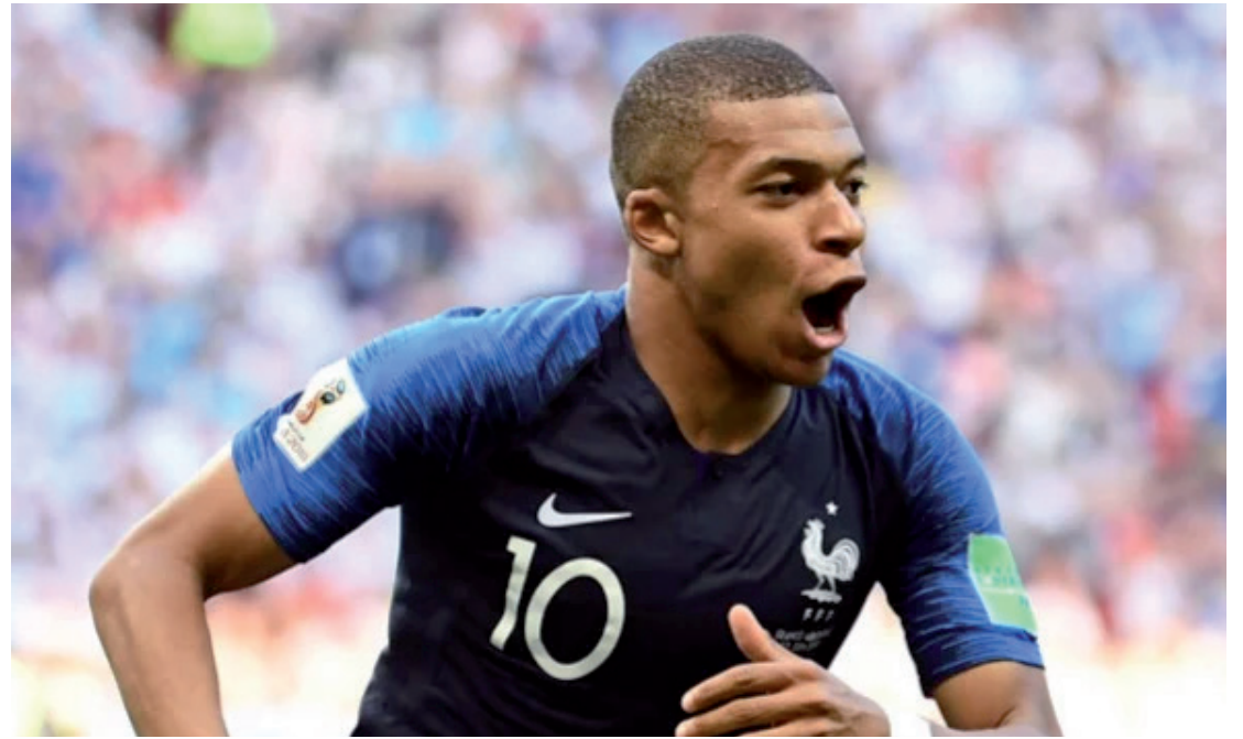
Pela França, o craque Mbappé pode fazer a diferença