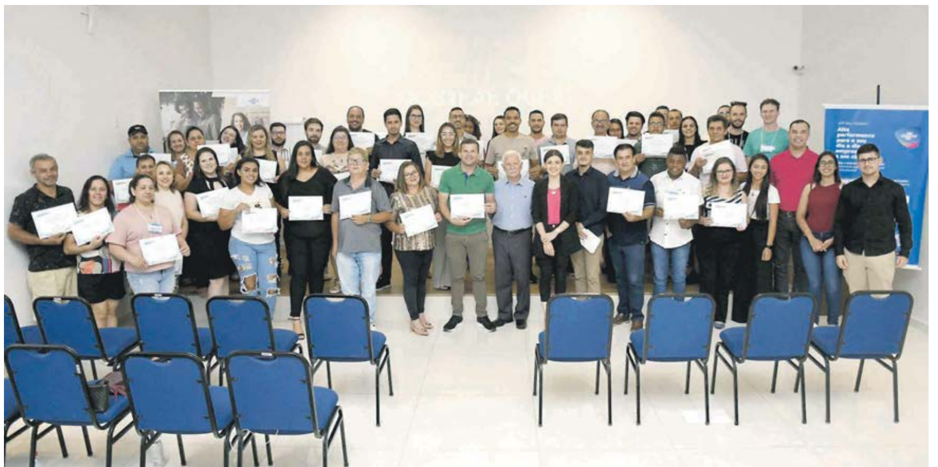
Empreendedores recebendo certificado de curso