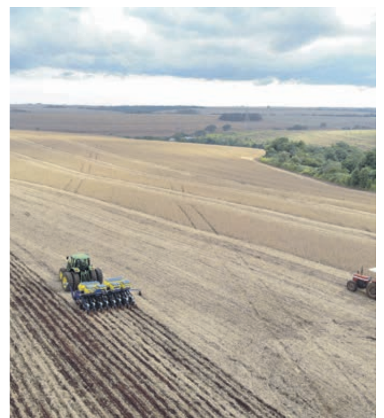
O resultado pode ser explicado, em parte, pelo aumento dos investimentos no ramo agroindustrial

A oferta de crédito com juros zero para melhorias das propriedades rurais, via Banco do Agricultor, a instalação de mais de 10 mil quilômetros de redes trifásicas (Paraná Trifásico), ampliando o potencial de produção da agroindústria, e a pavimentação de mil quilômetros de estradas rurais, que facilitam o escoamento da safra, são outros exemplos de ações que contribuí-