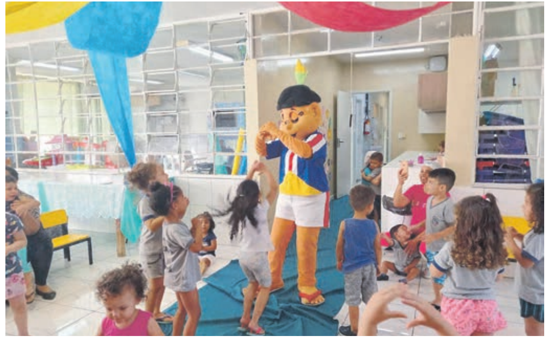
PEQUENOS LEITORES - O CMEI Maria Arlete, de Umuarama, concluiu na semana que passou o projeto "Pequenos Leitores" compartilhando saberes e aventuras. Página A7