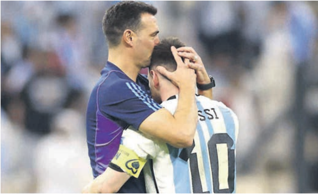
Messi é a maior esperança da Argentina para levar a taça