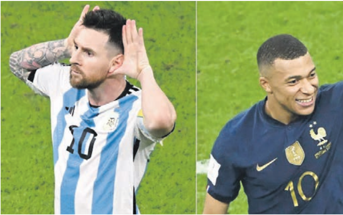
OS MELHORES DO MUNDO - De um lado Messi, do outro Mbappé. Os dois craques podem ser os protagonistas da final da Copa do Catar neste domingo ao meio dia. Página A8