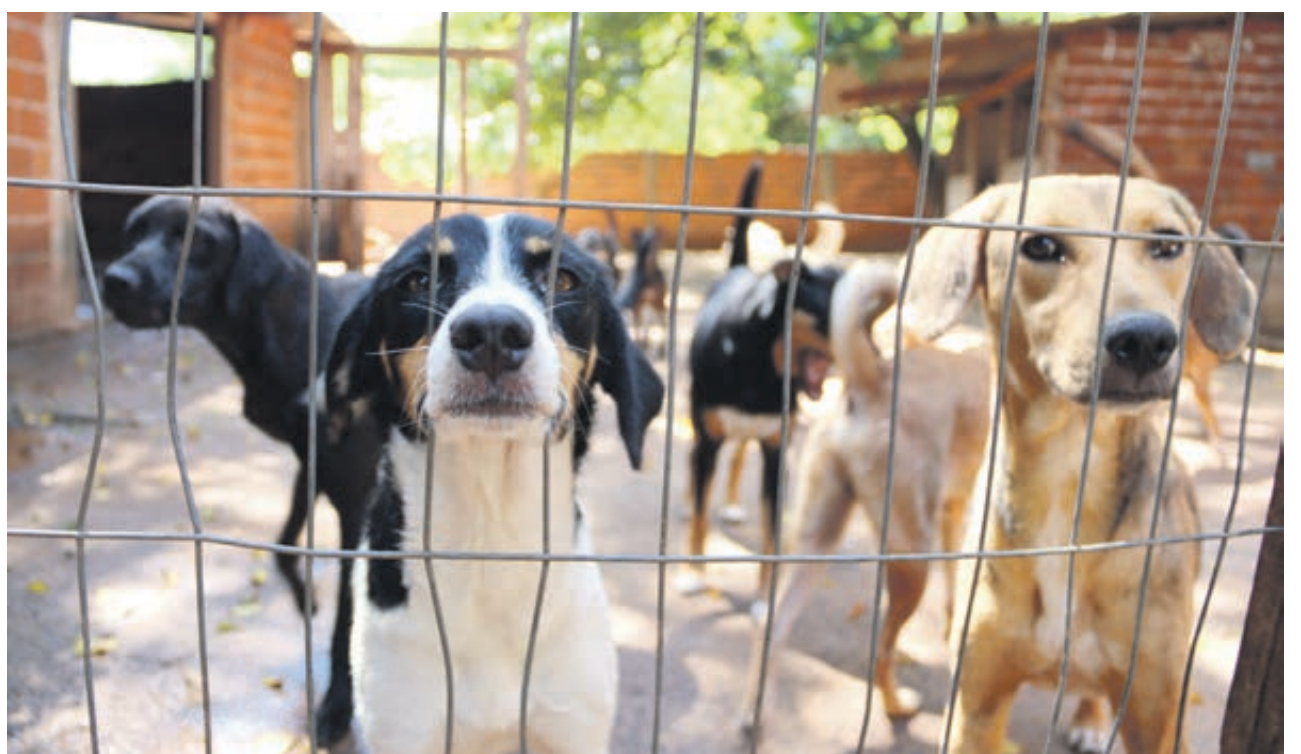
ENVENENAMENTO ASSUSTA EM UMUARAMA - O caso de uma idosa flagrada por câmeras de segurança possivelmente envenenando duas cachorras no Parque das Jaboticabeiras, em Umuarama, comoveu e foi notícia nacional. Saau alerta para o crime cometido. Página A5