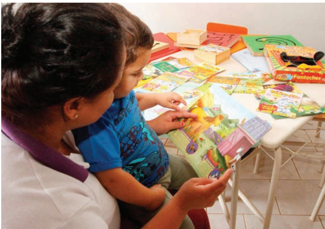
As ações são executadas pelos municípios que contam com a orientação técnica da Secretaria estadual da Justiça, Família e Trabalho (Sejuf)

"Esse trabalho não é apenas mérito da Secretaria,