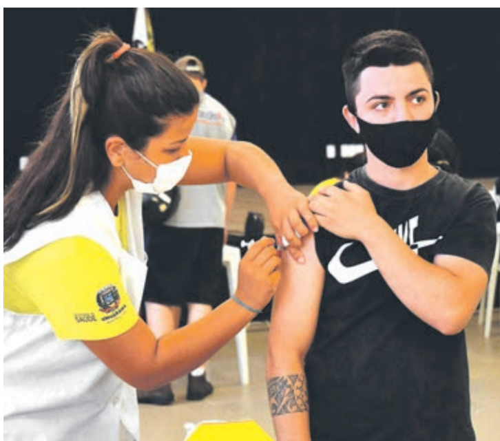
Na segunda-feira (13) aproximadamente 2 mil umuaramenses receberam a vacina D1

A Secretaria Municipal de Saúde apresentou