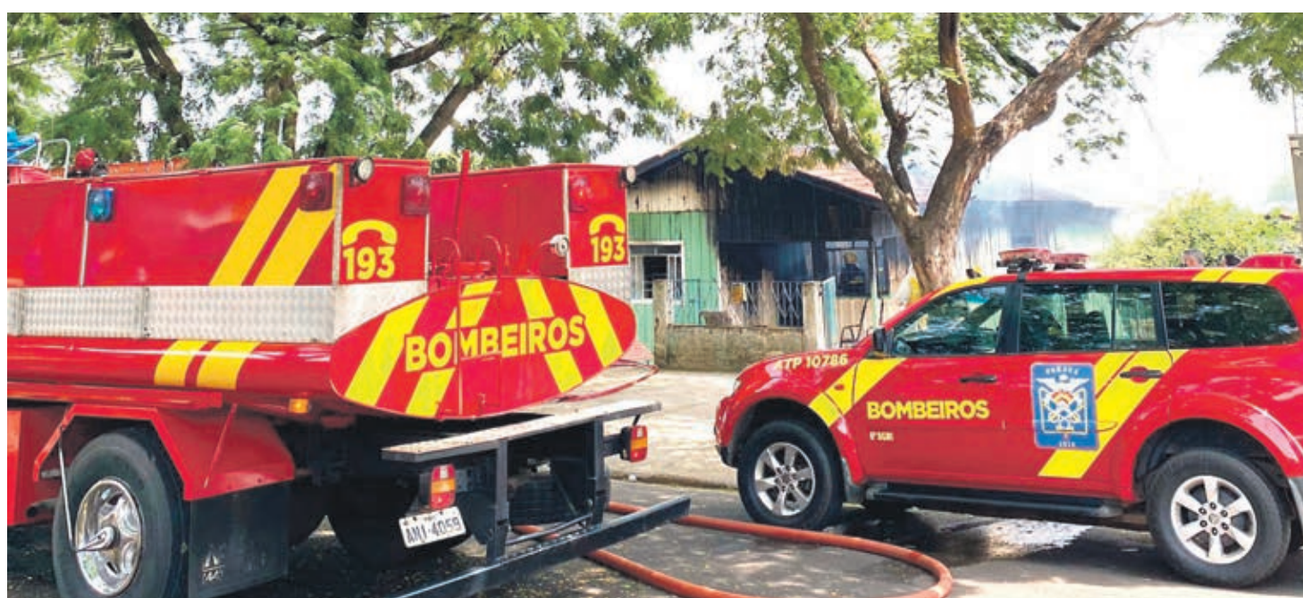
FOGO DESTRÓI CASA DE MADEIRA EM UMUARAMA - Uma casa de madeira foi atingida por incêndio ontem perto do meio dia em Umuarama. Os Bombeiros agiram rápido e evitaram destruição maior. Aparentemente, o fogo teria começado pela cozinha devido a um vazamento de gás. E foi bem no momento em que a moradora preparava o almoço da família. Ninguém ficou ferido. Página A6