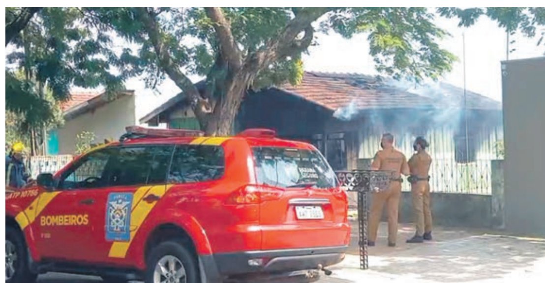
Três caminhões do Corpo de Bombeiros de Umuarama foram utilizados para conter o fogo

Três caminhões do Corpo de Bombeiros foram utilizados para conter o fogo, mas devido a estrutura de madeira as chamas se alastraram rapida-