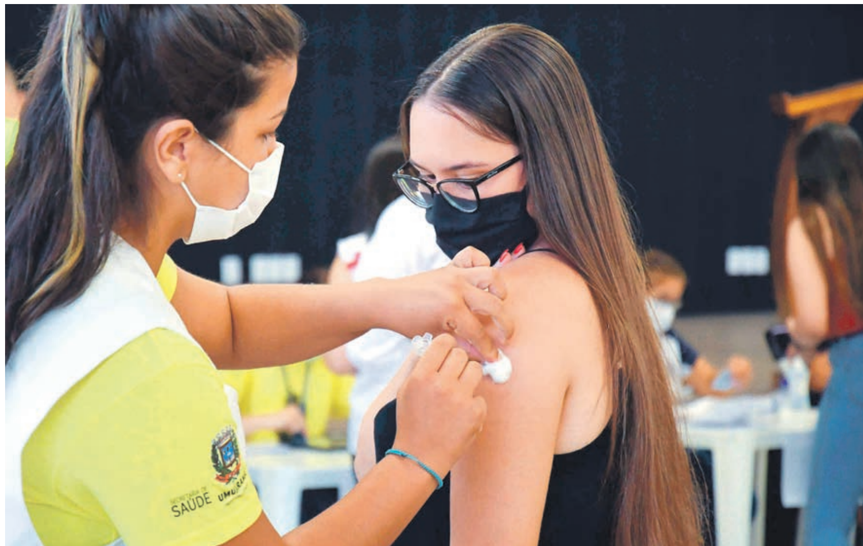
Ontem as primeiras doses foram aplicadas nas pessoas com 20 anos ou mais.

Em Umuarama não haverá vacinação contra o coronavírus para primeira dose nesta terça-feira, segundo informa a Secretaria Municipal de Saúde. Nesta segunda-feira aproximadamente duas mil pessoas receberam a primeira dose da vacina. A Prefeitura garante que a imunização para as segundas doses voltará normalmente amanhã, com vacinas da AstraZeneca, Pfizer e CoronaVac. E o Governo do Estado anunciou o envio de mais vacinas para a primeira dose. Página A3