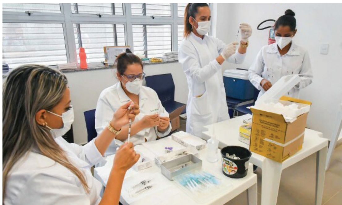
Com avançando em Umuarama número de notificação de casos de covid-19 cai

O comportamento epidemiológico do vírus Sars-CoV-2 é acompanhado em Umuarama pelo COE (Centro de Operações de Enfrentamento ao Coronavírus). Uma boa notícia