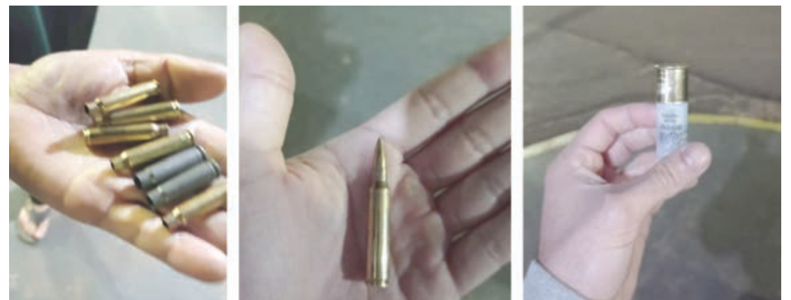
Peritos encontraram cápsulas de fuzil 5,56, de espingarda calibre 12 mm e restos de explosivos

A forma como o bando atacou agência do Banco Itaú de Mariluz, segue os moldes das ações da quadrilha Novo Cangaço e que recentemente teve atuação em Araçatuba, interior paulista, quando ao menos três pessoas foram mortas e quatro ficaram feridas. A expressão do “Novo Cangaço” apareceu nos anos 1990, em referência a assaltos praticados em municípios nordestinos. Ganhou repercussão após gangues altamente