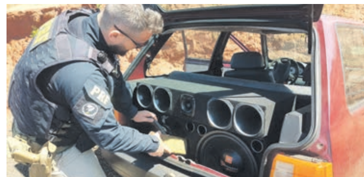
Após perseguir um Fiat Uno em alta velocidade, a Polícia Rodoviária Federal (PRF) prendeu dois homens transportando 32 quilos de maconha

Os policiais rodoviários federais deram ordem de parada ao veículo suspeito na BR-487 por volta das 12h. O motorista fugiu em alta velocidade, muito acima da permitida para a via, que é de 80 Km/h. Segundo nota da PRF, durante a fuga o homem