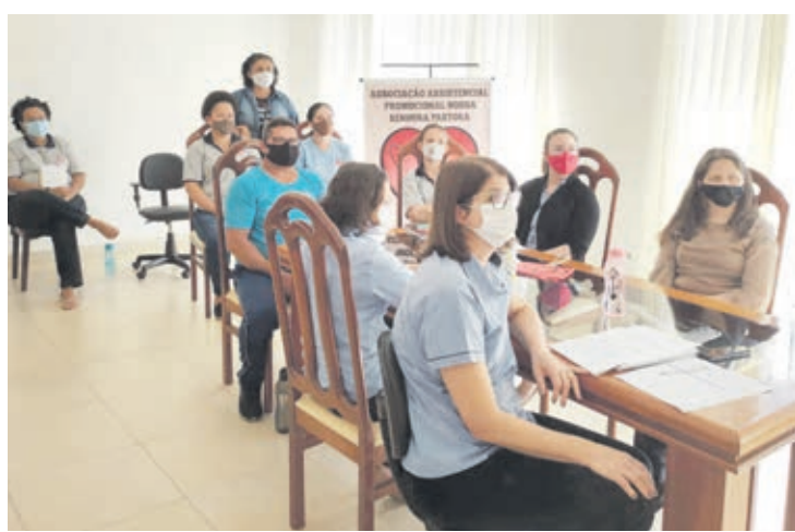
A conferência envolveu profissionais de diversas instituições

As conferências servem para avaliar a política de assistência social e definir diretrizes para o atendimento dos interesses sociais e aspirações da população em situação de risco social e aprimoramento do Siste-