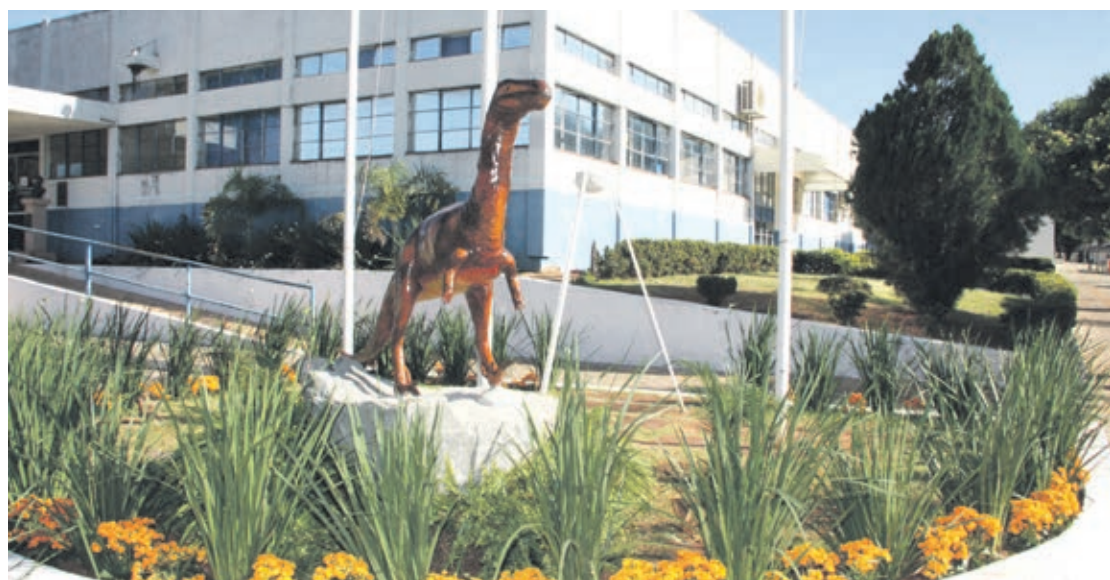
Cidade de Cruzeiro perde cerca de R$ 3,5 milhões ao ano para investimentos devido aos números baixos do IBGE

Conforme Brandani, a administração municipal acredita que o número de habitantes de Cruzeiro do Oeste, atualmente, é bem maior. Isso porque nos últimos anos a cidade recebeu a Penitenciária