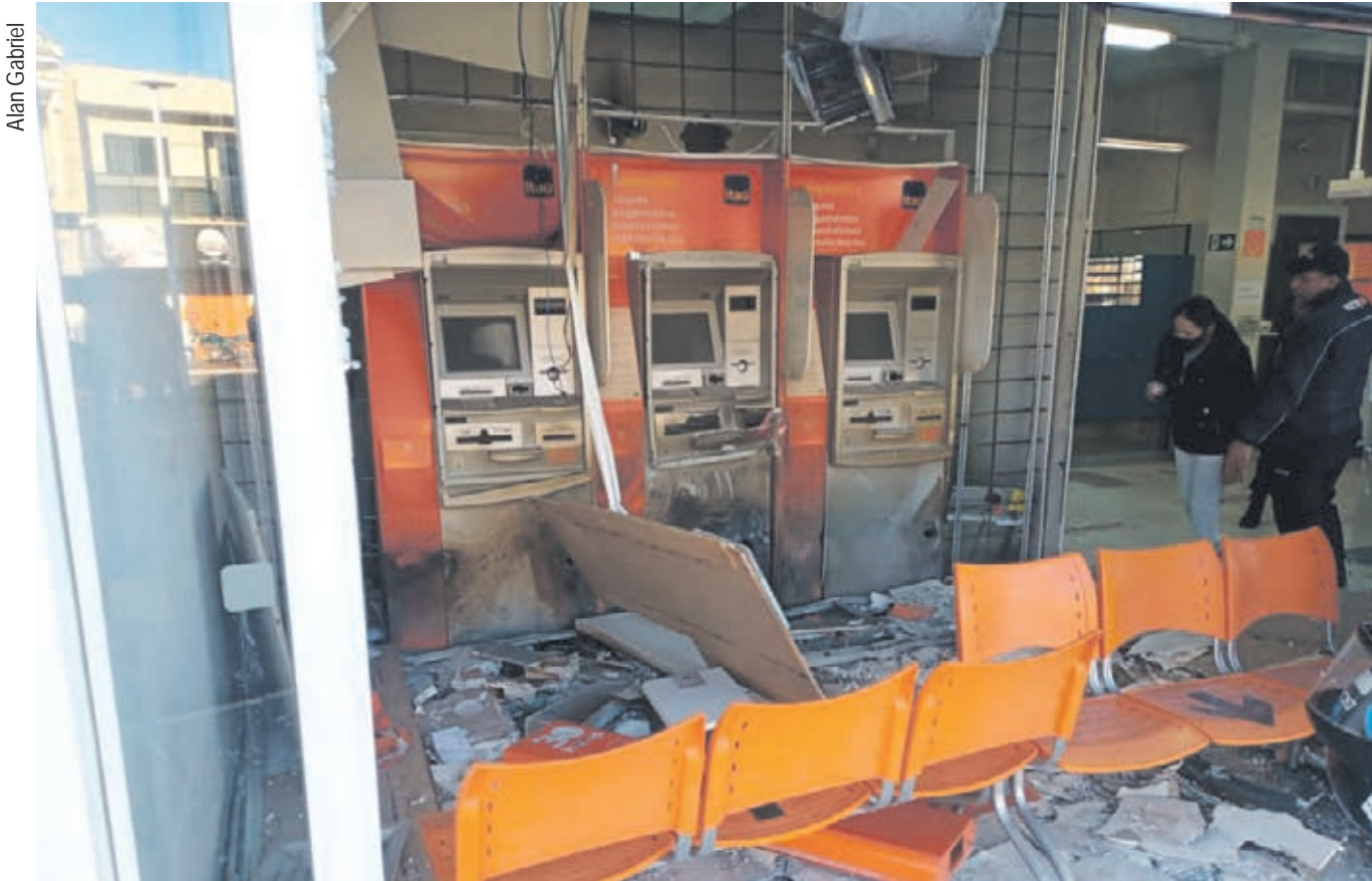
As caixas eletrônicas da agência ficaram totalmente destruídas pela ação dos marginais na madrugada

Testemunhas contaram que era por volta das 3 horas da madrugada de ontem quando um bando fortemente armado chegou na agência do banco Itau e em poucos minutos explodiram a caixa eletrônica para roubar o dinheiro e fugiram atirando pela cidade. Ninguém ficou ferido. Os disparos ainda acertaram vidraças da Prefeitura e da Câmara Municipal. Um dos dois carros usados pela quadrilha foi encontrado abandonado perto de Goioerê. Os bandidos não foram identificados nem presos. Página A6