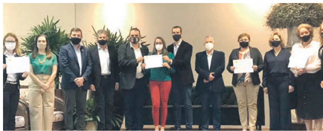
Xambrê recebeu o certificado do IDEB entregue pelo secretário estadual da Educação, Renato Feder

O IDEB é um indicador criado pelo governo federal para medir a qualidade do ensino nas escolas públicas, sendo aplicado do 5º ano do Ensino Fundamental séries iniciais, 9º ano séries finais e no Ensino Médio. Atualmente o Brasil declara a média de nota 5,7 nos anos iniciais sendo que o município de Xambrê alcançou, em 2019, o resultado de 7,2 no Ensino