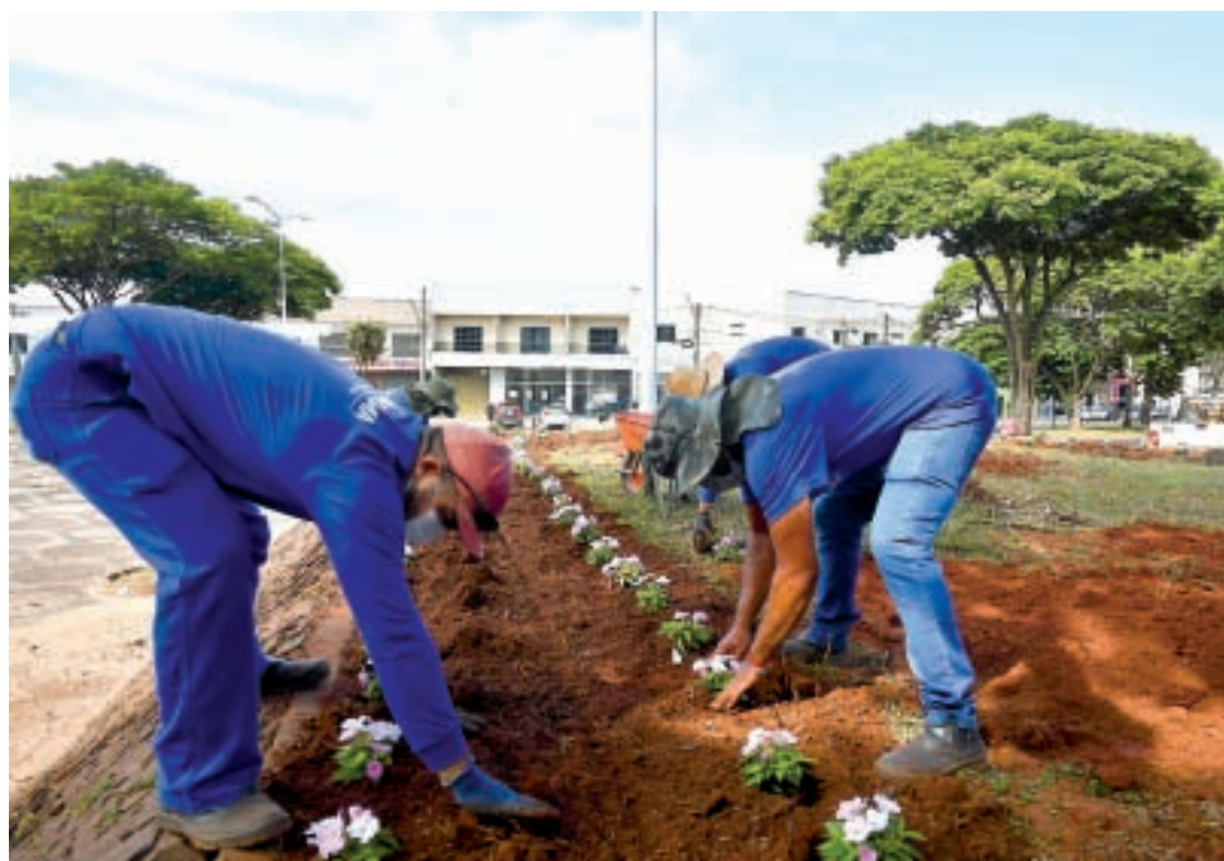
Equipes da Prefeitura estão trabalhando em todos os cantos do município

Nas áreas de indústria, comércio e turismo vários projetos avançaram, como a reforma e ampliação do Aeroporto Regional Orlando de Carvalho, a criação de espaços para parques industriais, estímulo ao empreendedorismo por meio da Casa do Empreendedor, atração de grandes indústrias, atacadistas e fortalecimento do comércio, que resultaram em geração recorde de empregos apesar da pandemia, com intermediação da Agência do Trabalhador.