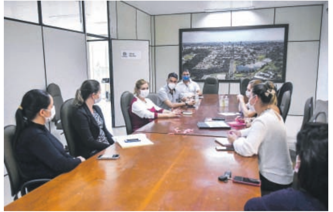
A ampliação da idade e outros assuntos foram definidos nesta reunião

Não haverá vacinação para grupos prioritários neste sábado, e nem aplicação em sistema de drive thru – apenas para as pessoas que se colocarem