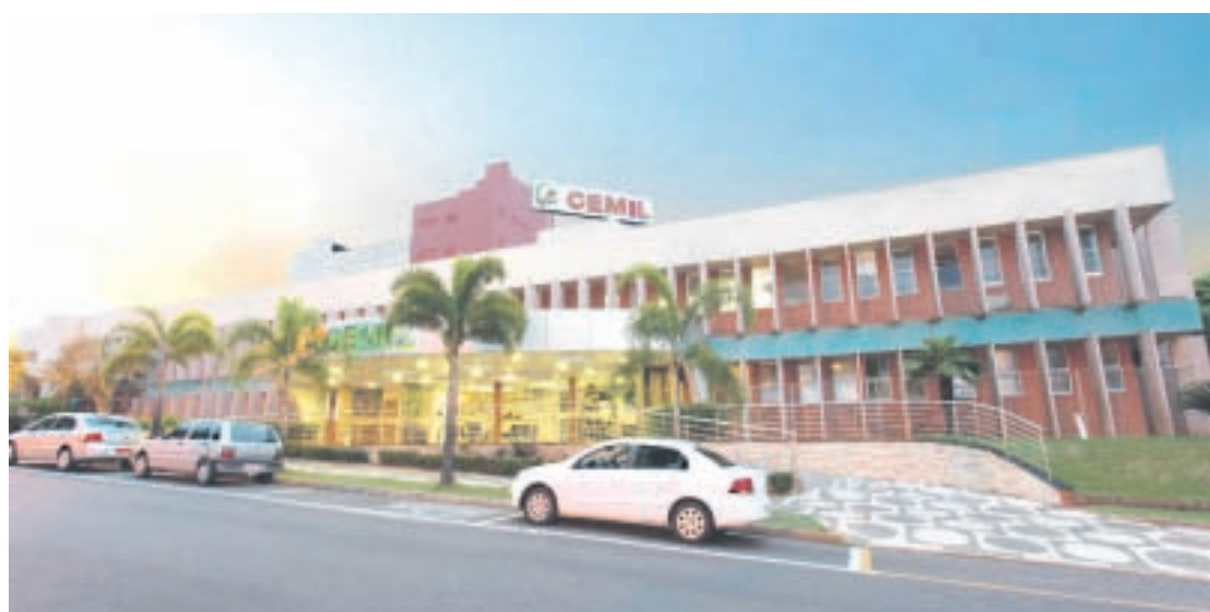
Balões vão sair do Cemil e colorir os céus de Umuarama

“A elevada taxa de sucesso nos tratamentos é