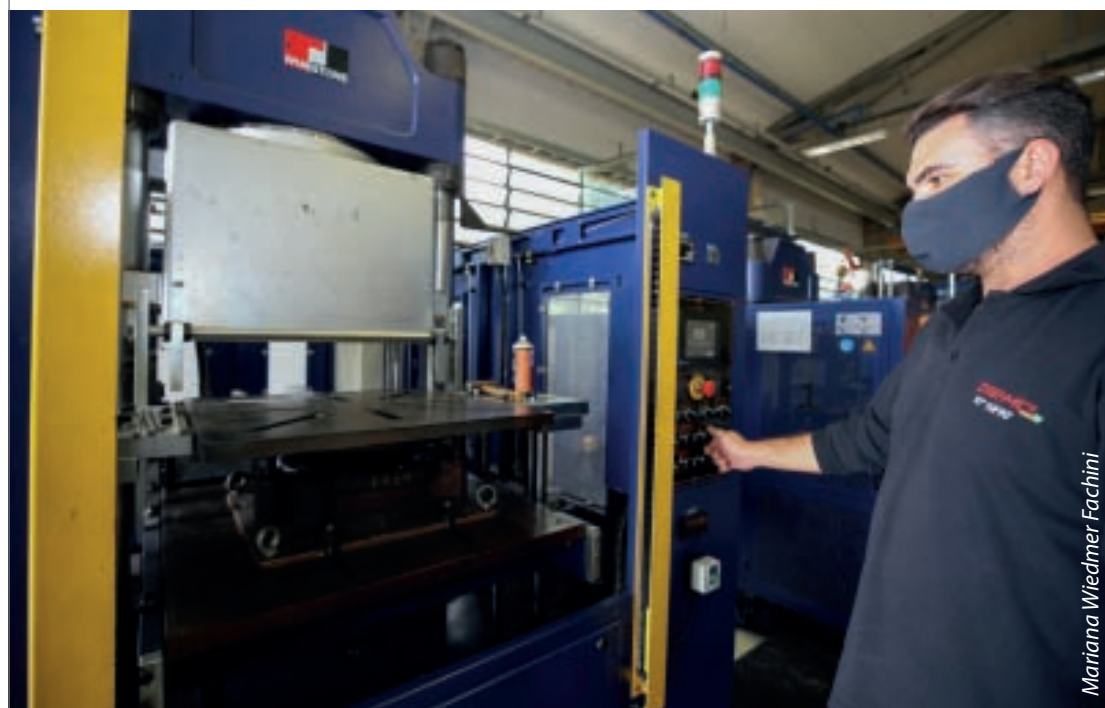
Plataforma comercializa produtos de diferentes fabricantes, facilitando acesso de revendedores e consumidores

Inscrições para a edição de 2021 - As inscrições podem ser feitas no site senaipr.com.br/brasilmais ou pelo e-mail brasilmaispr@sistemafiep.org.br .