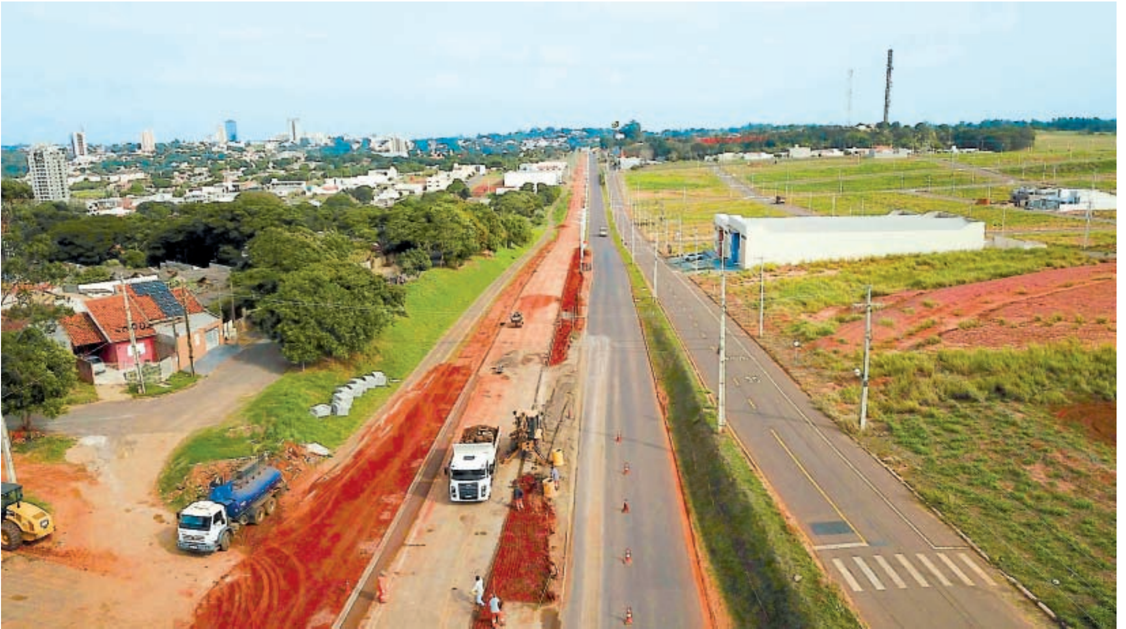
Obras estruturantes estão por todos os lados de Umuarama