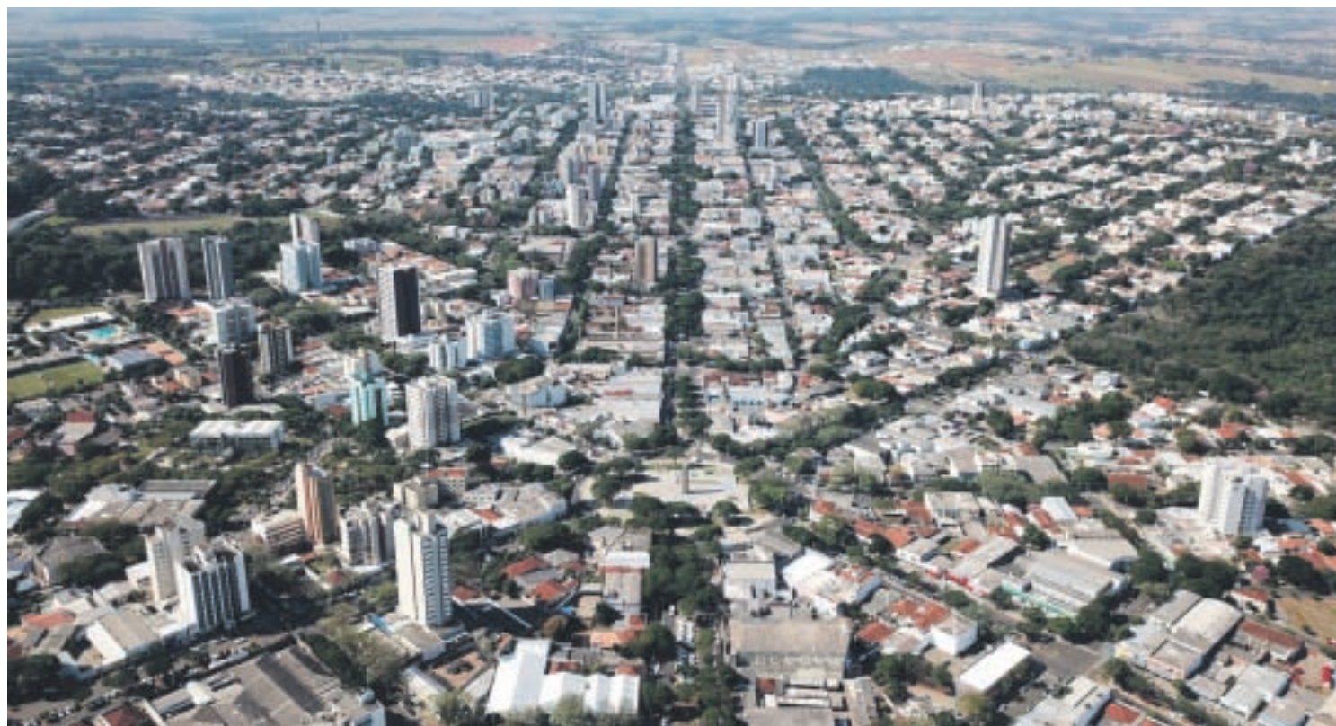
Com projeção do Instituto Brasileiro de Geografia e Estatística (IBGE) para 112.500 umuaramenses em 2021, Umuarama cravou o status de cidade de médio porte

“Em 2010 o Censo mostrava Umuarama com 100 mil habitantes e hoje a estimativa está em 112.500 umuaramenses. Tivemos um crescimento de 12% e por qual motivo essas pessoas vieram para Umuarama? Desta forma, de primeiro plano, vamos focar no Índice de Desenvolvimento Humano (IDH) e considerar os fatores da renda, saúde