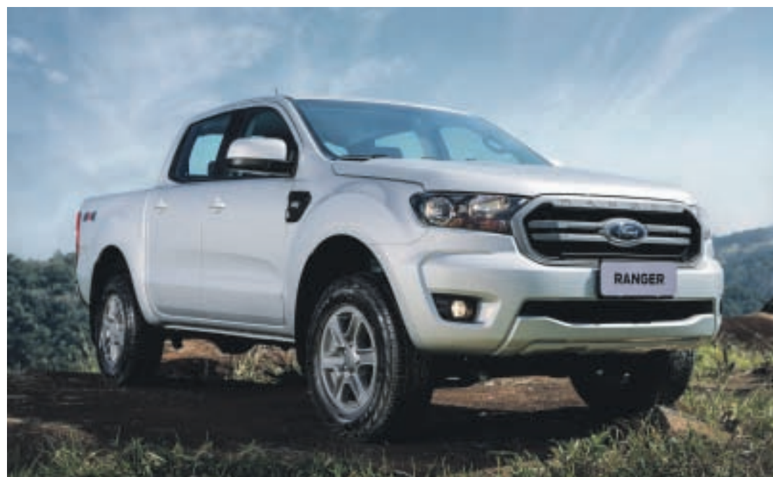
Ford Go oferece todas as versões da Ranger (XLS, XLT, Limited, Storm e a nova Black), além do Territory (SEL e Titanium),

Vinicius Manoel, um dos primeiros clientes do FORD GO em Brasília, destaca a conveniência. “Nossa experiência com o FORD GO foi muito boa. A contratação foi muito fácil, fizemos tudo pela internet. A gente fica livre das burocracias do dia a dia e está tudo incluso numa única mensalidade. Estamos muito contentes aqui em casa com nosso carro zero quilômetro.”