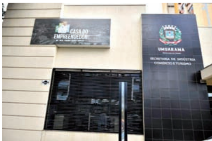
As compras da Prefeitura de Umuarama junto a fornecedores locais têm aumentado progressivamente nos últimos anos