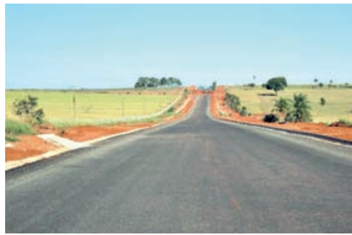
A pavimentação da Boiadeira já ocorre entre Icaraíma e Santa Eliza

O governador Carlos Massa Ratinho Junior enviou convite ontem para a cerimônia de lançamento de nova etapa das obras de pavimentação asfáltica da rodovia BR-487, a Estrada Boiadeira, entre Santa Eliza e Serra dos Dourados, em Umuarama. Será nesta sexta-feira, a partir das 10 horas no distrito de Santa Eliza. Mas avisou que, em conformidade com o decreto 6294/2020 a cerimônia será restrita às autoridades convidadas.