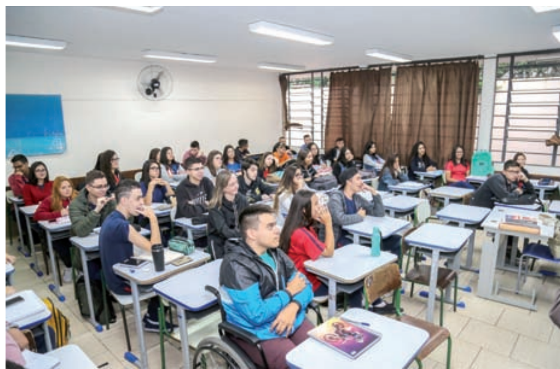
O Novo Ensino Médio terá implementação de forma gradual iniciando em 2022

O principal objetivo da nova proposta é promover um ensino mais significativo, em que o estudante seja protagonista da própria aprendizagem e que veja na escola um meio de alcançar seus objetivos pessoais e profissionais. A intenção é que os estudantes possam escolher, entre diferentes