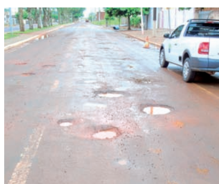
Buracos estavam incomodando os moradores, mas problema será solucionado

Vale reforçar que, a situação dos buracos se agravaram nos últimos dias