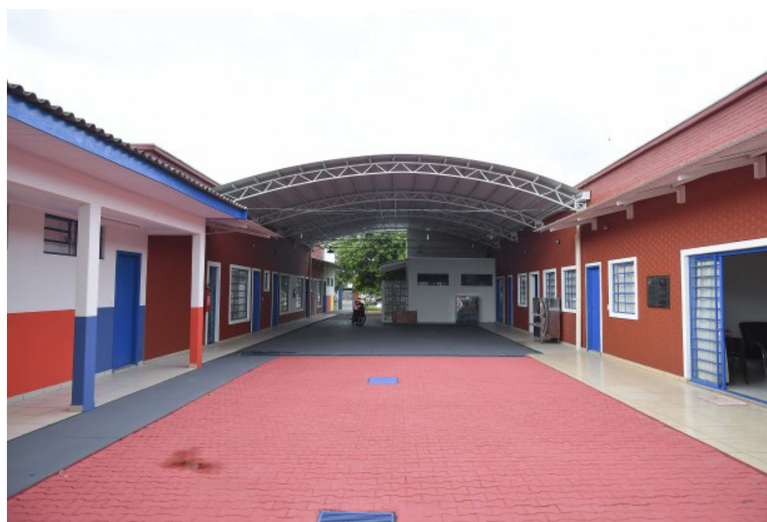
A medida considera que o restabelecimento das atividades escolares é importante para evitar prejuízos maiores à Educação

O mesmo decreto permite também sessões de cinema desde que sejam respeitados procedimentos como proibir a entrada de crianças; não permitir a entrada de pessoas do grupo de risco; manter o espaçamento de dois metros entre os frequentadores; higienizar as cadeiras antes de cada sessão e que as sessões tenham no máximo 80 pessoas.