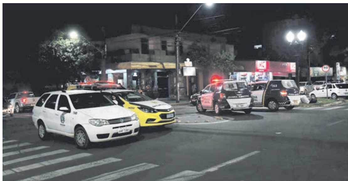
Continua obrigatório a toda população o uso de máscara nos locais públicos e nos privados acessíveis ao público

Estabelecimentos de entretenimento, eventos culturais, cinemas, casa de sho-