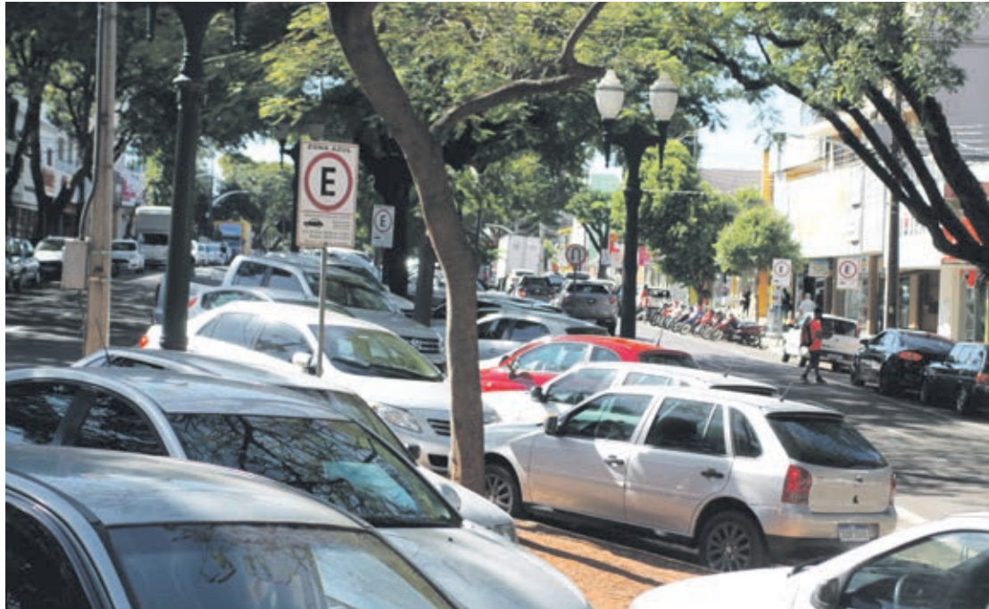
Para obter o desconto em multas de trânsito o proprietário do veículo deve estar cadastrado no SNE

Ela explica que o SNE é um meio de comunicação virtual disponibilizado pelo Denatran que permite o envio de notificações, comunicados e documentos em formato digital, relativos a infrações de trânsito. “Ao se cadastrar, o dono do veículo passa a ser comunicado