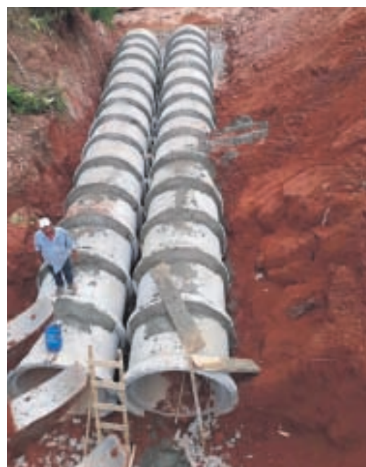
Obra caminha para o final e foi planejada para suportar as fortes chuvas

Cruzeiro do Oeste - A Prefeitura Municipal de Cruzeiro do Oeste está finalizando a obra de tubulação próxima ao Frigorífico Astra, que caiu em decorrência da chuva de 31/12/2021.