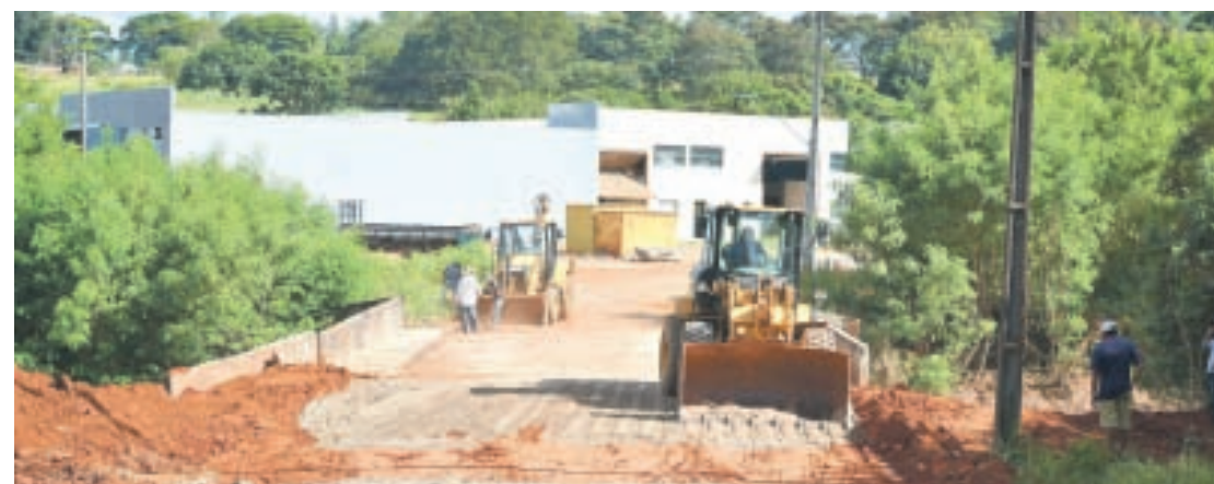
A capa asfáltica ainda não foi colocada, mas a passagem de veículos está normalizada

Umuarama - A ponte de acesso ao Jardim São Cristóvão (próximo à estação de tratamento de esgoto da Sanepar), foi liberada ao tráfego no final da tarde de quarta-feira, 7, depois de passar por obras de reforço da estrutura e recuperação da cabeceira sentido rodovia PR-323. A capa asfáltica ainda não foi colocada, mas a passagem de veículos está normalizada durante um período de acomodação da base, recomposta com brita graduada e rachão.