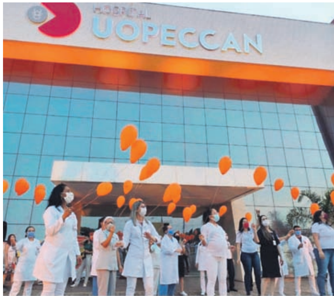
Em Umuarama, Uopecan recebeu uma luz laranja para celebrar a data. E também teve apresentação da Escola de Música e balões laranjados no ar

O envolvimento dos pacientes e familiares como parceiros críticos e ativos no processo de cuidar trazem contribuições importantes para segurança e a prevenção de incidentes. A inclusão deles contribuiu para melhoria da terapêutica clínica proposta pela equipe multiprofissional, deixando de ser receptores passivos.