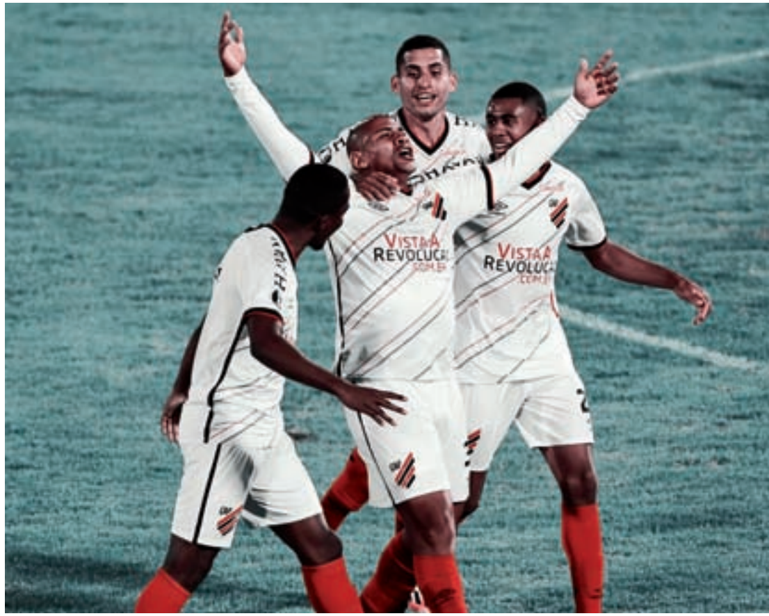
Equipe paranaense precisa jogar muito hoje em casa para seguir na competição

Maior artilheiro da história do Colo-Colo na Li-