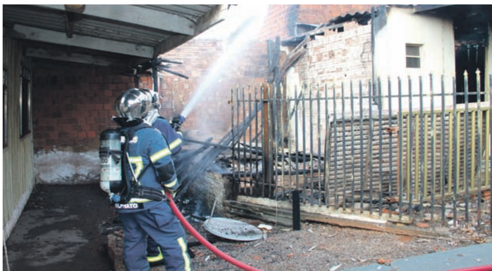
INCÊNDIO EM RESIDÊNCIA - Uma casa em madeira ficou totalmente destruída pelo fogo na tarde desta terça-feira no conjunto Ouro Branco, em Umuarama. Ninguém ficou ferido. Segundo o morador de 20 anos, as chamas teriam começado no quarto. Não havia ninguém na casa quando o incêndio começou. Página A6