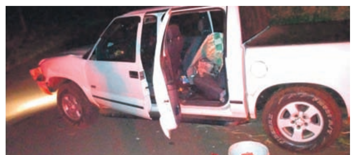
A caminhonete S-10 havia sido furtada horas antes em Loanda e já estava sendo usada pelos criminosos para cometer um novo furto

Em buscas pelas proximidades os policiais acabaram encontrando um casal deitado no meio do pasto. O homem fugiu. A mulher de 42 anos, moradora de Santa Isabel do Ivaí, acabou presa. Pouco depois os policiais acabaram encontrando o condutor do veículo, um homem de 29 anos. Ele estaria escondido em uma casa e se entregou após cerco da polícia.