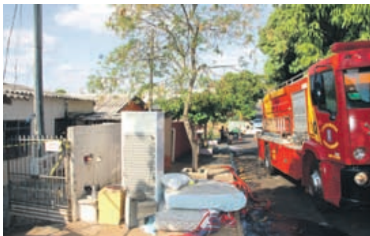
Os vizinhos retiraram todos os móveis da casa antes que as chamas se espalhassem