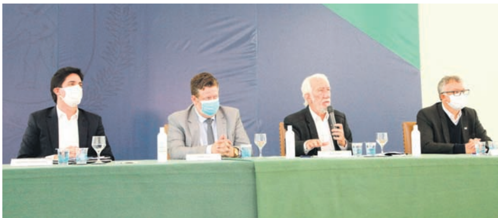
O prefeito de Pérola e presidente da AMP, Darlan Scalco, representou os municípios do Paraná ao lado do vice-governador Darci Piana