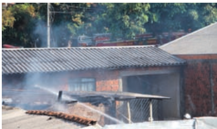
Os bombeiros trabalharam para fazer o rescaldo nas construções próximas por causa do risco de um novo incêndio