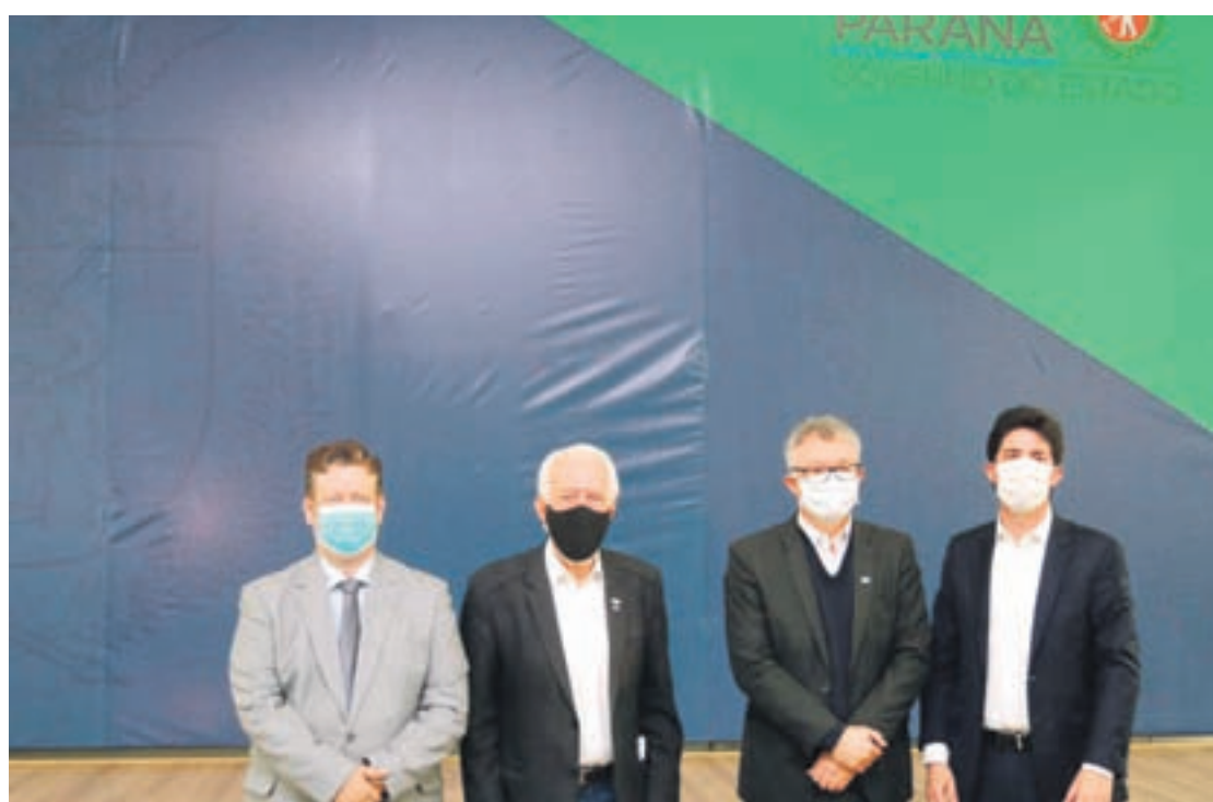
Prefeito de Pérola e presidente da AMP, Darlan Scalco ao lado do vice-governador Darci Piana e outras lideranças

O Reinvente Sua Cidade é uma iniciativa do Sebrae-PR, que foi incorporada pelo Governo do Estado como ferramenta de retomada do desenvolvimento econômico das cidades. O objetivo é proporcionar aos municípios ações de fortalecimento e disseminação de políticas públicas atra-