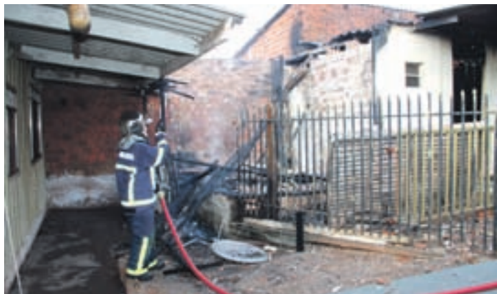
A construção em madeira ficou totalmente destruída pelo fogo

Para facilitar o trabalho dos bombeiros a quadra onde o imóvel está localizado ficou totalmente interditada por mais de 1 hora. O morador, de 20 anos, contou que mora há uma semana na casa que é locada.