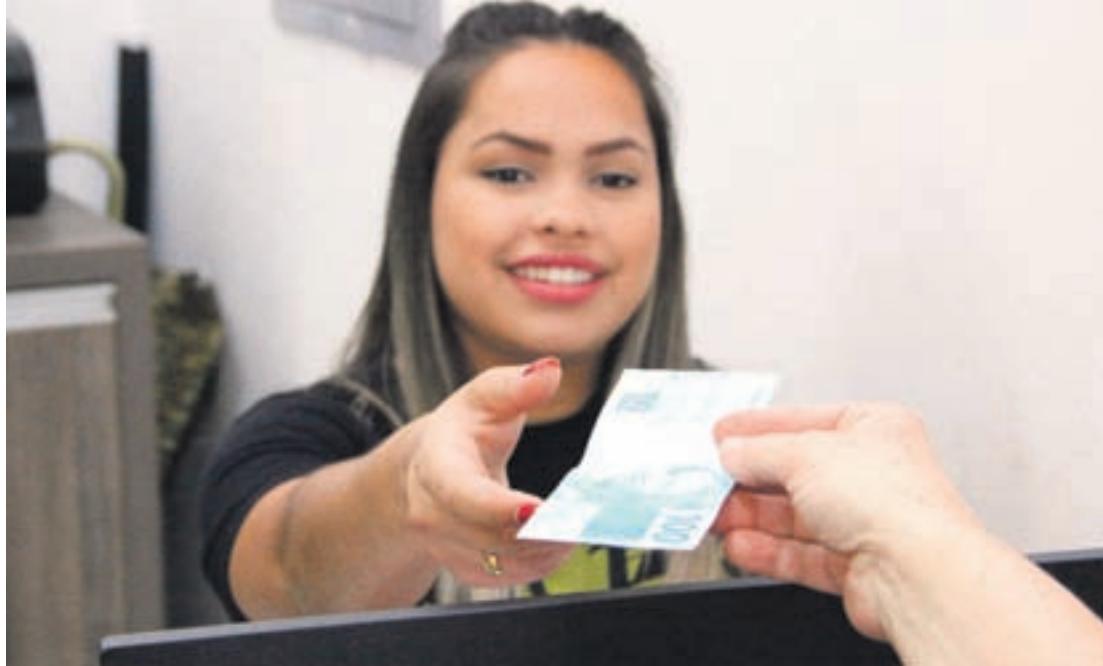
O número de inadimplentes na região de Umuarama caiu 2,37% entre o mês de julho e agosto

Nos dados repassados pela Aciu, em julho o banco do SPC Brasil tinha 32.646 registros