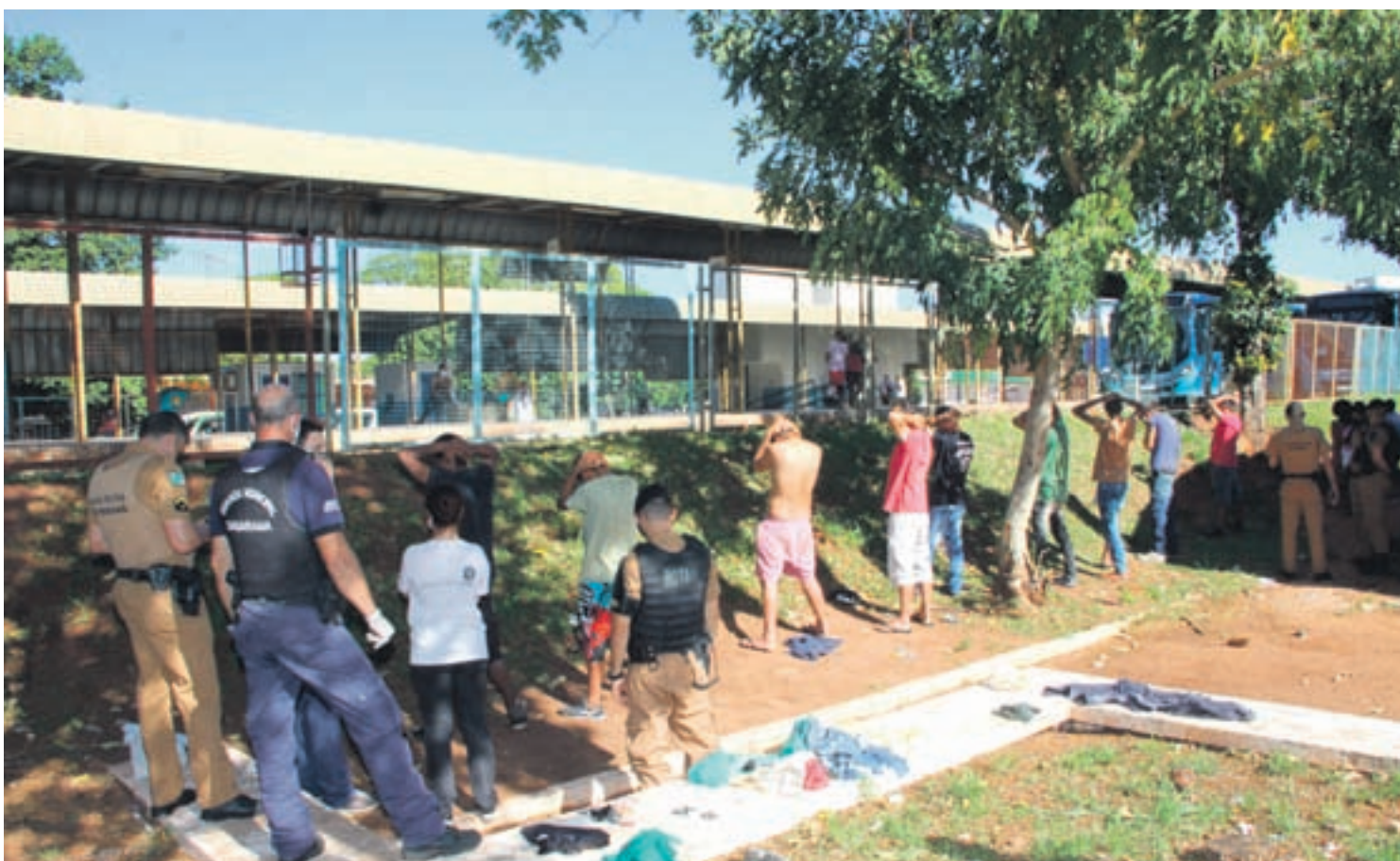
No total 28 pessoas foram abordadas e orientadas pela GM e pela PM em quatro pontos diferentes de Umuarama

Thiago Motta, diariamente a Guarda e a PM realizam ações de orientação, principalmente no entorno da Estação Rodoviária. A maior parte das pessoas em situação de rua são dependentes de drogas e/ou alcoólatras. “Não apreendemos nada de ilícito, mas na Praça da Bíblia flagramos pessoas consumindo drogas”, explicou o inspetor.