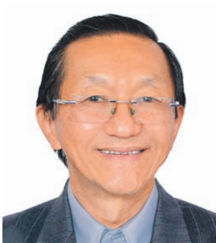
Candidato a prefeito Bóia ficou com 59% das intenções de votos