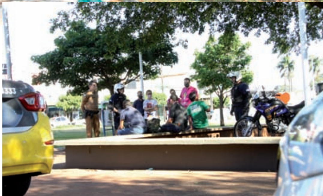
A maior parte das pessoas em situação de rua também são dependentes químicos de drogas e/ou álcool