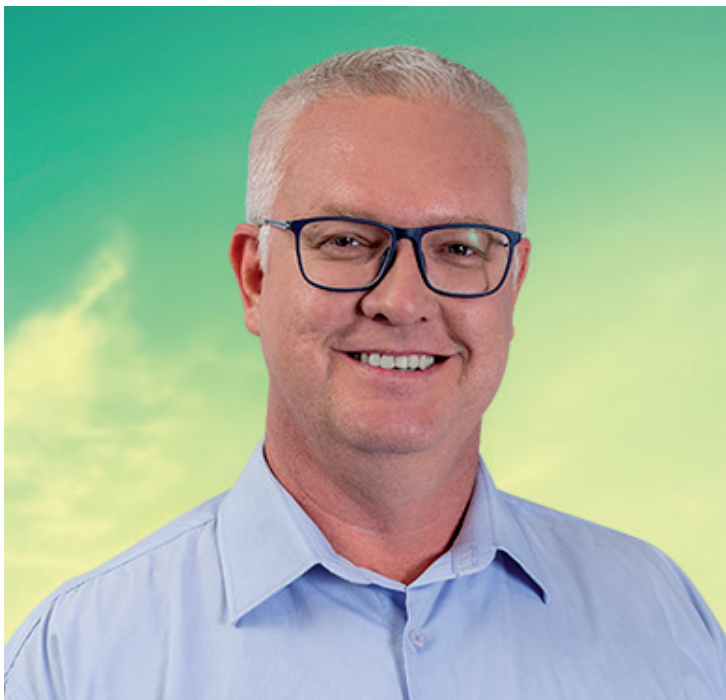
Galego Evangelista tem 22%