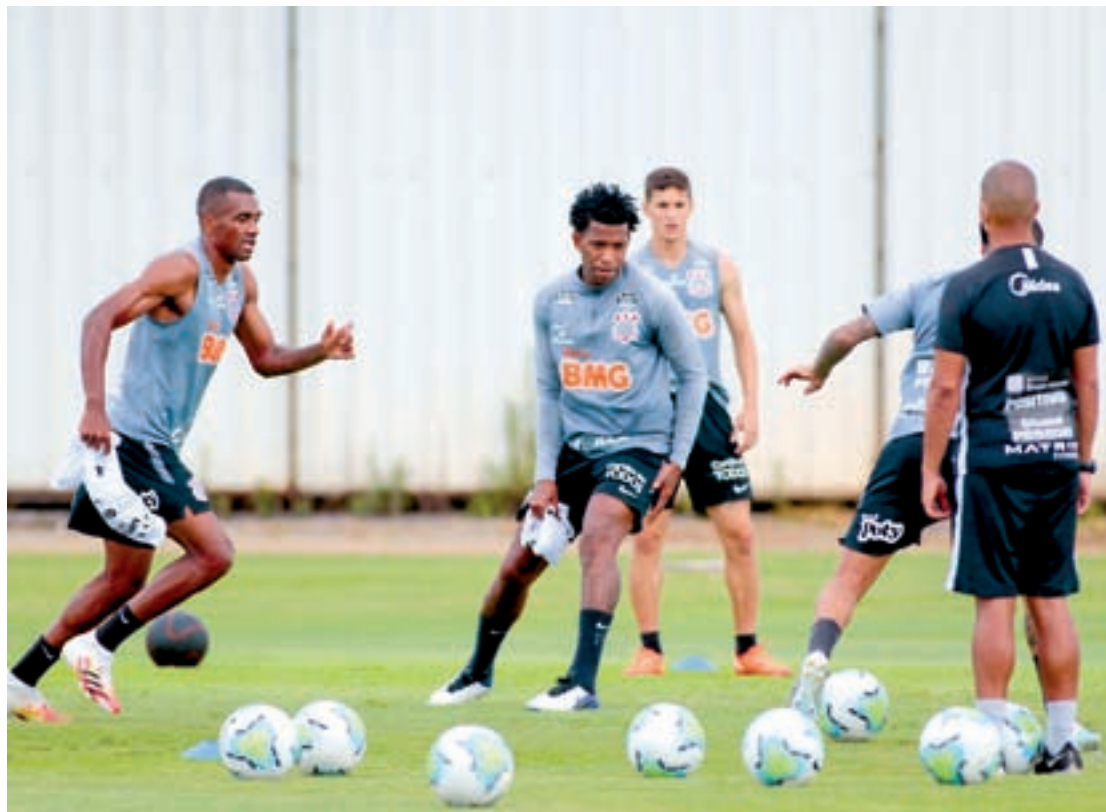
Corinthians tenta fazer uma boa estreia na competição

Avançar na competição, além de agradar aos torcedores, é uma forma do Corinthians equilibrar suas contas - os jogadores estão com dois meses de salários atrasados. Se for às quartas, o clube receberá R$ 3,3 milhões de premiação. Se passar para a semi, ganha mais R$ 7 milhões. Vaga na final garante ao vice R$ 22 milhões e ao campeão R$ 54 milhões. O