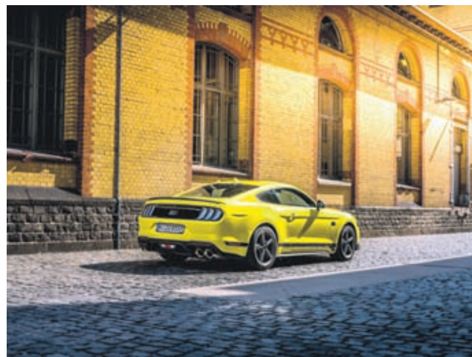
O motor V8 5.0 com calibração e refrigeração especial, de 460 cv, e a aerodinâmica aprimorada dão ao novo Mustang Mach 1 um desempenho digno da tradição

produção na Europa a ter a opção de transmissão manual Tremec de alto desempenho, além da automática de 10 velocidades.