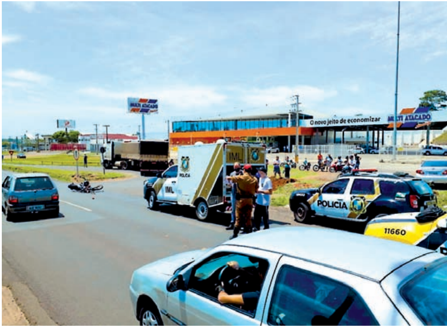
A colisão foi no fim da tarde de sábado no trecho urbano da PR-323, em Umuarama

O motorista da carreta não se feriu. Ele não quis