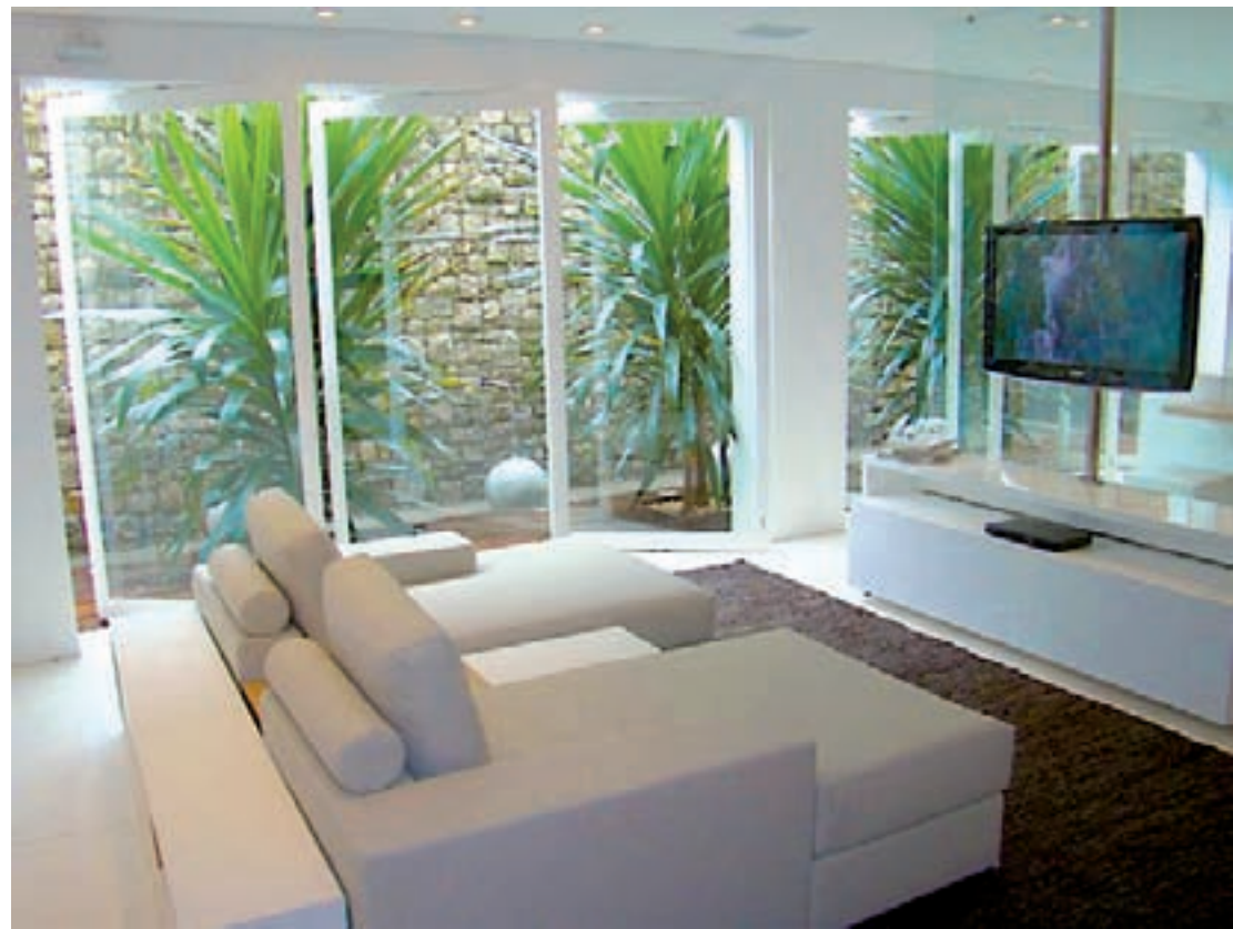
A ventilação nas construções é cada vez mais importante

O concreto não é, por exemplo, um bom isolante térmico e, por isso, dificulta a manutenção do calor no inverno e também a do frio no verão. Outra questão são as modificações feitas pelo morador, destaca. Um caso recorrente é o da varanda, que tende a ajudar na ventilação, mas que promove o efeito oposto quando é fechada com vidro, criando um "efeito estufa" dentro do apartamento.