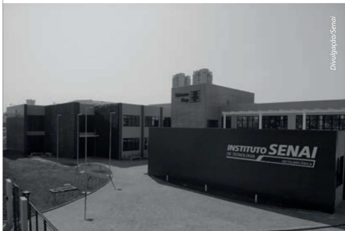
Um dos institutos do Senai no Paraná: mais de 90 projetos de inovação estão em desenvolvimento