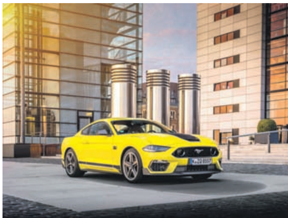
Criado em 1969, o Mustang Mach 1 elevou o nível de desempenho do Mustang GT com uma série de melhorias

O motor V8 5.0 com calibração e refrigeração especial, de 460 cv, e a aerodinâmica aprimorada para as pistas dão ao novo Mustang Mach 1 um desempenho digno da tradição desse ícone. Ele é o primeiro Mustang de