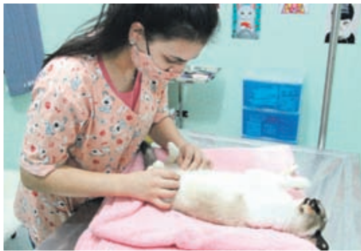
As gatas também precisam de atenção dos tutores, pois também são acometidas com o câncer de mamas