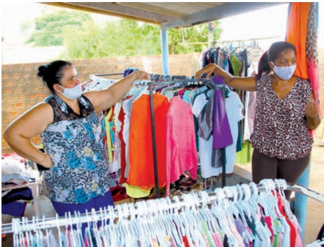
As roupas e calçados ficam em exposição como se fosse uma loja, porém ninguém paga por nada