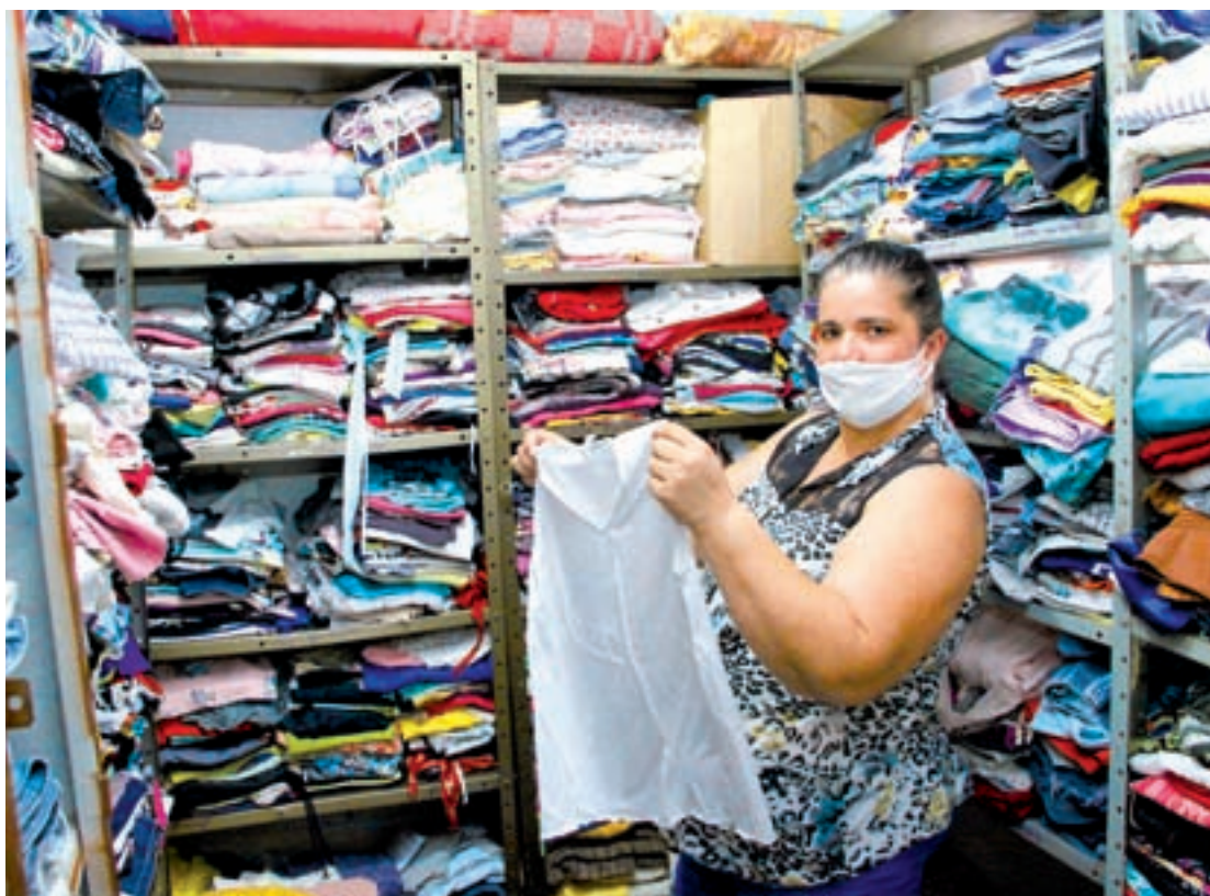
As mulheres com auxílios dos maridos organizam todas as doações que são retiradas pela comunidade carente