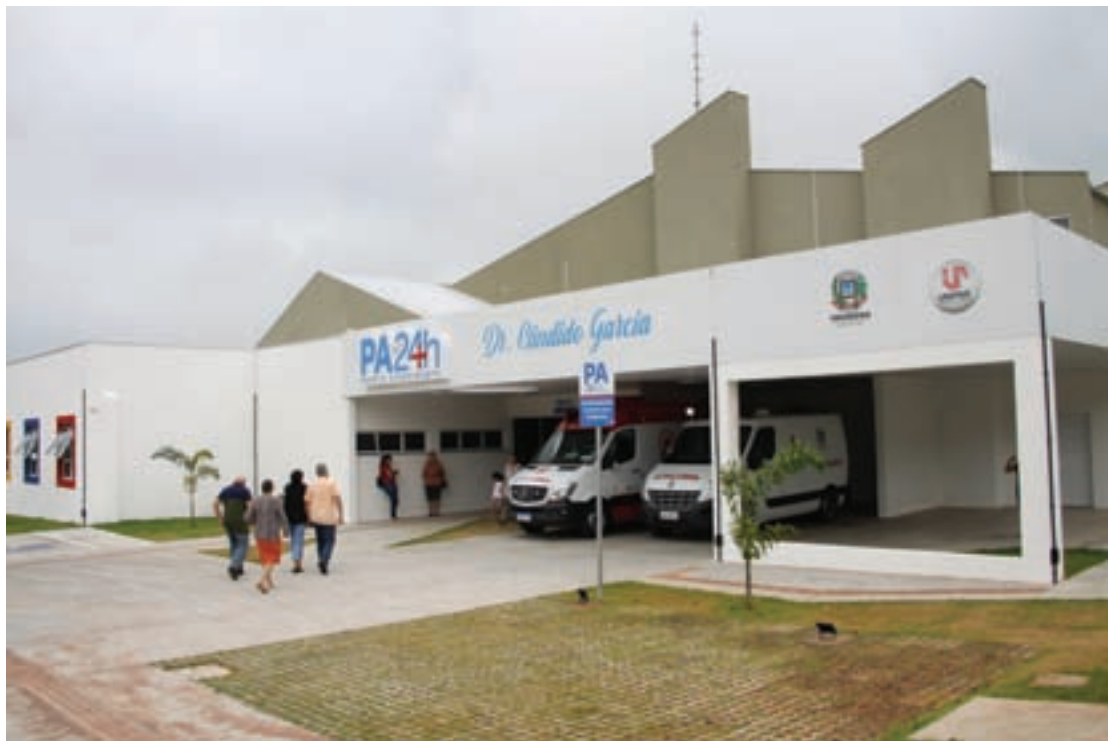
A passagem inicial dos pacientes com suspeitas da doença em Umuarama é o PA 24 horas