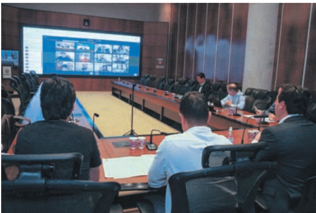
Governador falou com prefeitos por videoconferência

O governador reafirmou que é preciso respeitar a recomendação de funcionamento apenas de atividades essenciais e seguir a orientação das autoridades brasileiras e internacionais de saúde, que indicam a necessidade de isolamento social para conter a prolifera-