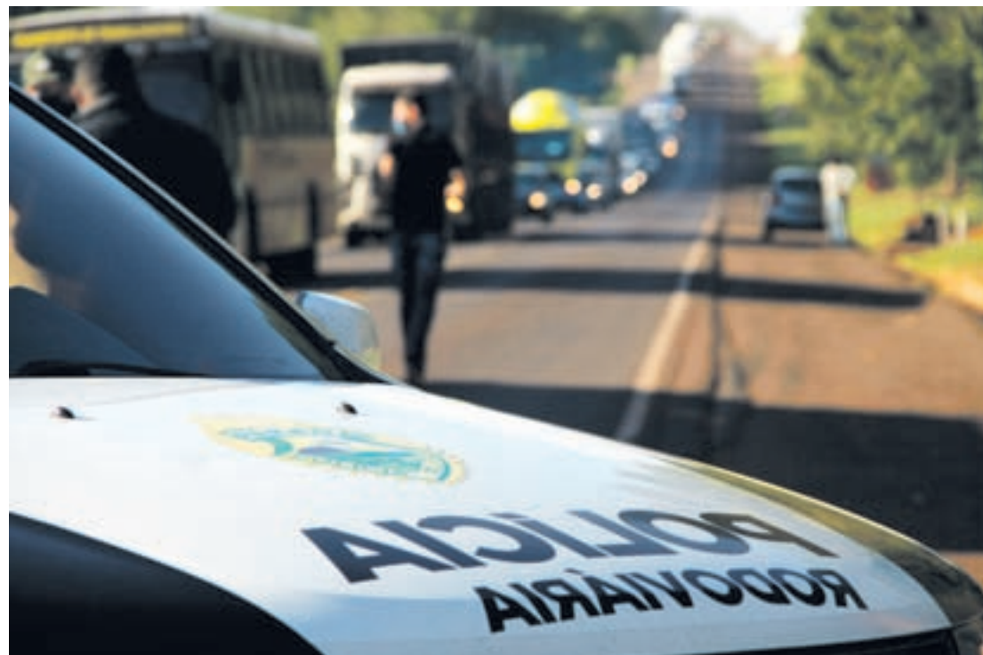
Um grande congestionamento se formou nos dois sentidos da rodovia por causa do acidente