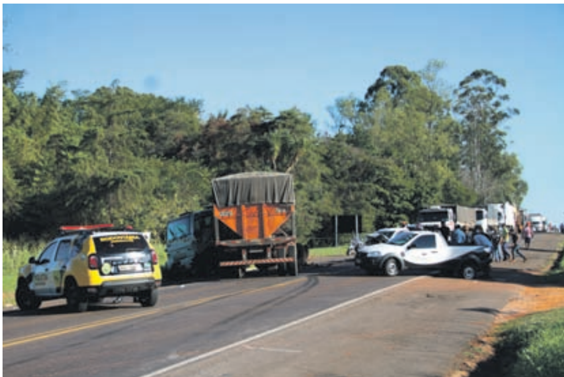
A colisão envolveu quatro veículos e há a suspeita de que um quinto veículo teria provocado o acidente