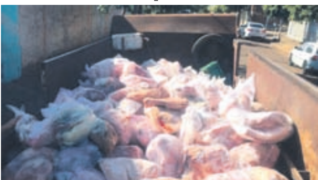
A carne estava armazenada de forma irregular segundo as notas da Vigilância Sanitária

Pelo menos cinco mil quilos de carne bovina e suína foram apreendidas por não terem procedência, por estarem vencidas e armazenadas sem os devidos cuidados sanitários.