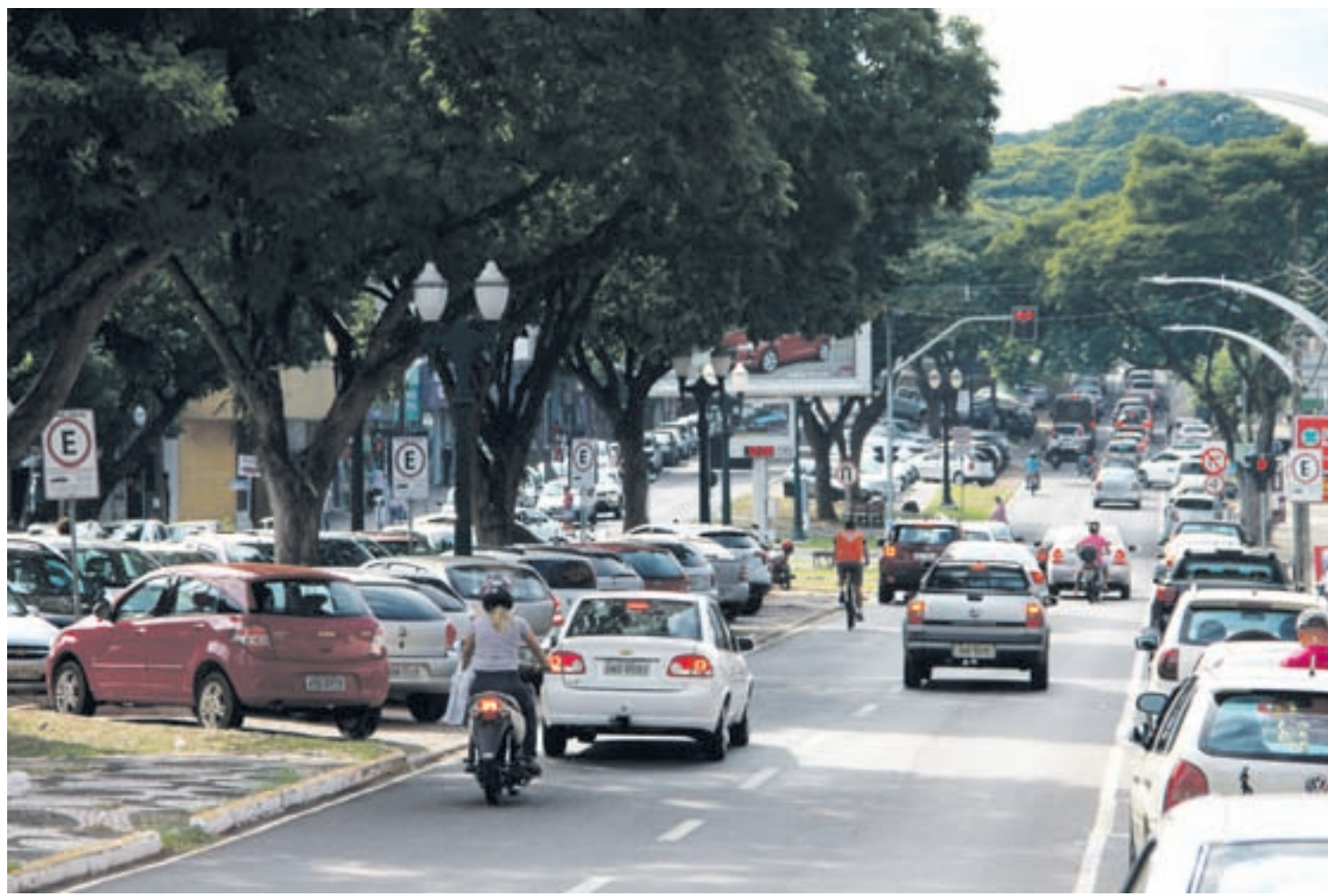
Pizzarias, lanchonetes e carrinhos de lanche podem atender ao público aos domingos em sistema de delivery até as 22h.

Outra mudança do novo decreto diz respeito às academias, onde as atividades esportivas serão permitidas em modalidades