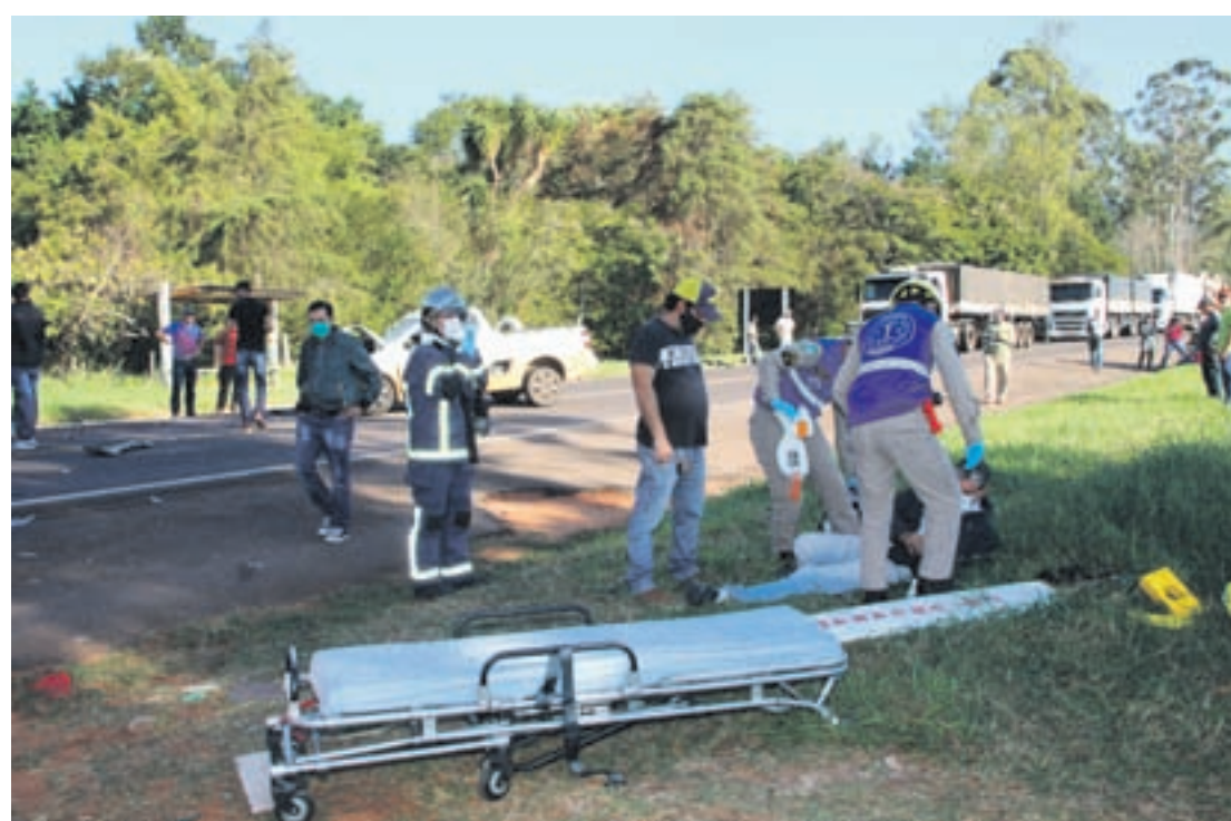
Os feridos foram socorridos pelo Samu e pelos Bombeiros e levados para o Hospital Uopecan

Ainda segundo o apurado existe a suspeita do envolvimento de um quinto