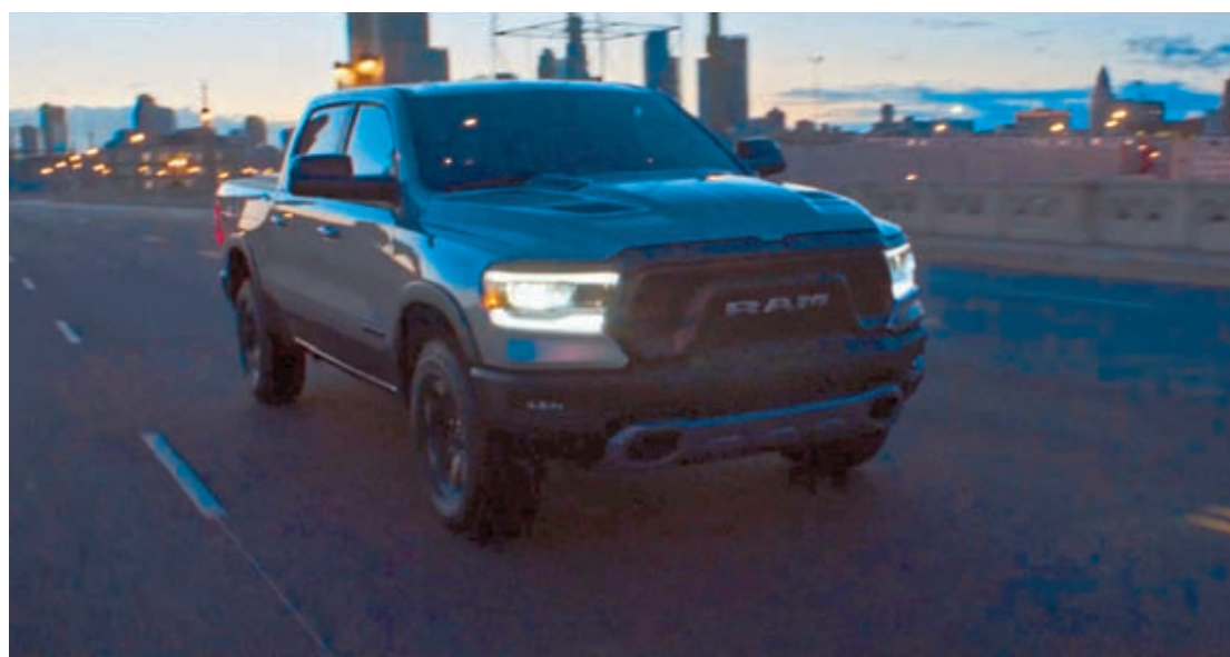
Além do “poder” nas mãos para dirigir a picape full size com quase 6 metros de comprimento e que passa das 2,5 toneladas de peso

“Você tem o poder nas mãos.” Com esse conceito, a marca Ram apresenta a campanha de lançamento da Ram 1500 Rebel. Com potência, luxo e tecnologia sem precedentes, a picape inaugura um novo segmento no Brasil, de premium muscle truck. A chegada da 1500 protagoniza um novo capítulo para a Ram no Brasil, expandindo não somente o portfólio, mas também o seu público, que já aprovou o modelo e esgotou em apenas 18 horas o lote inicial de 100 unidades comercializadas na pré-venda.