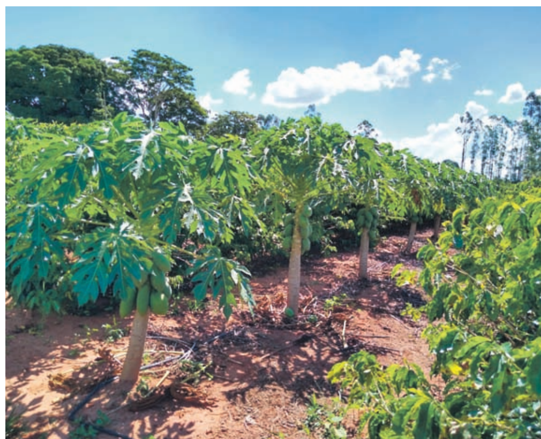
Conforme técnicos do IDR-Paraná, o plantio de mamão têm apresentado bons resultados, com produtividade em torno de 70 toneladas/ha, num ciclo de dois anos