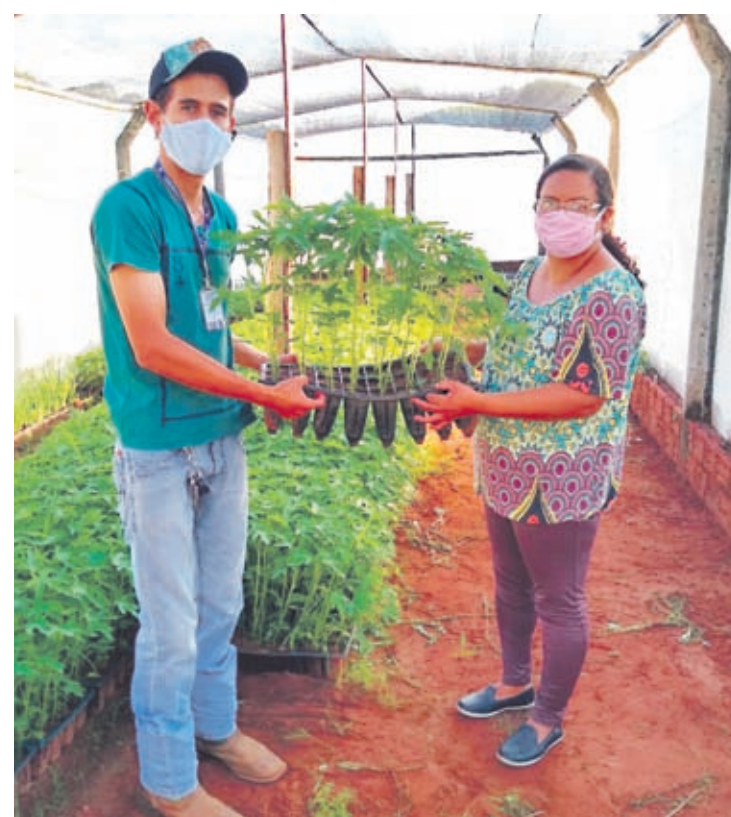
Os mamoeiros começam a produzir entre oito e dez meses depois do plantio