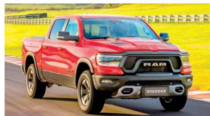
A chegada da 1500 protagoniza um novo capítulo para a Ram no Brasil

suíte presidencial de um hotel e com um aperto de mão é possível fechar um negócio e transformar uma startup em uma empresa unicórnio.