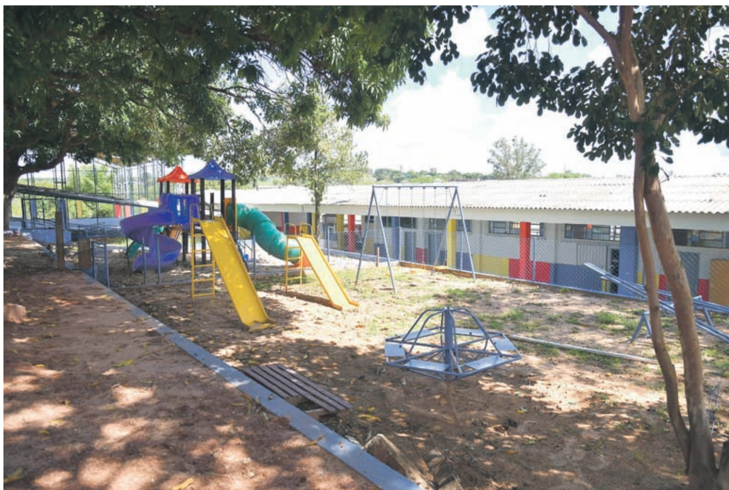
A Secretaria Municipal de Educação ofereceu 260 horas de formações em diversas áreas e 100% dos profissionais da rede municipal de ensino

Além disso, houve reorganização do espaço