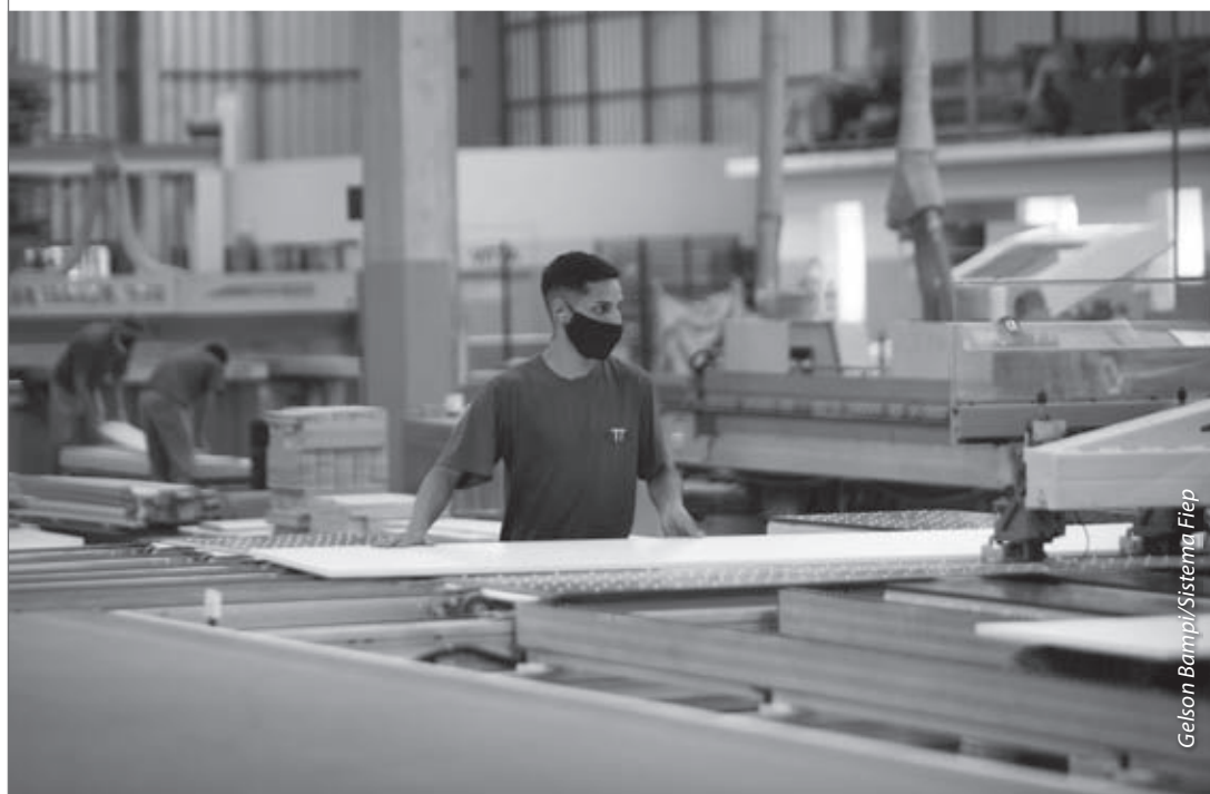
Aumento das encomendas nos últimos meses eleva otimismo das indústrias para 2021

O cenário favorável deve, também, ampliar os investimentos das indústrias paranaenses. No total, 69% delas pretendem investir em 2021. “Precisamos ter uma segurança de futuro para fazer investimentos. Com uma situação mais expressiva no volume de negócios, os investimentos também voltam”, afirma o presidente da Fiep.