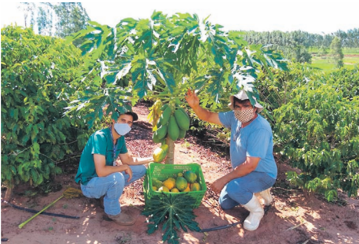
Atualmente vinte produtores de municípios da região de Umuarama estão plantando mamão