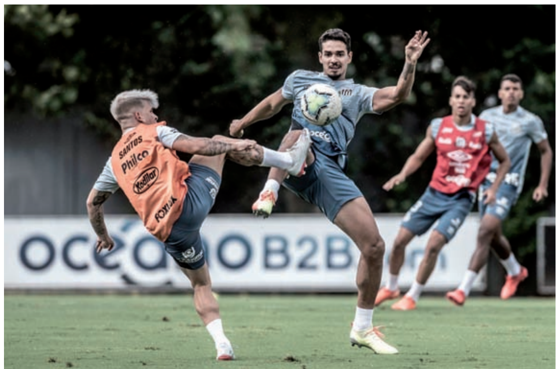
Santos treina forte para vencer mais um desafio

O Ceará está perto do grupo que se classifica para a Copa Libertadores de 2021, mas o objetivo principal ainda é escapar do rebaixamento. Mais um passo nesta direção poderá ser dado neste domingo, quando o time alvinegro vai até a Vila Belmiro para en-