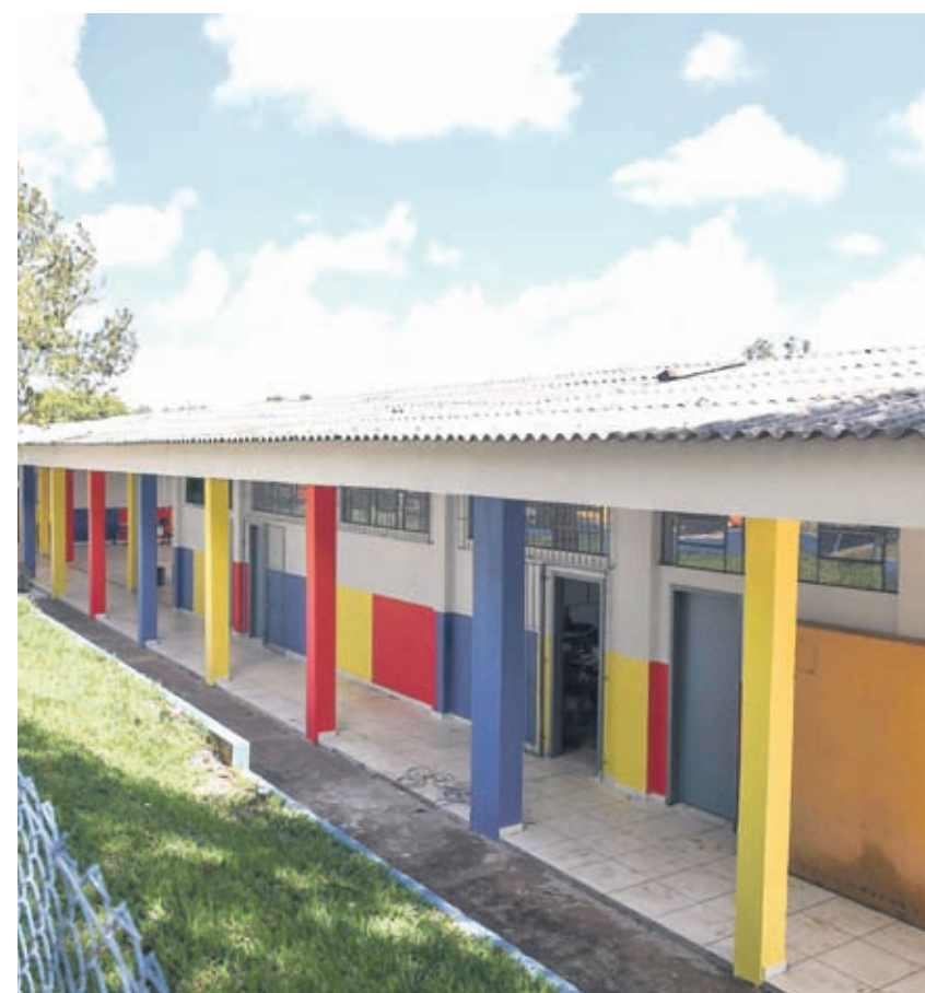
MAIS EDUCAÇÃO EM UMUARAMA - Um balanço dos investimentos feitos pela Prefeitura de Umuarama, nos últimos anos, mostra que a Educação é um dos setores que foram priorizados. Página A6