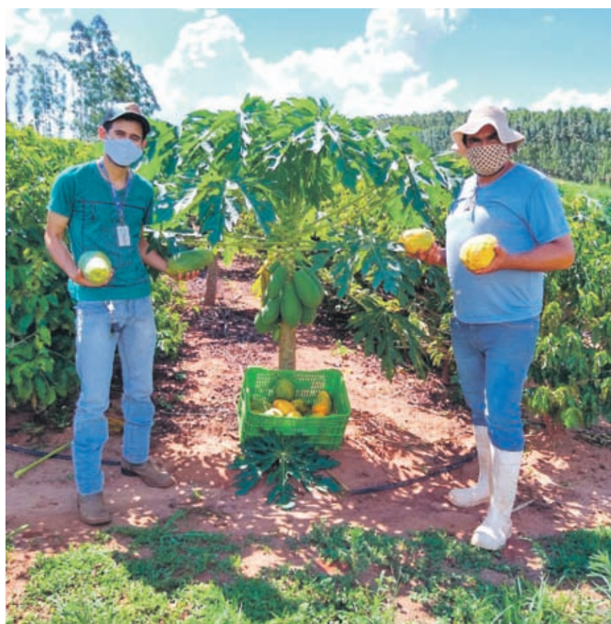
OPÇÃO DE RENDA NO CAMPO - O mamão é uma das alternativas de renda no campo e tem espaço garantido em Umuarama e região, pois 90% da fruta para o consumo vem de outras regiões. Página A7