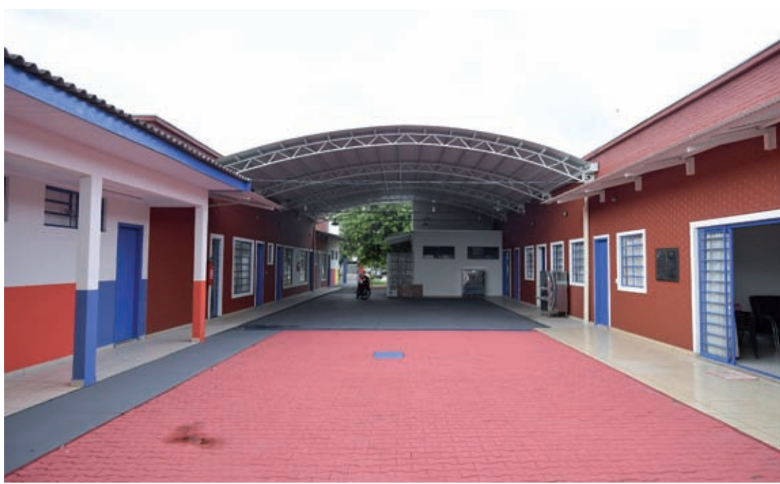
As obras de reforma e ampliação do Centro Municipal de Educação Infantil (CMEI) Madre Paulina, no Parque Danielle, estão praticamente finalizadas

"A situação de muitos estabelecimentos era bem crítica, por isso estamos colocando em prática um grande investimento que é resultado de planejamento e de um levantamento detalhado da situação, realizado pela Secretaria Municipal de Educação, ao lado da equipe de Obras, Planejamento Urbano, Projetos Técnicos e Habitação", destacou o prefeito Celso Pozzobom.