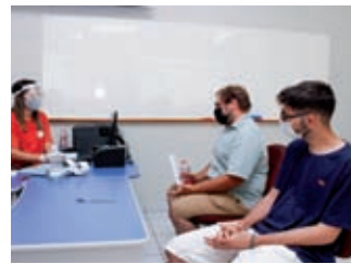
Matrículas: Sai hoje o resultado dos aprovados em segunda chamada

As matrículas serão realizadas na próxima segunda-feira (21/12), das 13h às 22h, na Unipar Campus Sede, em Umuarama. O vestibular foi realizado no dia 06 de dezembro na Unipar Campus III, em Umuarama. As provas ocorreram de forma presencial respeitando as normas de biossegurança: salas de aula com higienização especial, as carteiras com devido distanciamento e cuidados para evitar aglomeração no pátio.