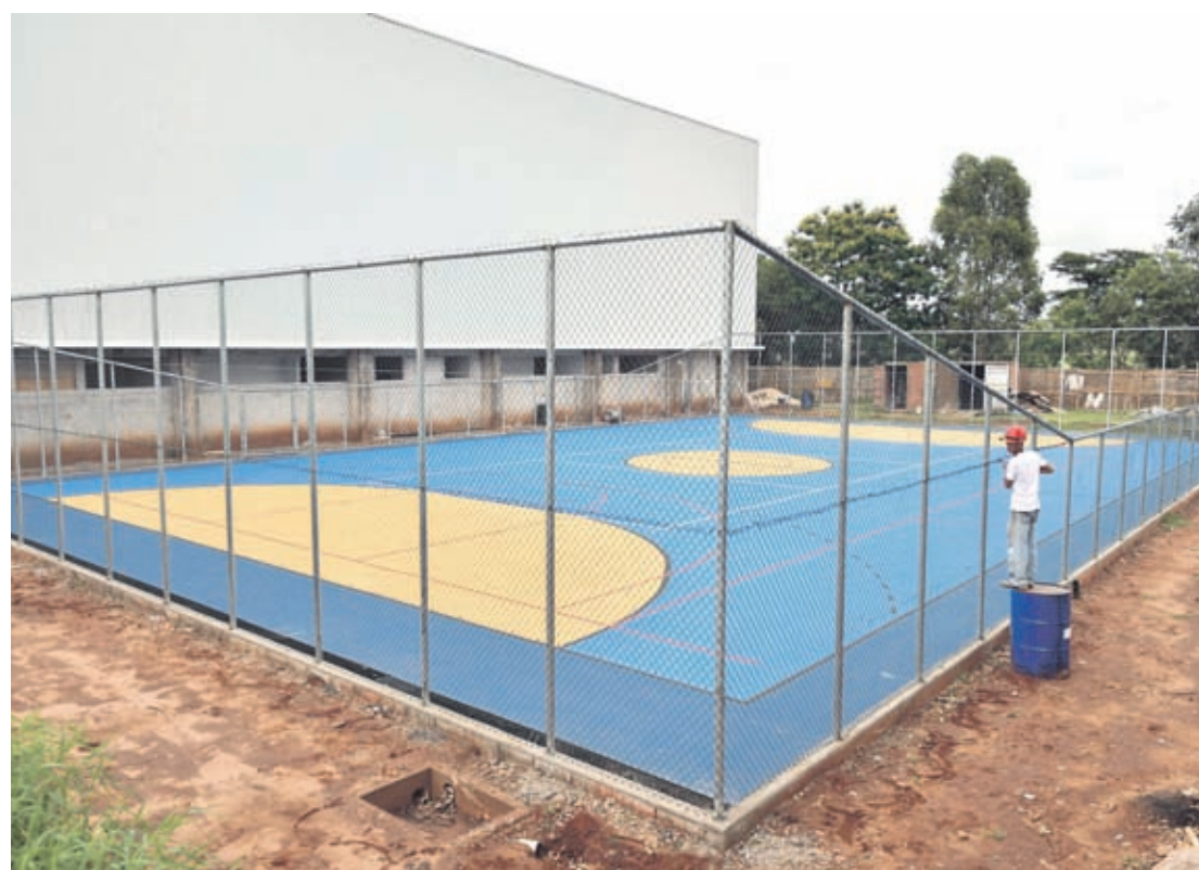
Construção do Centro de Iniciação Esportiva do Sonho Meu já tem quadra externa