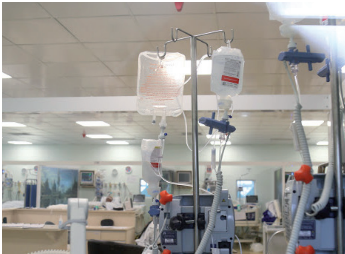
Nos hospitais da cidade, a ocupação de leitos de UTI permanece em 100%

Há ainda 1.937 pessoas com suspeita de infecção pelo coronavírus, duas delas hospitalizadas, e aumentou para 52 o total de umuaramenses internados nas cidades da macrorregião Noroeste (29 em UTIs e 23 em enfermarias).