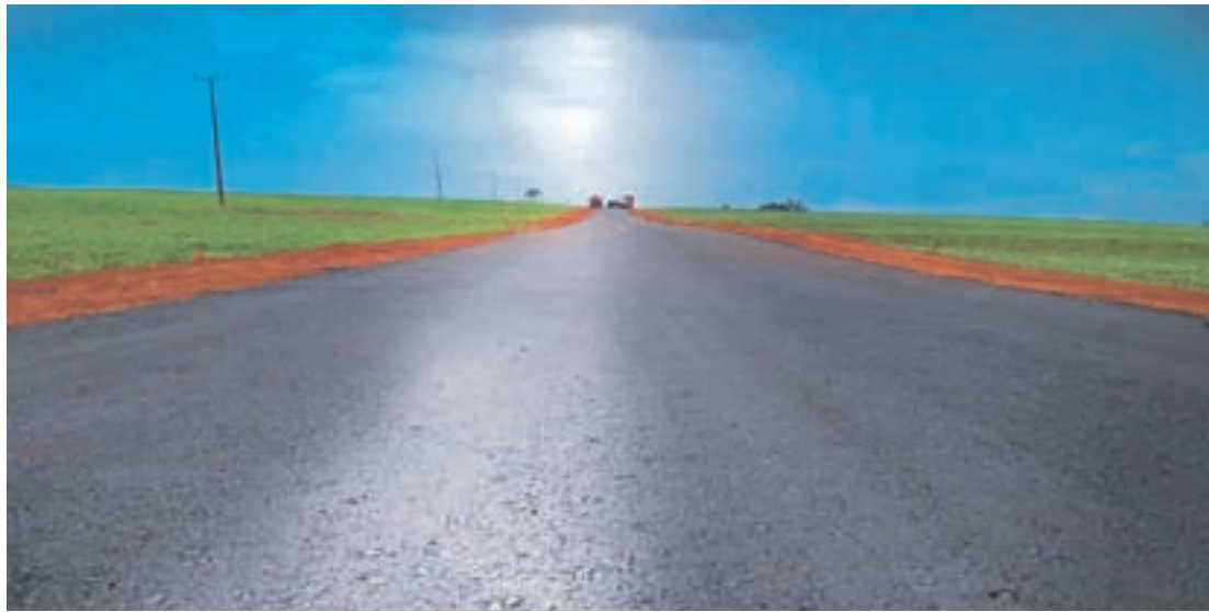
A pavimentação da estrada avança e anima os moradores

A benfeitoria que vai mudar a realidade de um povo, que esperou por décadas, só está sendo possível graças ao esforço do Governo Municipal com a parceria da ITAIPU BINACIONAL. O bom momento que os moradores estão vivendo começou bem antes da chegada do asfalto na estrada que vai ligar à sede, pois com o registro do Distrito, feito histórico