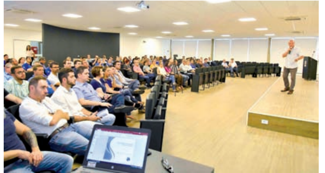
A Sanepar realizou nesta sexta-feira audiência pública para apresentar à sociedade a minuta

Além disso, a Sanepar prevê a construção de um Centro de Educação Ambiental, solicitado pelo prefeito Celso Pozzobom, e a implantação de um