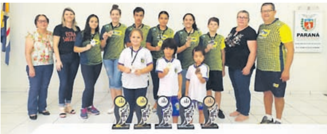
Professores, organizadores e premiados na competição

Umuarama - O Núcleo Regional da Educação de Umuarama entregou nesta sexta-feira a premiação para os campeões de Xadrez Escolar que venceram o Circuito Regional deste ano.