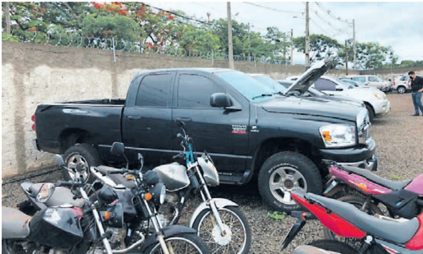
O leilão possibilitará a retirada de 1.302 veículos inservíveis do pátio de São José dos Pinhais

A remoção dos veículos inservíveis dos pátios traz diversos benefícios, sendo um deles para a saúde pública da população residente no entorno. Tesseroli