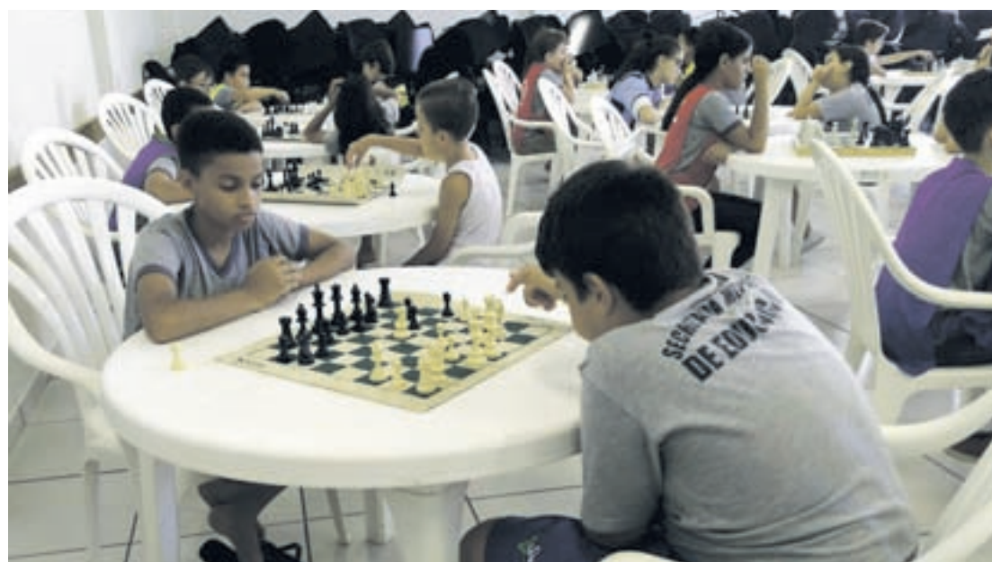
O Xadrez é uma das modalidades em disputa