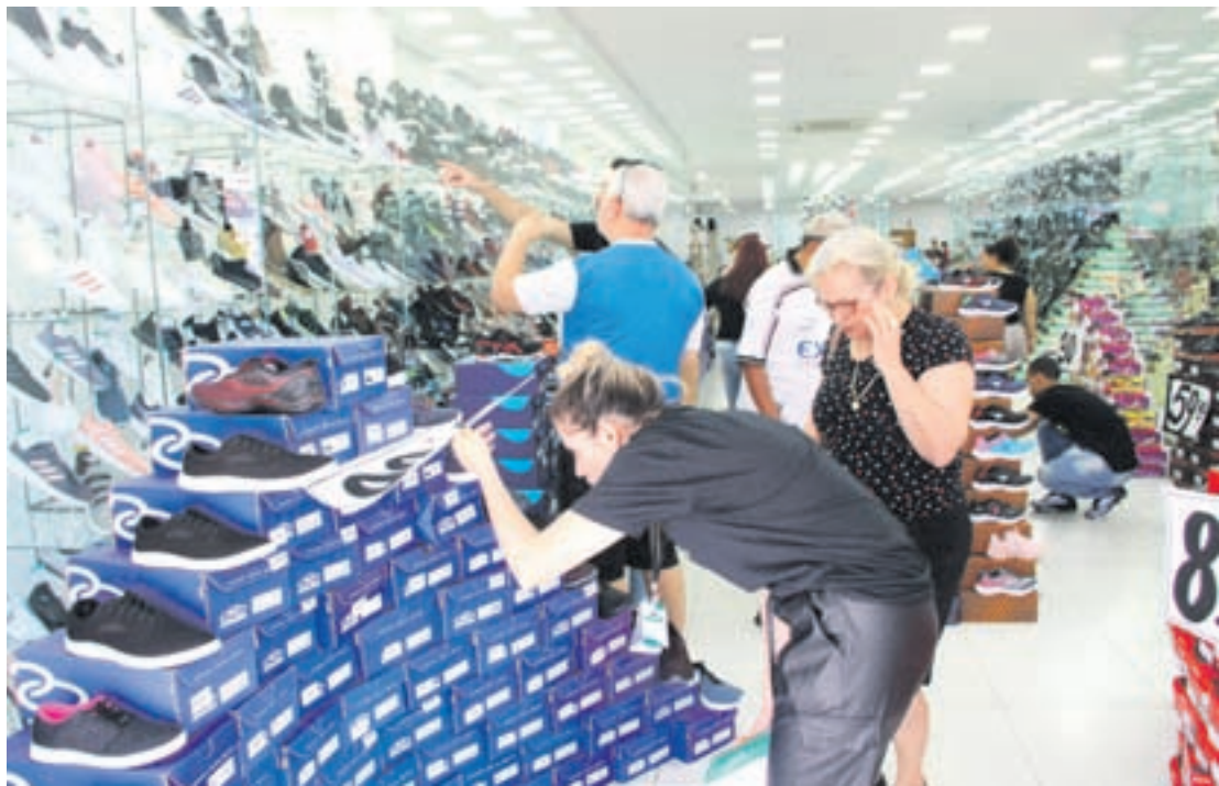
Alguns gerentes de Umuarama já sentiram elevação nas vendas desde segunda-feira (25)