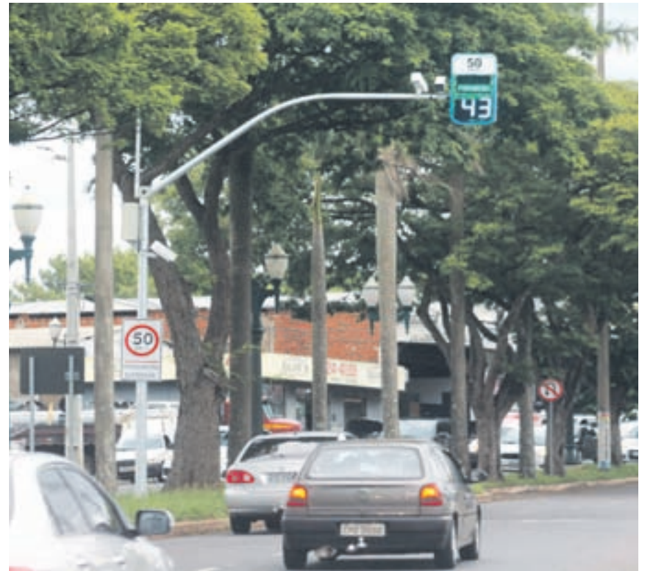
Na avenida Tiradentes o limite máximo é de 50 km/h e ali como em outros pontos, a chance de haver fiscalização com radar móvel é maior

média de uma irregularidade cometida a cada um minuto e vinte e cinco segundos. No total 98 carros passaram neste trecho da avenida no intervalo de apenas 10 minutos, e deste total, 91,83% respeitou o limite máximo de velocidade do trecho, ou seja, de 40 km/h.