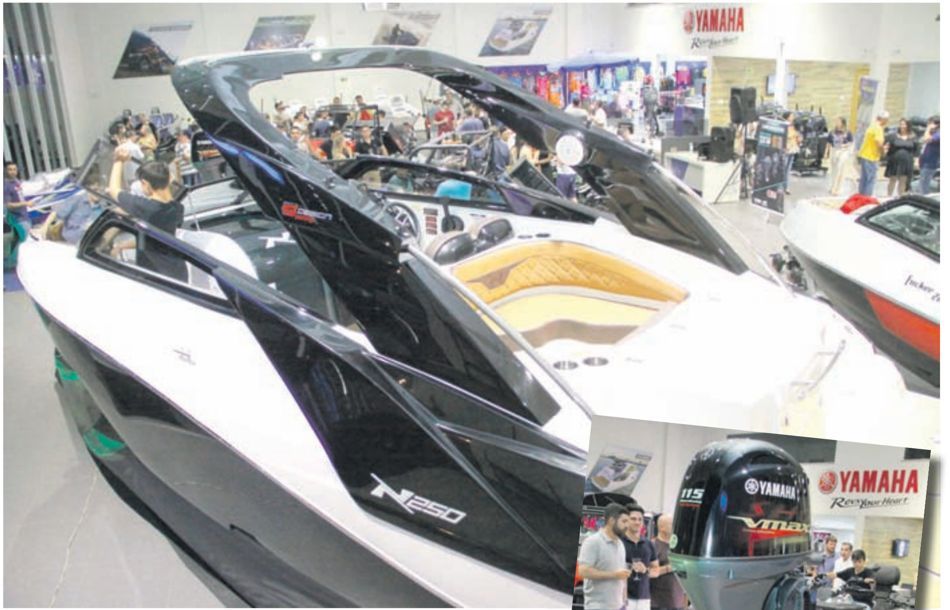
Acima a lancha NX 250 premium e ao lado o motor VMAX SHO 115 com a qualidade Yamaha

Lançamento especial na Yza Náutica & Off Road, é o UFORCE1000, construído em uma plataforma nova com vários atrativos e com preço especial de lançamento, principalmente para agricultores e pecuaristas. Tem motor com grande capacidade de reboque e transporte. E uma cabine inspirada no setor automotivo para transportar confortavelmente três ocupantes. Conta com opção de carga e descarga à gás e transporta até 350 quilos.