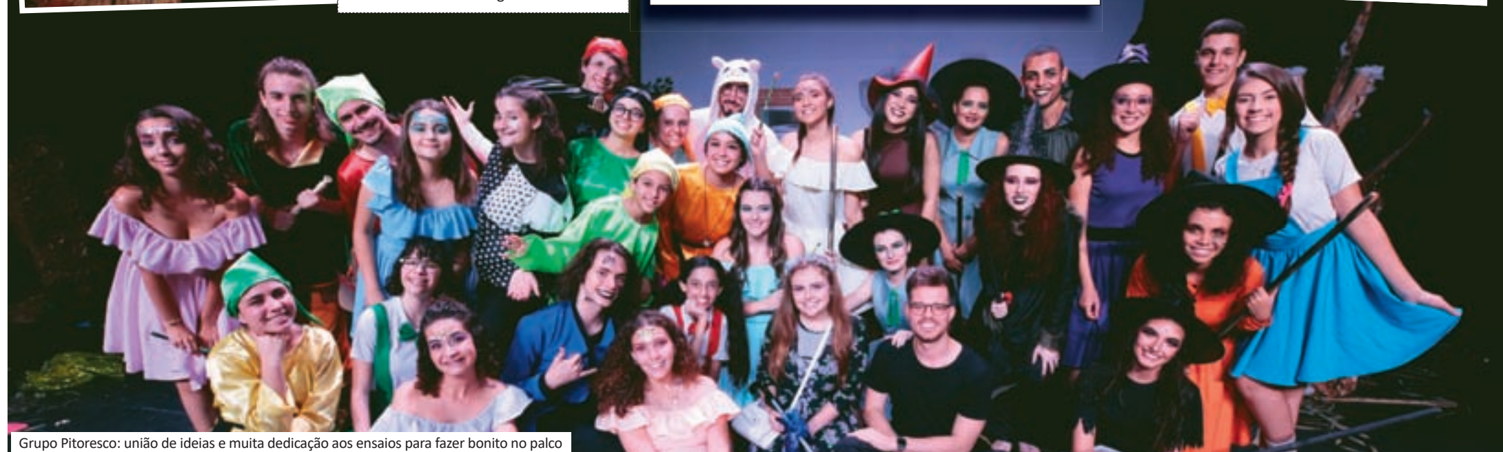
Grupo Pitoresco: união de ideias e muita dedicação aos ensaios para fazer bonito no palco