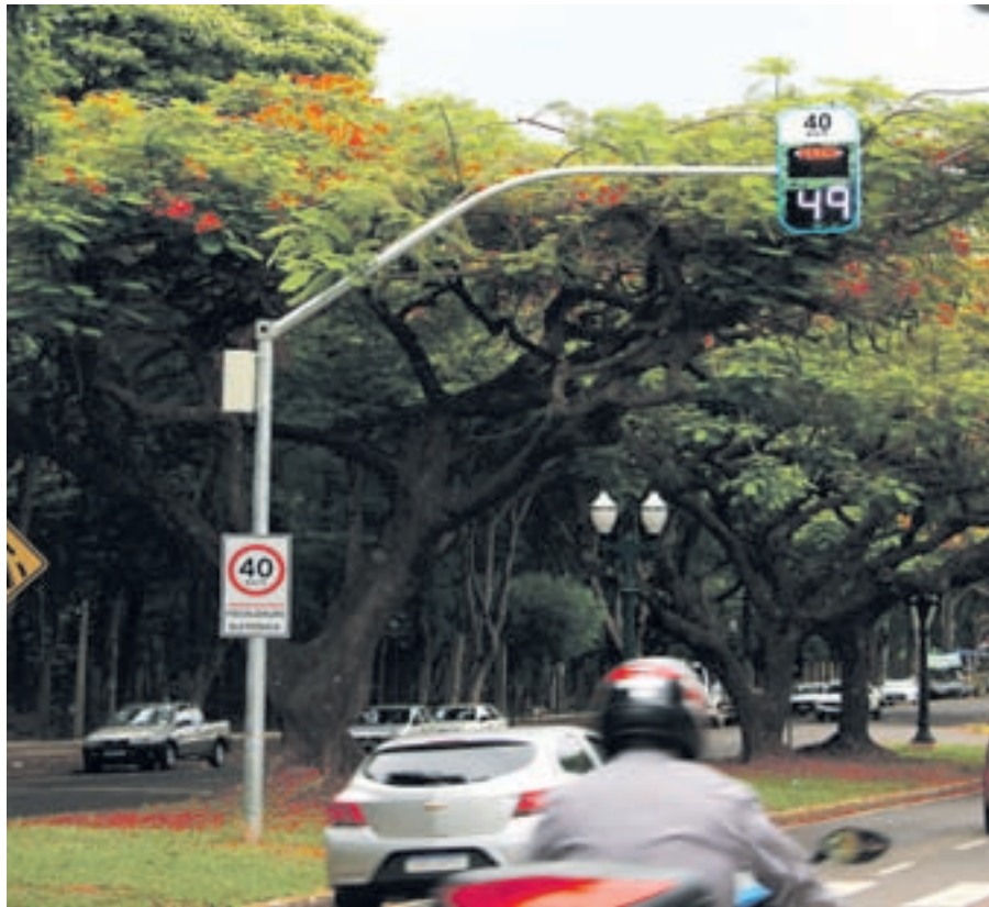
Saiba se você pode ser multado se não respeitar o limite velocidade do 'anjinho'

Entretanto a diretora de trânsito afirmou que os pontos onde há a presença do ‘anjinho’ a chance de estar na sequência agentes de trânsito com radar móvel é maior. Atualmente 17 equi-