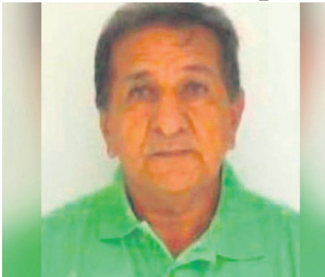
O taxista está desaparecido desde a noite de quinta-feira (14). Informações podem ser repassadas pelos telefones 190 e 197

Segundo informações da polícia, o taxista teria sido contratado por dois moradores de Alto Piquiri que também não estão sendo encontrados. Existe a possibilidade de que mais pessoas estejam envolvidas no desaparecimento do taxista.