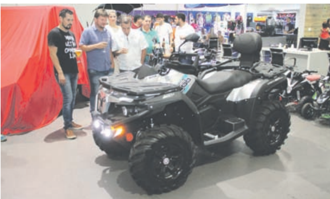
CFORCE600 foi projetado para trilha e trabalho