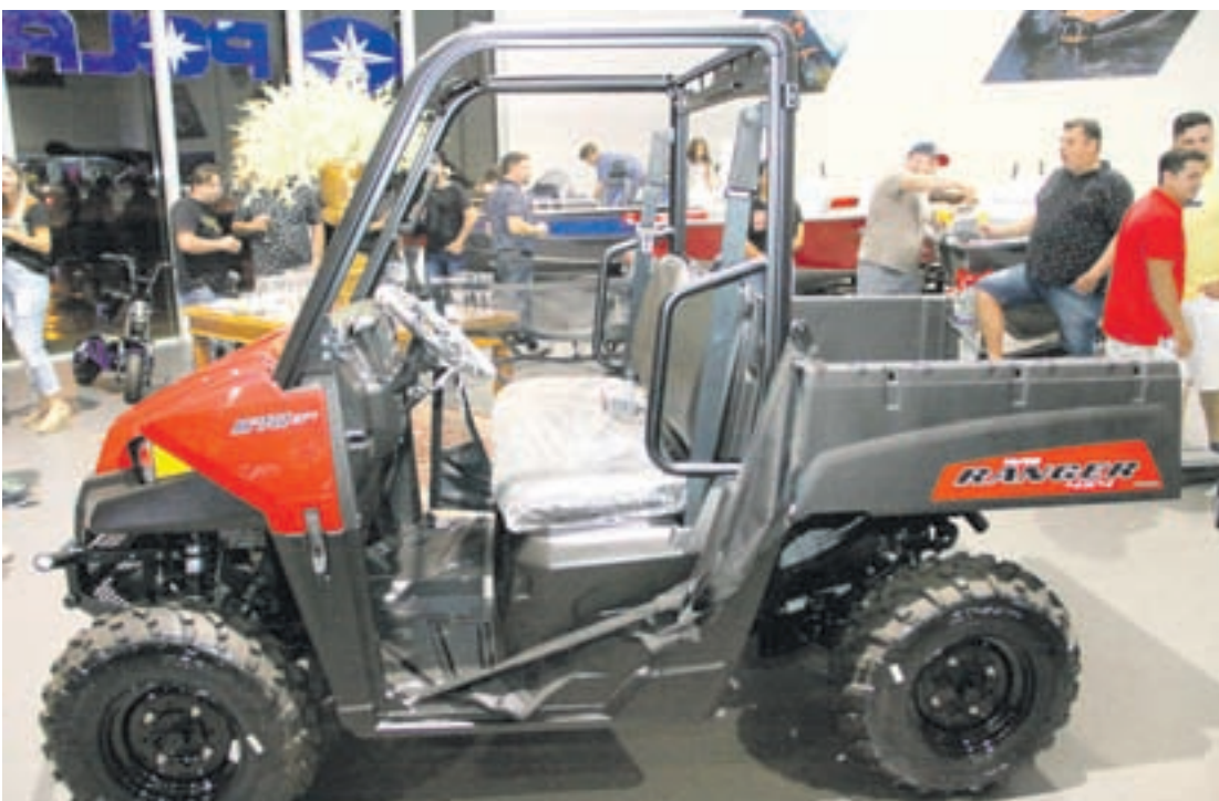
O RANGER 570 Polaris é o utilitário mais potente do mercado

apresentado o RANGER 570 Polaris, que oferece o melhor desempenho quando o assunto é utilitários para duas pessoas. E o que é melhor: tem excelente preço. É considerado o utilitário mais potente do mercado com desempenho excelente para enfrentar os desafios do dia a dia na propriedade rural em trilhas ou passeios.