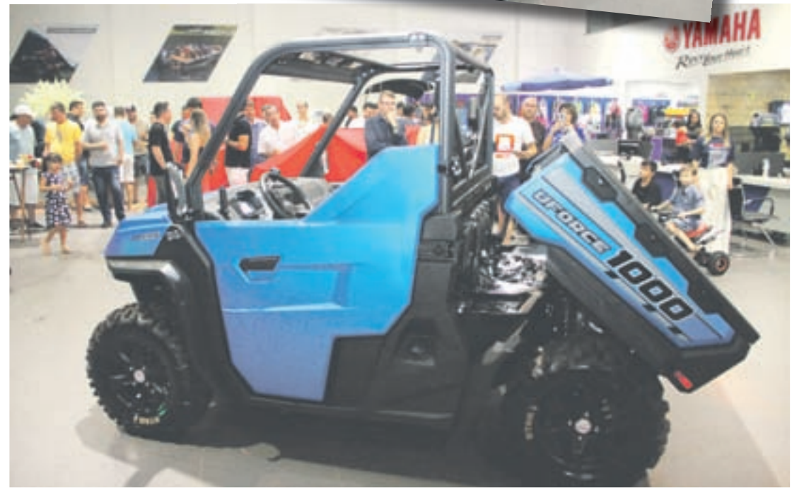
UFORCE1000 é potente e está com preço especial