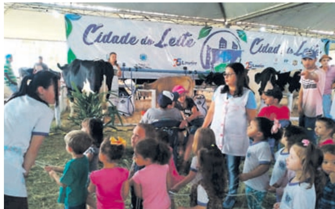
Estudantes, professores e público em geral visitaram a Cidade do Leite na Expo