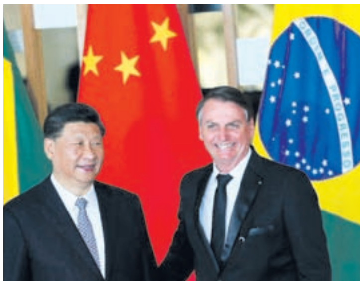
O presidente chinês, Xi Jinping se reuniu na manhã desta quarta-feira com presidente Jair Bolsonaro, no Palácio do Itamaraty

Em declaração à imprensa, Bolsonaro disse que o governo e o empresariado brasileiro querem ampliar e diversificar o comércio com a China. Para o presidente, os atos assinados dão impulso a essas relações. “Essa relação bilateral em várias áreas, inclusive com aceno do governo chinês em agregar valor naquilo que nós produzimos, tudo isso é muito bem-vindo”, disse.