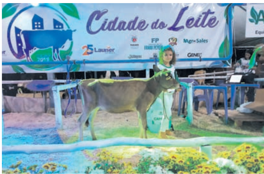
Animais pequenos e grandes, mas bom de leite, atraíram a atenção dos produtores e do público em geral