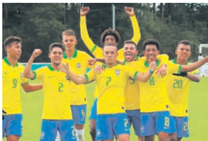
Seleção Brasileira está embalada no Mundial e é favorita para ir à final

Na sua atual campanha, a seleção goleou o Canadá por 4 a 1, bateu a Nova