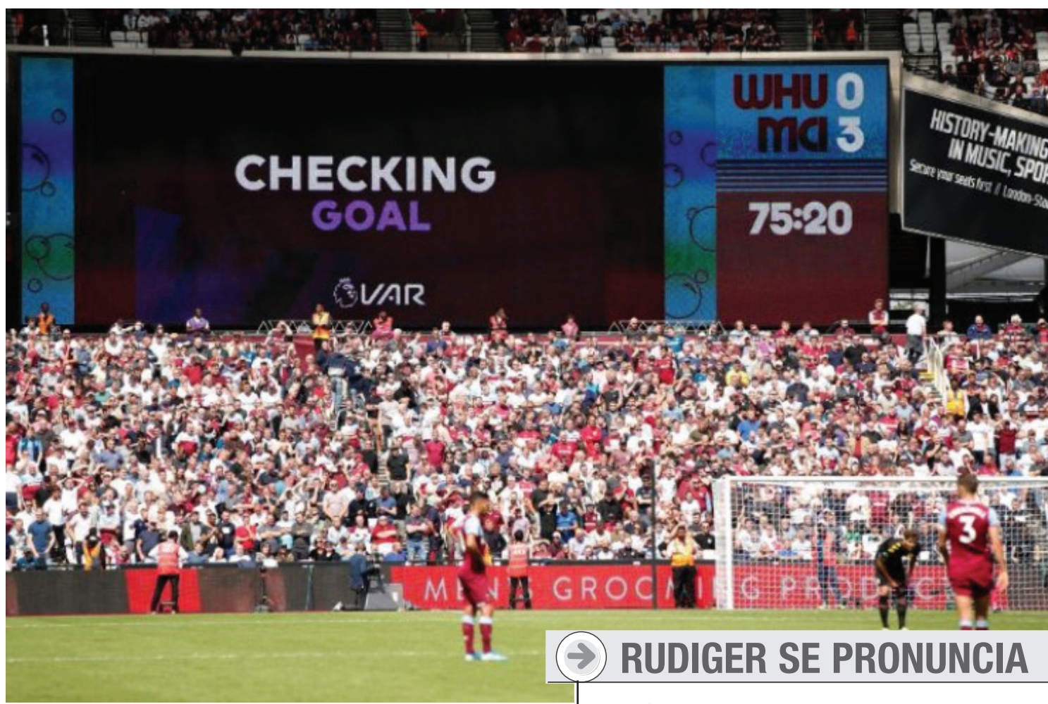
A prioridade da organizadora da liga inglesa é garantir que "a partida não seja indevidamente interrompida"

Ao ordenar o anúncio, o árbitro Anthony Taylor estava claramente seguindo o primeiro passo do protocolo antirracismo da Fifa e da Uefa, que