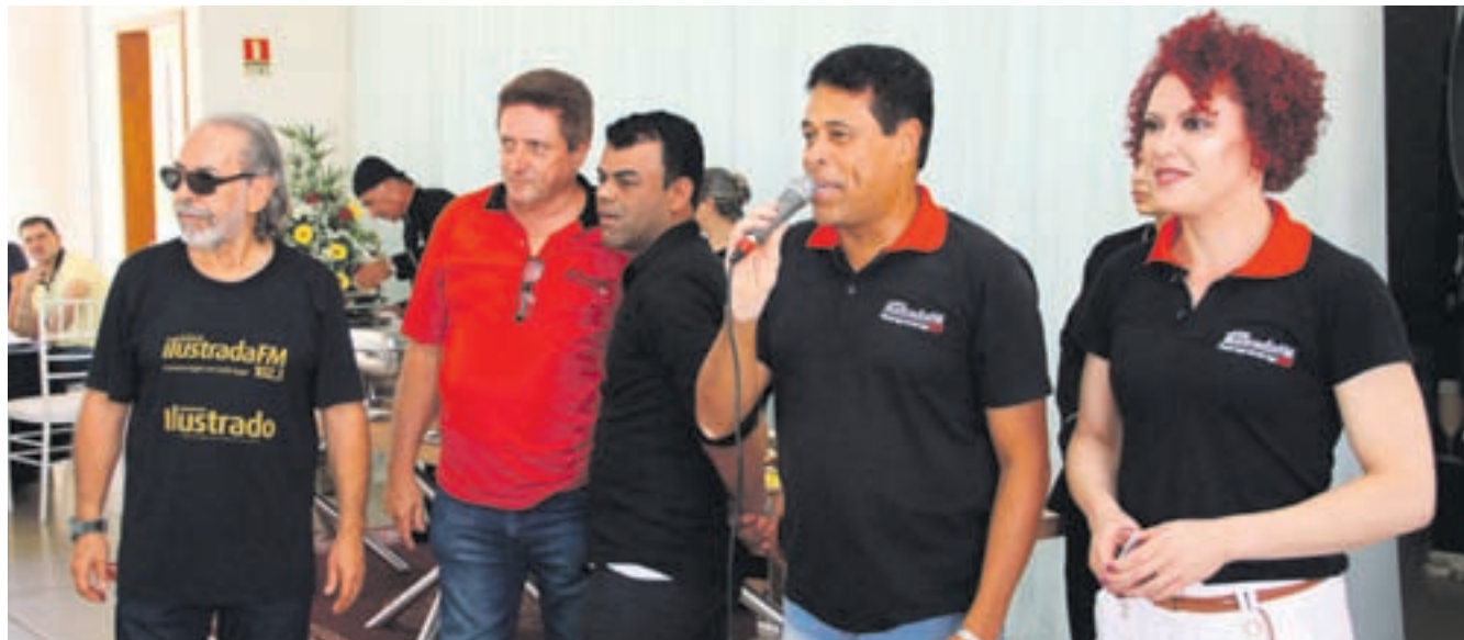
Locutores da Rádio Ilustrada FM na apresentação do evento