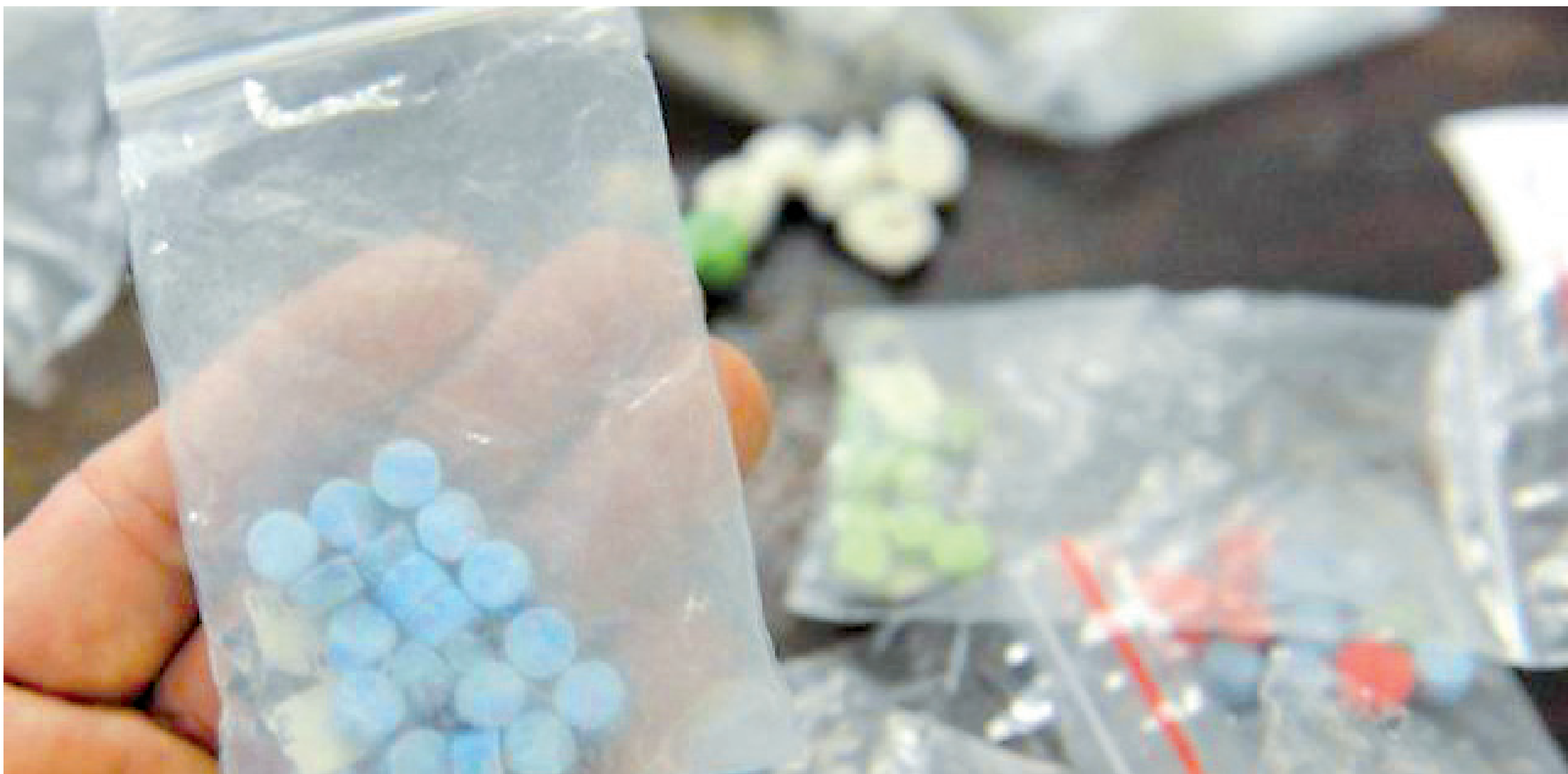
Drogas sintéticas estão invadindo festas em Umuarama, resalta mãe de jovem

com o adolescente, pois ele precisa de alguém para o defender. Os pais observam o perigo e o filho em uma situação de vulnerabilidade e acabam querendo impor as coisas. Isso gera no filho a resistência. O diálogo é fundamental na prevenção”, alertou.