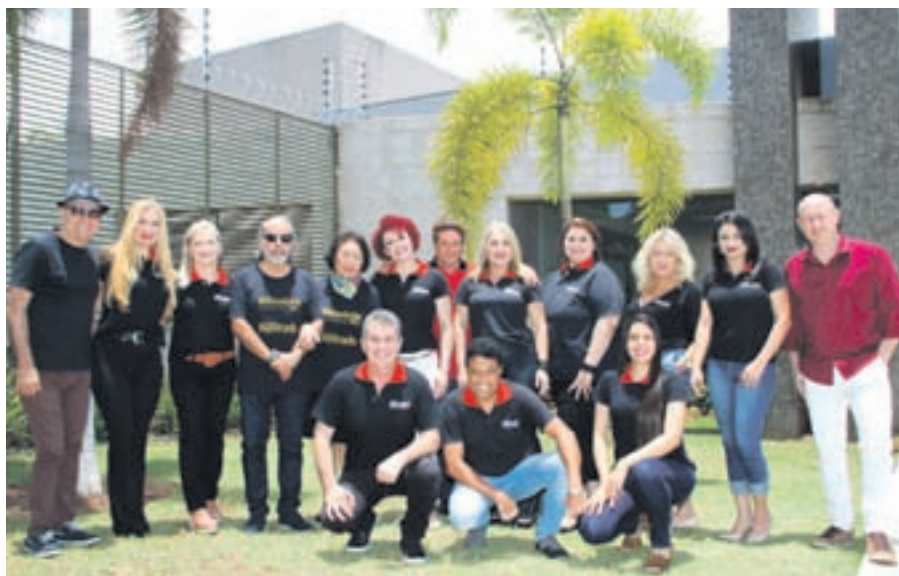
Equipe Ilustrada FM na comemoração dos 33 anos da emissora