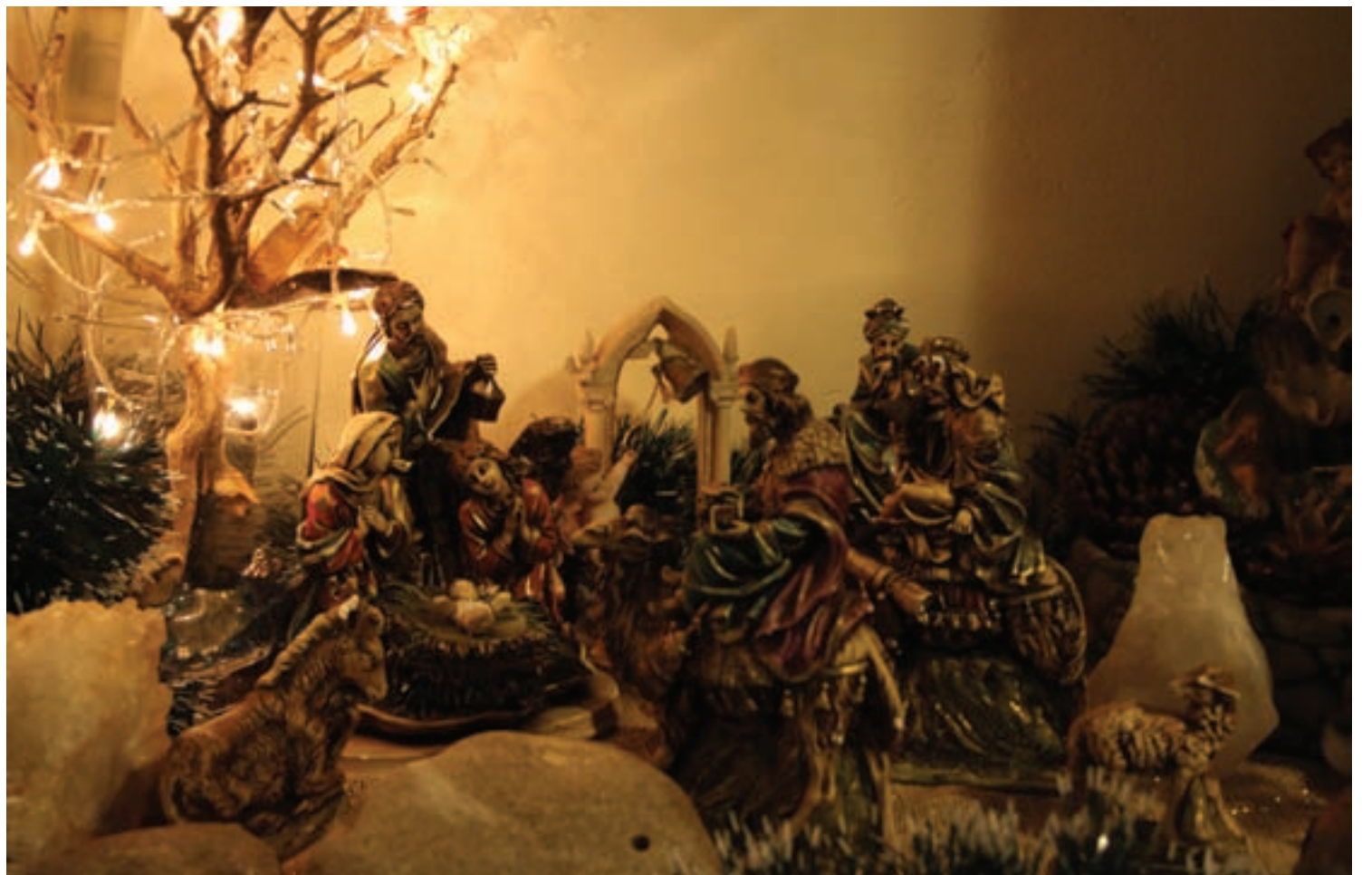
Um lindo presépio na casa de Matilde simbolizando o nascimento de Jesus Cristo