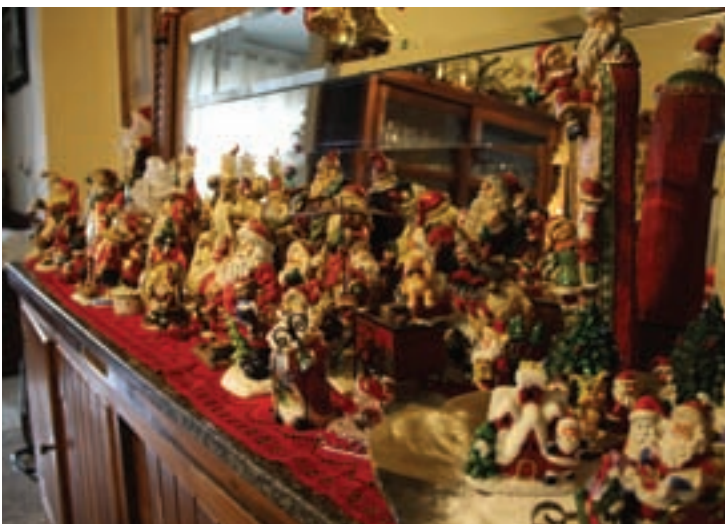
São mais de 300 Papais Noéis arrumados cuidadosamente em cada cômodo da casa