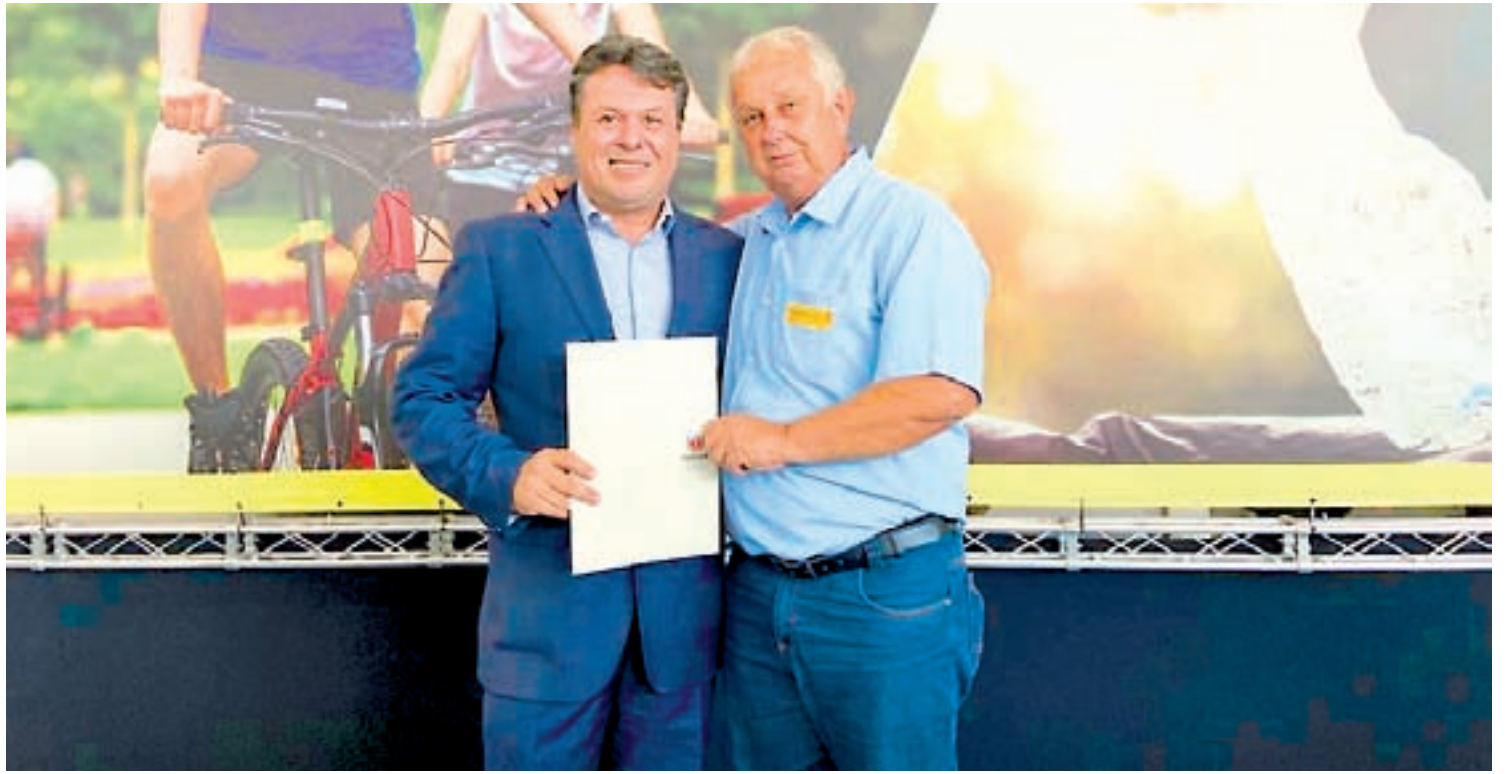
Prefeito Preto com o deputado e secretário Márcio Nunes que ajudou na liberação dos recursos

Preto ainda destaca a importância desses recursos que vem para as benfeitorias no município, e destaca que investira firme para a captação de recursos para fortalecer o turismo municipal, trazendo renda e viabilizando mais empregos aos munícipes.