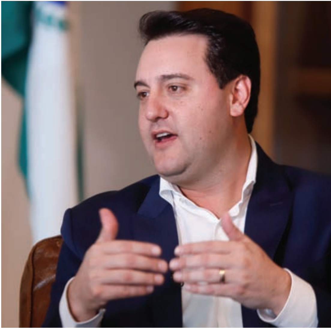
“Foi um ano de muitas conquistas para o Paraná”

Mas temos diversas outras frentes. A segunda ponte em Foz do Iguaçu, que há 30 anos prometiam e ninguém tirava do papel. Na PR-445, por exemplo, iniciamos os projetos de engenharia para duplicação de Londrina até Mauá da Serra. A Rodovia dos Minérios, na Região Metropolitana de Curitiba, já está com ordem de serviço. Colocamos o Trevo Cataratas, em Cascavel, como exigência no acordo de leniência com a concessionária. Também a ligação entre Irati e São Mateus do Sul, que é uma obra aguardada e que está com um cronograma muito bom. O intuito é ampliar bastante a