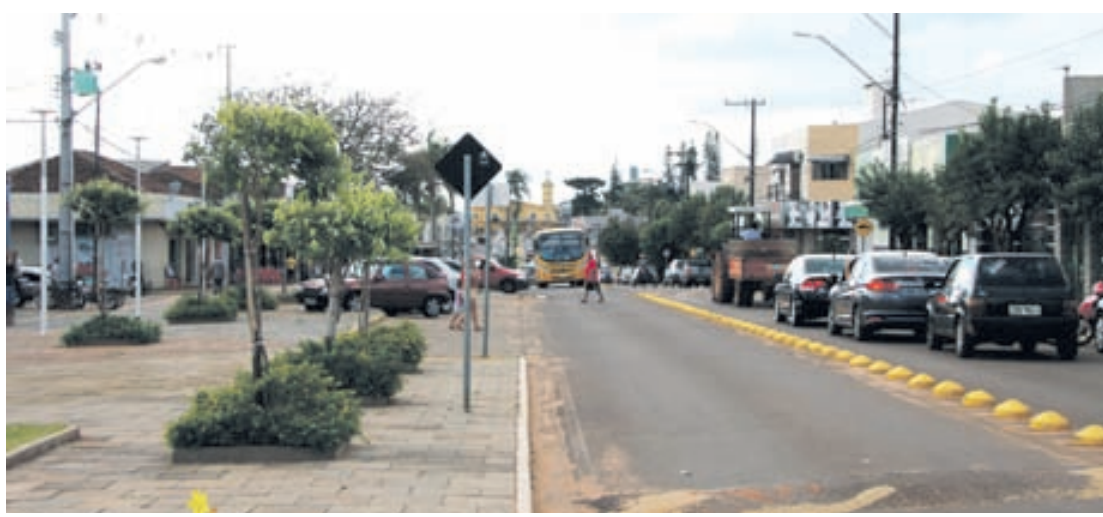
Cidade de Mariluz comemorou aniversário no dia 29