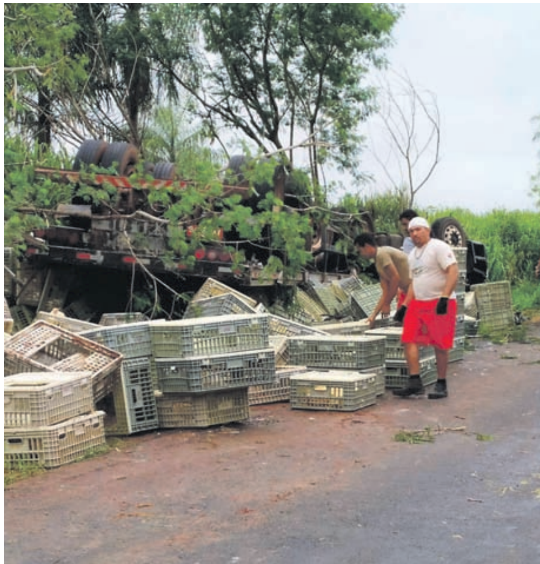
A carreta tombada estava carregada com frangos. A carga se espalhou pela pista que chegou a ficar interditada parcialmente

Segundo a Polícia Rodoviária Estadual de Cruzeiro do Oeste (PRE) Como não há nenhuma marca de frenagem no asfalto, uma hipótese considerada pelos policiais no local é de que o motorista do caminhão tenha cochilado ao volante.