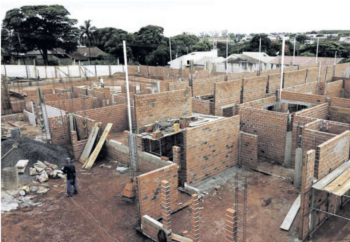
Números de projetos aprovados na construção não param de crescer

Segundo o prefeito, Umuarama tem mantido um bom volume de obras, “apesar da crise que afeta o país, e chega ao final de 2019 com níveis próximos dos atingidos em anos anteriores é uma boa notícia para encerrar bem o ano e criar perspectivas favoráveis para 2020”, completou Pozzobom.