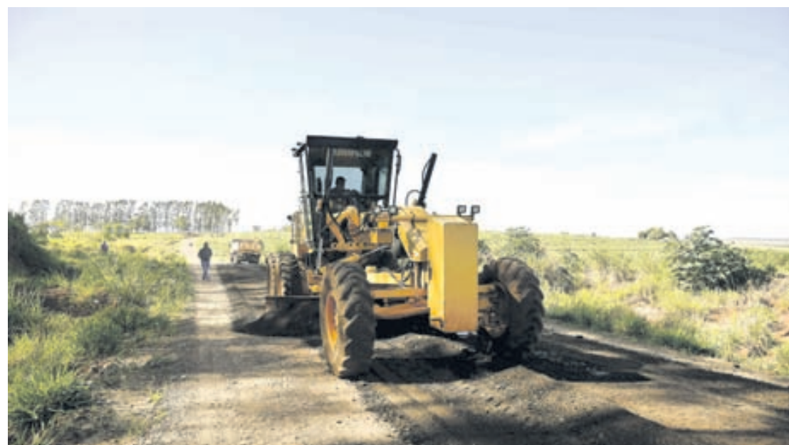
A primeira etapa do serviço foi a readequação, alargamento e construção de caixas para contenção da água das chuvas

A primeira etapa do serviço foi a readequação, alargamento e construção de caixas para contenção da água das chuvas. O trabalho foi seguido pelo cascalhamento em toda a extensão da Estrada