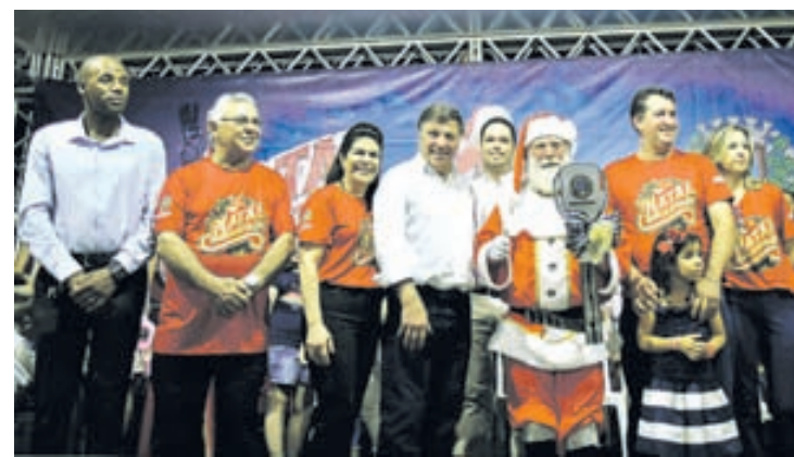
Em Umuarama, Papai Noel chegou no sábado passado à noite

Avenida Paraná, uma linda iluminação decorativa e a árvore dos desejos, onde o visitante deixará suas aspirações para o próximo ano. Papai Noel ganhou casa nova na Praça Hênio Romagnolli, onde recebe a visita de crianças e adultos, animada pela banda natalina que também percorrerá os distritos. E tem ainda concursos de gastronomia e decoração natalina.