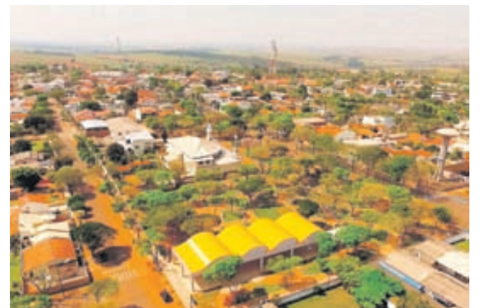
Terra Roxa comemora aniversário no próximo fim de semana

Terra Roxa - Em comemoração aos 58 anos de emancipação política administrativa, a Administração Municipal de Terra Roxa realizará um show com a dupla consolidada com mais de 35 anos de carreira Bruno e Marrone. O evento é gratuito ao público e acontecerá no próximo domingo (15/12) em frente a praça da Igreja Matriz, a partir das 21h.