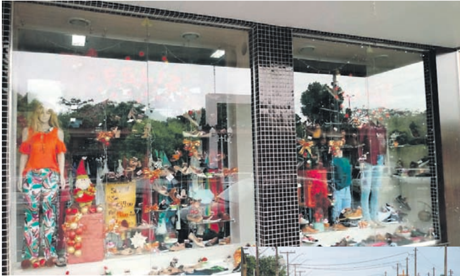
Lojistas de Alto Piquiri investiram bastante em decoração

Decoração de vitrines Dentro do Natal de Rea-